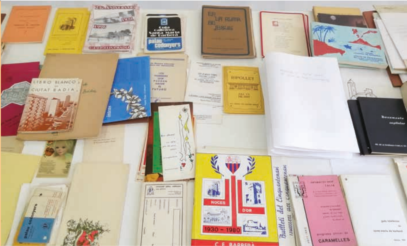
Les publicacions d'Agustí Palau i Codonyers ocupen una part fonamental de l'Arxiu de Ripollet

Les activitats van consistir a traslladar la documentació per motius de conservació, una neteja bàsica, la classificació i una ordenació sistemàtica. També s'efectua un canvi de suports i de carpetes, instal·lant-se en caps normalitzades o en planeres en el cas de tipologies especials. Per estructurar la informació de forma lògica, jeràrquica i funcional i alhora facilitar la cerca, s'elabora un Quadre de classificació. Finalment es realitza un inventari amb una descripció bàsica del contingut.