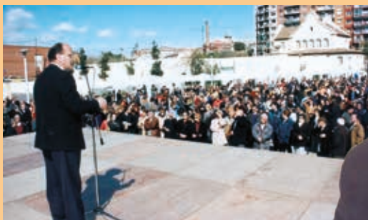
Inauguració del parc del riu Ripoll, a l'any 1999