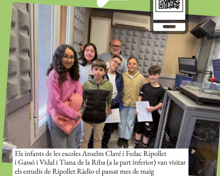
Els infants de les escoles Anselm Clavé i Fedac Ripollet i Gassó i Vidal i Tiana de la Riba (a la part inferior) van visitar els estudis de Ripollet Ràdio el passat mes de maig