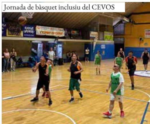
Jornada de bàsquet inclusiu del CEVOS