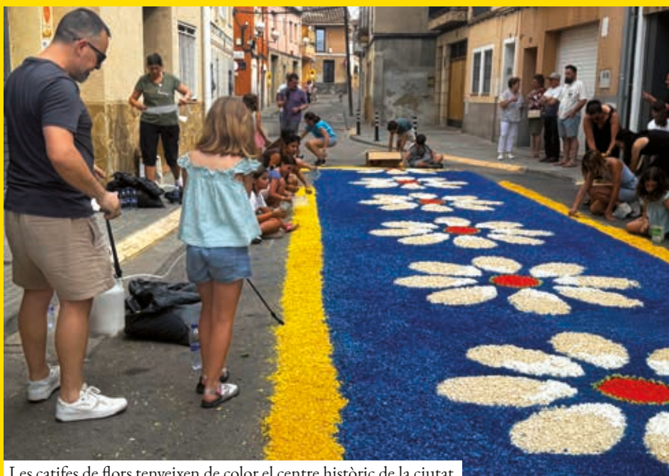
Les catifes de flors tenyeixen de color el centre històric de la ciutat

El Corpus serà, per tant, festa i tradició, però també una invitació a mirar Ripollet amb més atenció. Les catifes desapareixeran amb el pas de la processó; els objectes tornaran al Museu. Queda, però, una idea: la història és als carrers, a les cases i en allò que s'ha preservat.