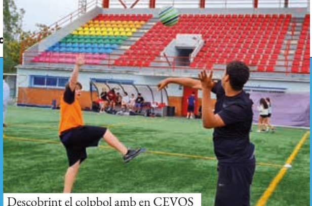
Descobrint el colpbol amb en CEVOS

física. Uns 400 nens i nenes de 6è de primària de diverses escoles van participar en una jornada de convivència i esport on es van dur a terme diferents activitats i jocs col·laboratius. Seguint l'ordre cronològic, el 15 de maig, l'Ajuntament de Ripollet amb el Consell Esportiu del Vallès Occidental Sud (CEVOS) va organitzar, al Camp de Futbol Municipal, una nova jornada per donar a conèixer esports poc coneguts, en aquest cas el colpbol. La jornada va aplegar a 170 alumnes de secundària dels instituts Pinetons i Lluís Companys. Per un altre costat, el 16 de maig es va celebrar el tradicional torneig de pàdel nocturn organitzat pel Club Tennis Ripollet. El 24 de maig, els joves esportistes de Ripollet van participar en la tercera edició del Triatló Juvenil organitzat per la RUA i que va aplegar més de 150 participants. Aquell mateix dia vam gaudir també de l'esport de motor amb la concentració de motos i cotxes clàssics de competició a la rambla dels Pinetons. El 23 de maig, el CEVOS va muntar, al Pavelló Francesc Barneda, una nova trobada inclusiva de bàsquet, organitzada conjuntament amb consells esportius de Terrassa i Sabadell. Tanquem aquest resum mensual, per descomptat, amb el JESA Ripollet, que, com sempre, ha omplert les tardes d'una extensa oferta esportiva que aquest mes ha comptat amb les jornades especials de futbol 4x4 el dia 4 de maig i la jornada multiesportiva el 26 de maig, ambdues celebrades en dies de lliure disposició a les escoles.