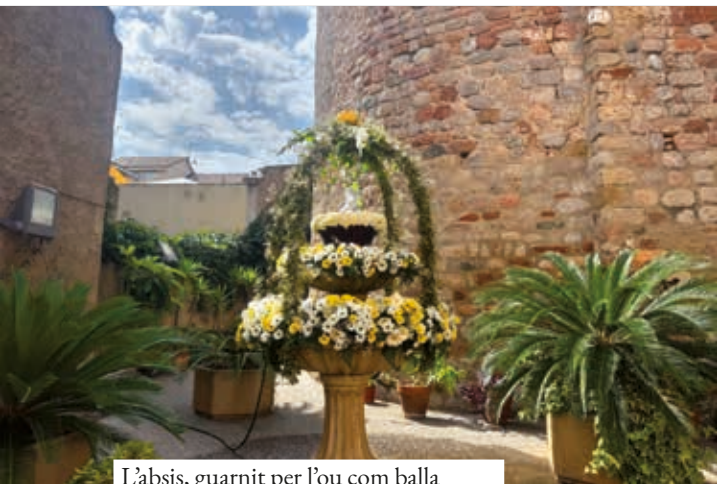
L'absis, guarnit per l'ou com balla