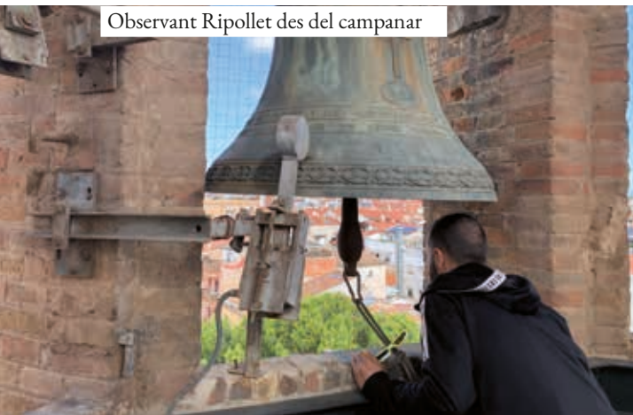
Observant Ripollet des del campanar

Al matí també es podrà visitar la seu de l'Agrupació Pessebrista de Ripollet, al carrer dels Afores. L'espai acollirà l'exposició fotogràfica Corpus 2025, d'Acció Fotogràfica Ripollet, i els diorames del darrer Nadal. A la tarda, la missa de Corpus serà a les 18 h, amb infants de Primera Comunió i catequistes. A les 19 h, el repic de campanes donarà pas a la processó del Corpus Christi, que sortirà de l'església de Sant Esteve i passarà pel carrer de la Salut, la plaça d'en Clos, Afores, Doctor Figarola, Sol, Anselm Clavé, Padró, Montcada i Nou, abans de tornar a l'església. Hi participaran el Cos de Portants parroquials del tàlem i cirials, la Banda de Música de la Societat Coral "El Vallès" i els Gegants de Ripollet i els Grallers dels Gegants Ripollet. En acabar, la festa es tancarà a la plaça de l'Església amb galetes, vi bo i un concert dels Grallers dels Gegants de Ripollet. El Corpus està organitzat per Ripollet Cultura i Tradició i la parròquia de Sant Esteve, amb la col·laboració d'Acció Fotogràfica, Gegants i Grallers, la Banda de Música de la SC "El Vallès", Pessebristes de Ripollet, Sardanistes de Ripollet i el suport de l'Ajuntament.