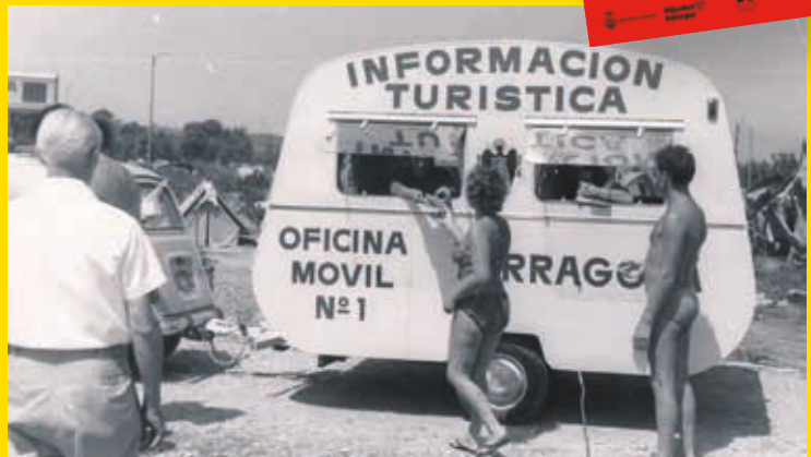
L'exposició al CIP és un recorregut per l'evolució del turisme a casa nostra

L'exposició reuneix fotografies històriques, cartells publicitaris, documents, filmacions, objectes quo-