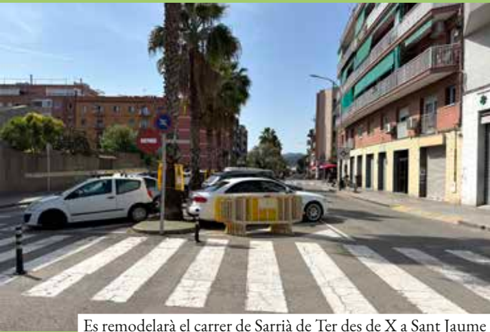
Es remodelarà el carrer de Sarrià de Ter des de X a Sant Jaume

Aquest mes de maig està previst que comencin tres de les obres més importants d'aquest mandat: la remodelació del carrer de Sarrià de Ter, des del carrer X fins a Sant Jaume; en segon guai sobre el riu Ripoll; i la nova deixalleria, que sumen més de 4 ME, dels quals l'Ajuntament només n'aportarà una tercera part i la resta serà amb subvencions.