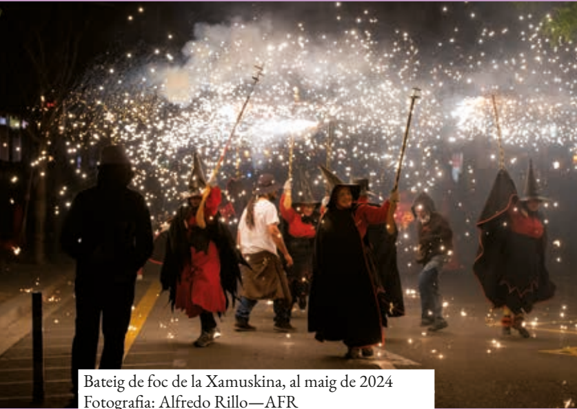
Bateig de foc de la Xamuskina, al maig de 2024