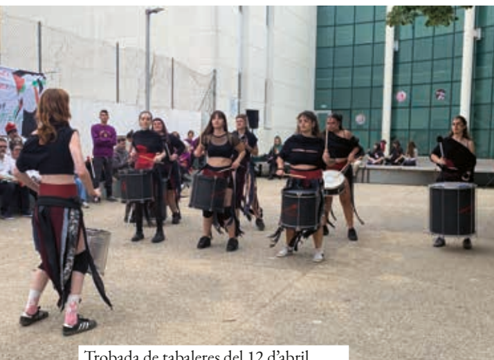
Trobada de tabaleres del 12 d'abril