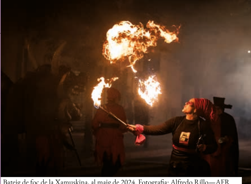
Bateig de foc de la Xamuskina, al maig de 2024.