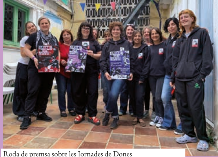
Roda de premsa sobre les Jornades de Dones