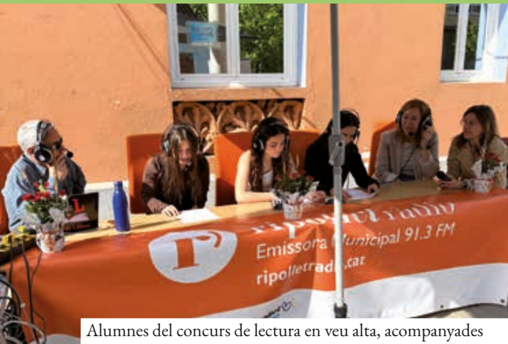
Alumnes del concurs de lectura en veu alta, acompanyades de dues professores de l'institut Palau Ausit