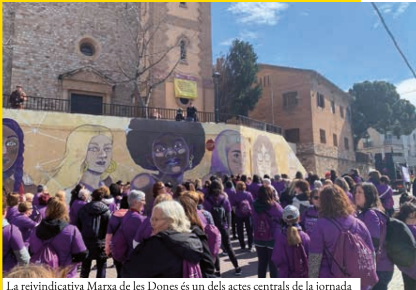
La reivindicativa Marxa de les Dones és un dels actes centrals de la jornada

Durant el mes de març s’han programat tallers intergeneracionals, activitats al Casal de Joves, espais de maternitat i cures, clubs de lectura, conferències, teatre i música. Tindran lloc en escenaris tan diversos com el Mercat Municipal, el Centre Cultural, el Teatre Auditori del Mercat Vell, el CIP Molí d’en Rata o el parc del riu Ripoll.