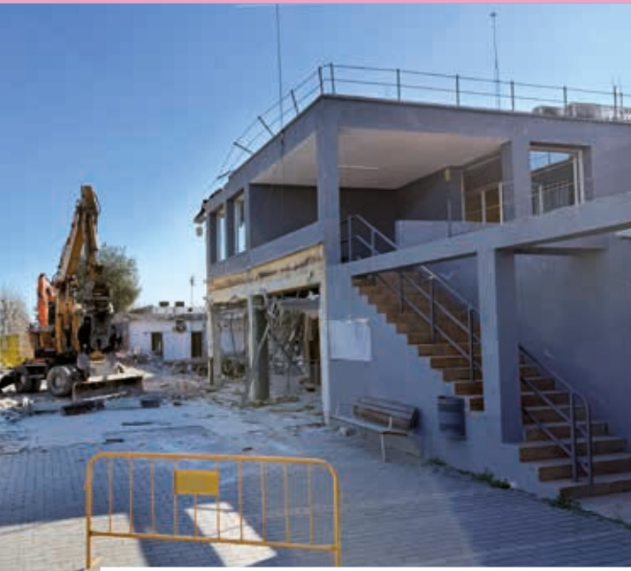
Enderrocament de l'edifici vell del Poliesportiu Municipal