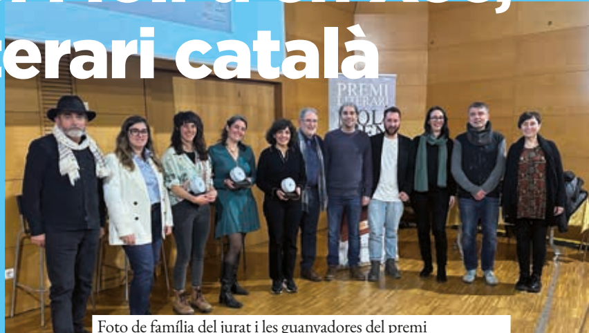
Foto de família del jurat i les guanyadores del premi

Tal vegada, enviar a un cec a fer la crònica de l'esdeveniment literari més destacat de la nostra localitat no hagi estat la decisió més assenyada, així que, si la cosa no surt com esperàveu, culpeu al director d'aquesta revista, que n'és el responsable, que un servidor prou feines ha tingut amb sortir indemne...