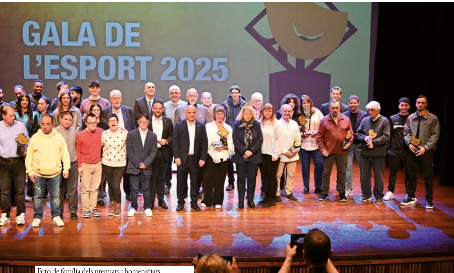
Foto de família dels premiats i homenatjats