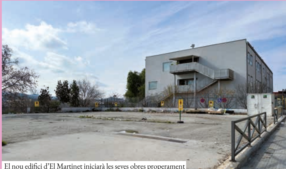
El nou edifici d'El Martinet iniciarà les seves obres properament

Com cada any, des de l'Ajuntament s'ha coordinat la difusió de la campanya de preinscripció, juntament amb els centres educatius i el Departament d'Educació i FP de la Generalitat de Catalunya, que també inclou l'atenció telefònica de dubtes sobre la zonificació i els criteris generals i específics que marca el Departament, així com el suport digital. L'Oficina Municipal d'Escolarització (OME), en el marc del Pla Educatiu d'Entorn, ha creat un espai de suport digital a la preinscripció, ja que la sol·licitud només es pot fer de forma telemàtica. Aquest servei s'oferirà a totes les famílies que ho necessitin, del 12 al 26 de març, a les oficines de Drets Socials (c. de Can Masachs, 18-20, 1a planta). Per a utilitzar aquest servei, cal reservar cita prèvia al telèfon 935 046 008.