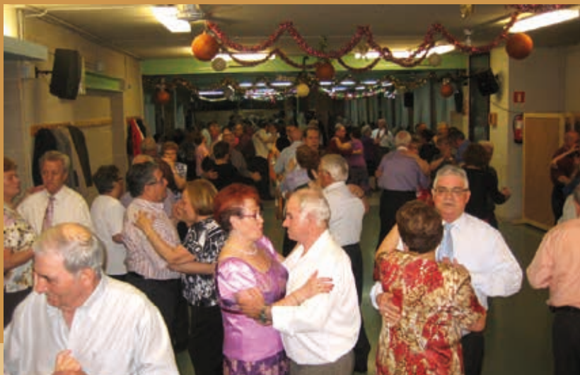
Les activitats lúdiques i físiques formen part del dia a dia de la nostra gent gran