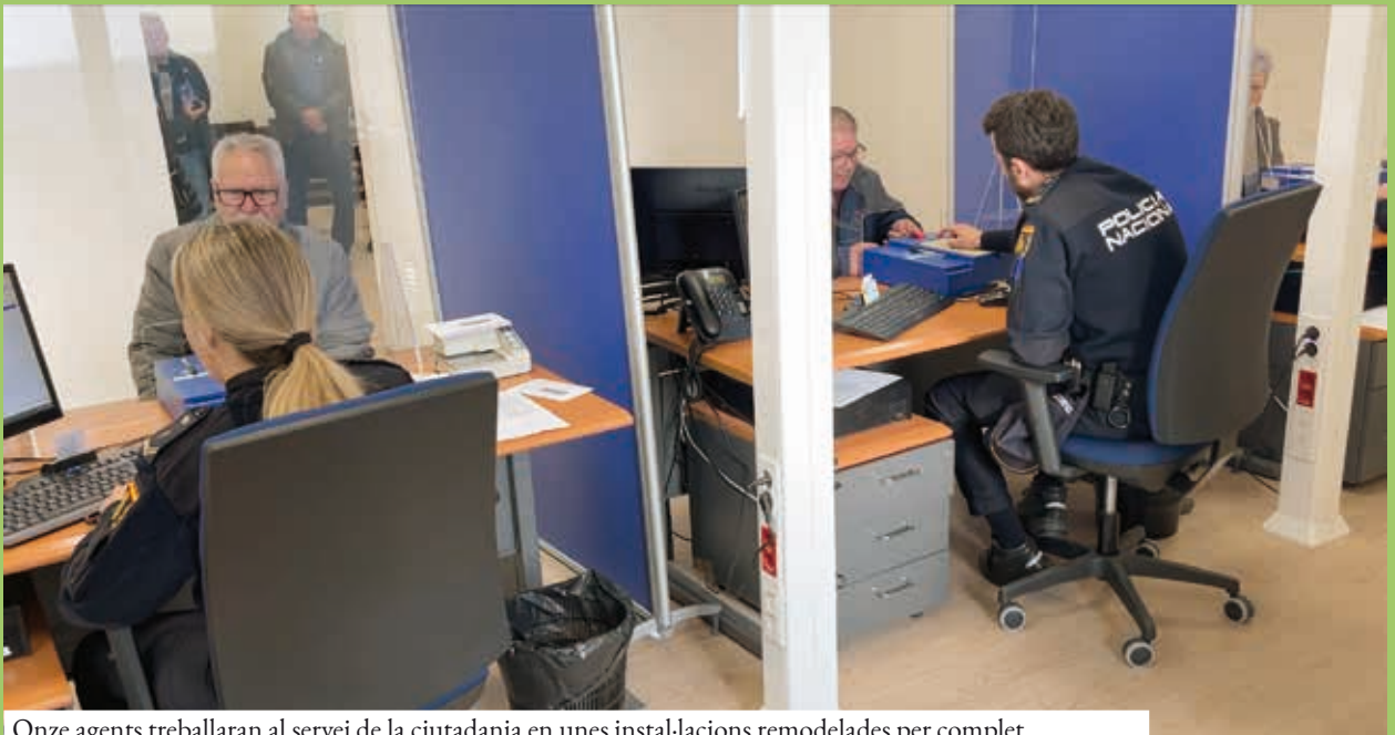
Onze agents treballaran al servei de la ciutadania en unes instal·lacions remodelades per complet