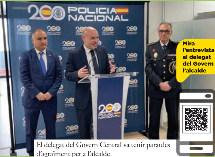
El delegat del Govern Central va tenir paraules d'agraïment per a l'alcalde