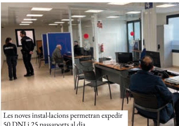
Les noves instal·lacions permetran expedir 50 DNI i 25 passaports al dia