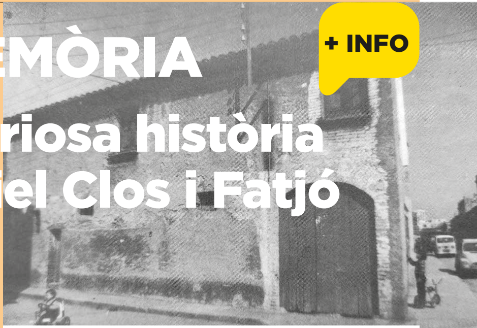
Can Clos, a l'actual pl. d'en Clos.

Els arxius conserven documents que narren successos i que són fonamentals per contextualitzar períodes passats. Recentment, molts arxius catalans participaven en la commemoració de la Setmana internacional dels arxius que organitzava la Generalitat de Catalunya, amb el lema “Busquem exploradors i exploradores d’històries”. Descobreix-les!