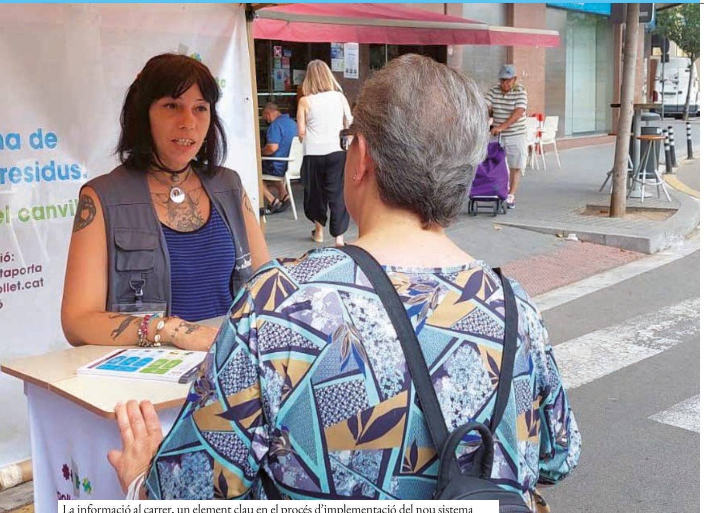
La informació al carrer, un element clau en el procés d'implementació del nou sistema