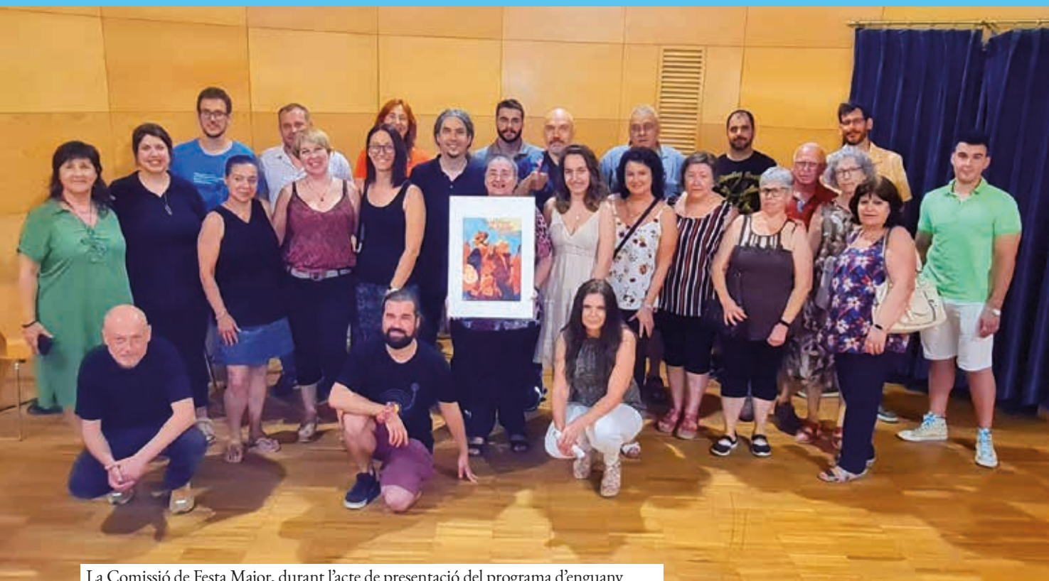
La Comissió de Festa Major, durant l'acte de presentació del programa d'enguany

La Comissió de la Festa Major de Ripollet acaba de fer públic el programa de la pròxima festa gran de la ciutat, que tindrà lloc del 26 al 29 d'agost. Aquesta comptarà amb prop d'un centenar d'activitats i donarà més espai als joves. Aquesta Festa Major serà una celebració del retorn a la normalitat.