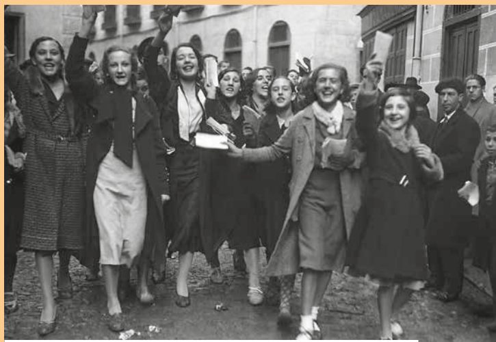
Un grup de dones celebra que ja podien votar, l'any 1933