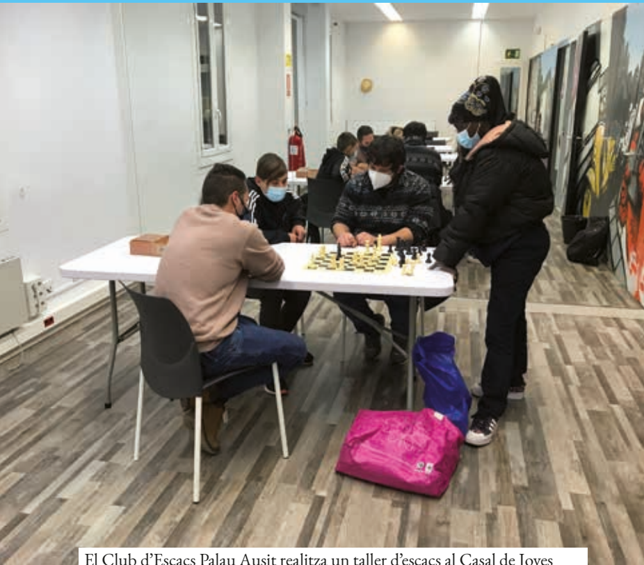
El Club d'Escacs Palau Ausit realitza un taller d'escacs al Casal de Joves