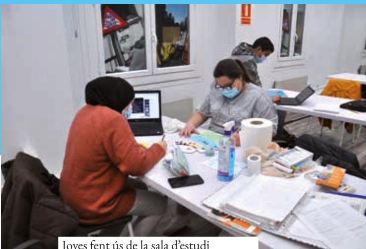
Joves fent ús de la sala d'estudi