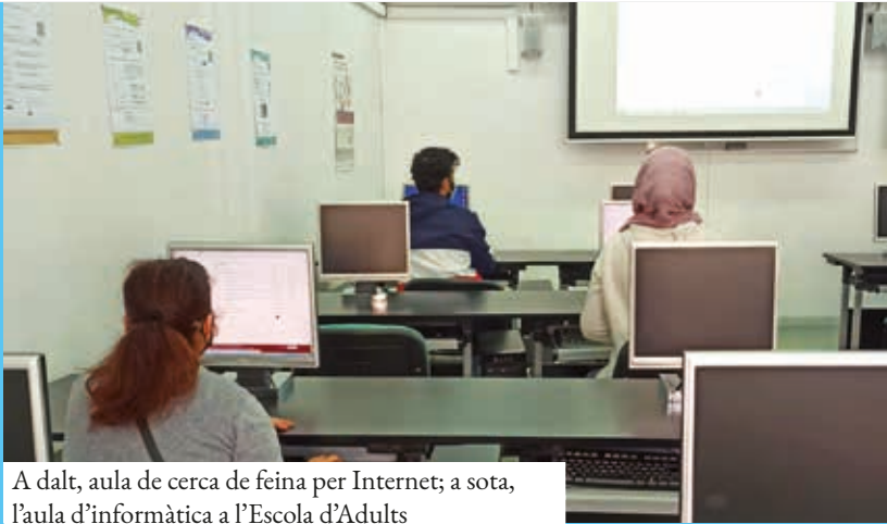
A dalt, aula de cerca de feina per Internet; a sota, l'aula d'informàtica a l'Escola d'Adults

Per la seva part, l'Associació Jaume Tuset realitza tallers d'informàtica preinicial des de zero (40 places) i un taller de mòbils, app i Internet aplicada a la vida quotidiana (40 places).