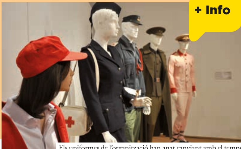
Els uniformes de l'organització han anat canviant amb el temps

Creu Roja Cerdanyola-Ripollet-Montcada inaugurava el 14 d'octubre al Museu de Ca n'Oliver de Cerdanyola l'exposició "Cent anys al teu costat", un recull d'imatges, documents i objectes que repassen els seus 100 anys d'història. Es tracta de l'eix central del centenari de l'entitat. Cent anys gens fàcils de complir, sobretot per a una organització local. La mostra, teixida amb la complicitat dels museus dels tres municipis, explica un segle d'història; la història de l'entitat, però també dels veïns i veïnes de les tres viles.