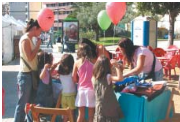
L'ESPLAI LA GRESCA VA REALITZAR ANIMACIÓ PELS INFANTS