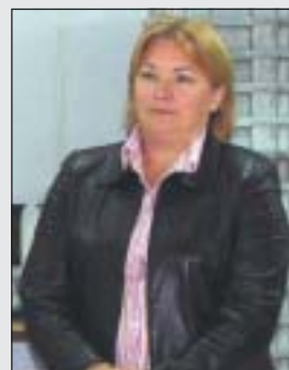
L'ALCALDESSA, ISABEL MESAS

L'INFO de Ripollet Ràdio va entrevistar, en directe, a l'alcaldeessa de Caniles, Isabel Mesas, la setmana prèvia al viatge. Extracte de l'entrevista realitzada el passat 5 d'octubre.