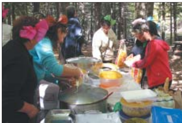
DISSABTE ES VA FER UNA VISITA A LA SIERRA DE BAZA

L'any 1998 neix entre les ciutats de Ripollet i Caniles una relació que encara continua amb intensitat fins el dia d'avui. Unes dues-centes famílies de Ripollet són originàries de la ciutat granadencana i per aquest motiu l'any 2002 neix el comitè d'agermanament.