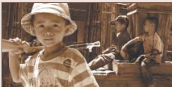
UNA DE LES FOTOGRAFIES GUANYADORES DEL PREMI PERE FARRAN

El fotògraf ripolletenc, Joan Serrano ha estat guardonat amb dos premis molt prestigiosos de fotografia: el Pere Farran, de l'Ajuntament de Sabadell i el Diari de Sabadell; i el nomenament de Serrano com Artista fotogràfic, per part de la FIAP.