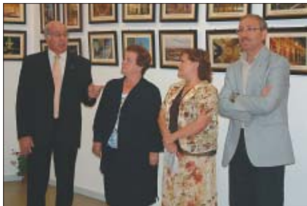
UN MOMENT DE LA INAUGURACIÓ DE L'EXPOSICIÓ "CÓRDOBA VIVA"