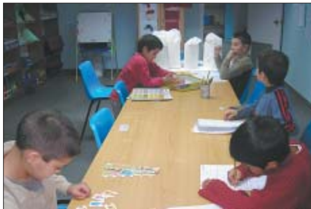
EL NENS DEL CENTRE, DURANT UN DIA DE TALLERS, EL CURS PASSAT

La Placeta és un equipament socioeducatiu al qual es realitza una tasca preventiva, oferint als nens i nenes un