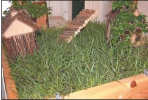
UNA DE LES CABANES QUE FORMA PART DE LA MOSTRA

Fins el 28 de desembre es pot veure a la Casa Natura la mostra 'Vuit Cabanes + 1', produïda per l'escola El Martinet. L'exposició va ser inaugurada el dissabte 6 d'octubre amb una festa adreçada a grans i petits.