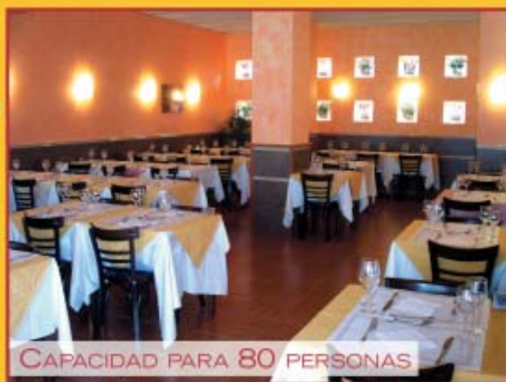
CAPACIDAD PARA 80 PERSONAS