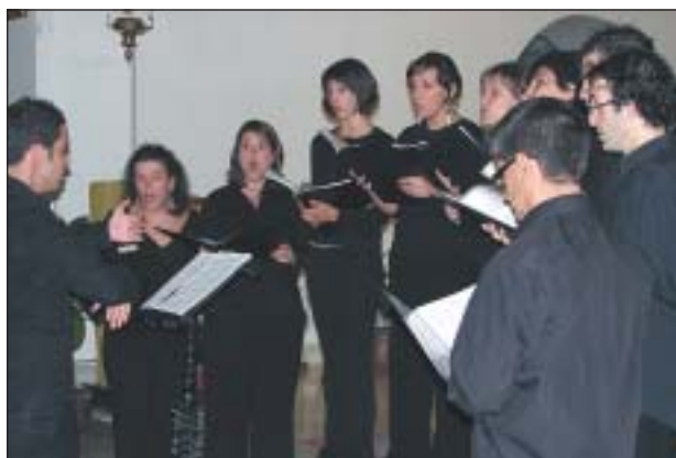
LA CORAL EL VALLÈS VA REALITZAR UNA ACTUACIÓ A L'ESGLÉSIA DEL POBLE

Una mostra de la gran relació que hi ha entre ambdues viles ha estat la darrera visita de la comissió a la ciutat granadencana. El passat pont del Pilar una vuitantena de ripolletencs i ripolletenques van viatjar a Caniles. Enguany, l'expedició va comptar amb la participació de la Coral El Vallès, de la mateixa manera que, en d'altres ocasions, havien participat Diables, els equips esportius i altres