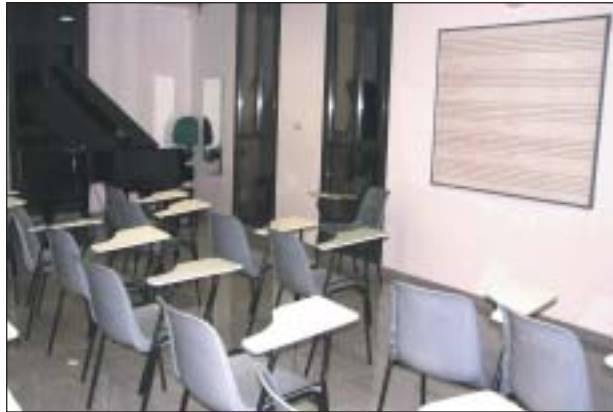
L'ESCOLA DE MÚSICA ESTÀ SITUADA A LA SEGONA PLANTA DEL CIP

fer la concessió administrativa per al lloguer de la segona planta del Centre d'Interpretació del Patrimoni, per a ús privat de l'escola de música, a càrrec de Ripollet Educació, S.L.