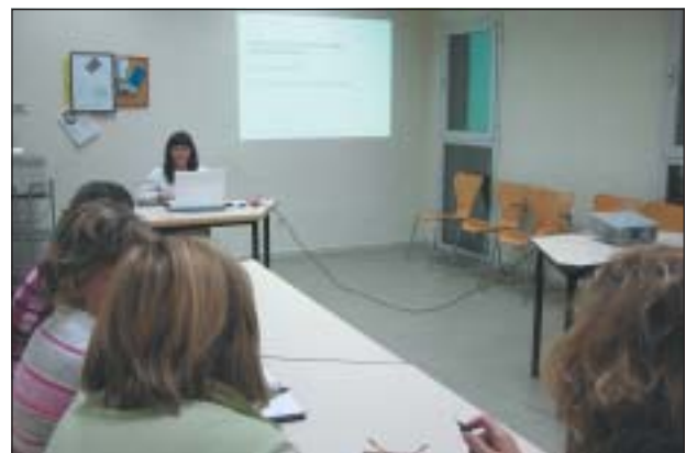
UNA DE LES SESSIONS AL CENTRE CULTURAL

El realitza Neus Miró, comissària d'exposicions i crítica d'art i s'ha realitzat el dia 24 d'octubre i els propers 7, 9 i 14 de novembre, a dos quarts de vuit del vespre, al Centre Cultural de Ripollet.