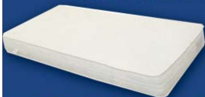
COLCHÓN VISCOLÁSTICO DESDE 298 €