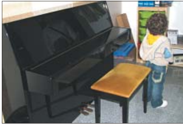
L'ESCOLA COMPTA AMB GRAN VARIETAT D'INSTRUMENTS

L'Ajuntament de Ripollet ha signat un conveni de lloguer de la segona planta del CIP com a escola de música. Enguany, 107 alumnes de Ripollet, des de els dos anys fins a adults, podran cursar diferents estudis musicals