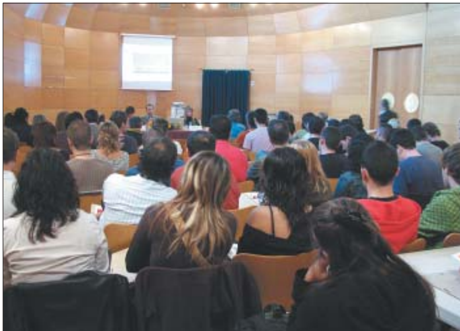
LES 3ERES JORNADES D'EDUCACIÓ VAN TENIR LLOC AL CENTRE CULTURAL