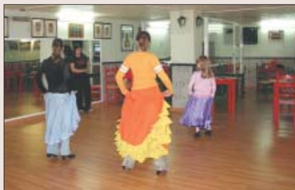
ALGUNES ALUMNES DE LA PEÑA ABANS DE COMENÇAR LA CLASSE