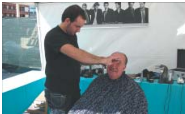
ENGUANY, VA HAVER MOLTA DIVERSITAT COMERCIAL A LA FIRA. A MÉS, EL CLUB PATINATGE ARTÍSTIC VA FER UNA PAELLA POPULAR