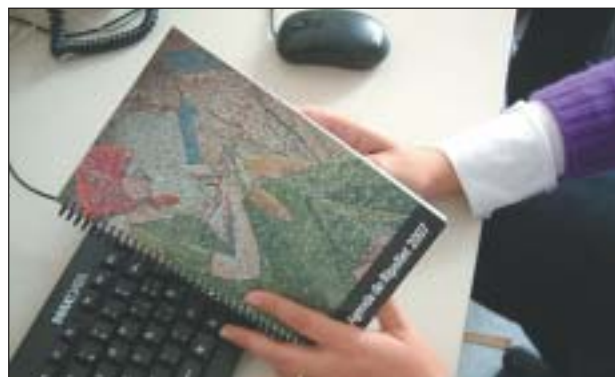
LA DARRERA GUIA-AGENDA HA ESTAT DEDICADA A L'ANY BRULL

El proper mes de desembre sortirà al carrer una nova edició de la Guia-agenda de Ripollet, que per tercer any edita el Patronat de Comunicació amb el suport de l'editorial De Barris, empresa encarregada de la impressió d'El Butlletí i la gestió publicitària de la revista municipal i l'emissora Ripollet Ràdio. Enguay el tema central de la publicació serà 'Ripollet per quatre camins'.