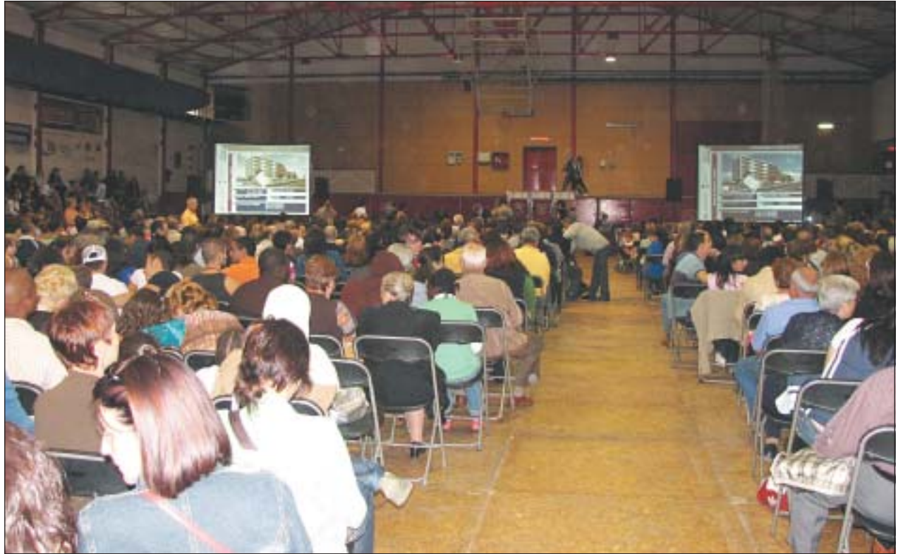
EL SORTEIG VA TENIR LLOC AL PAVELLÓ JOAN CREUS DAVANT NOTARI.

Més d'un miler de persones van seguir amb expectació el sorteig dels 128 pisos de protecció oficial, que l'Institut Metropolità de Promoció del Sòl construirà a la parcel·la, delimitada pels carrers de Puigmal, avinguda del Mediterrani, avinguda de Catalunya i la rambla de les Vinyes. La promoció serà lliurada l'any 2009 als nous propietaris, que gaudiran de preus molt més assequibles que els de mercat.