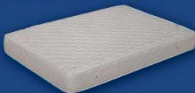
COLCHÓN MUELLES DESDE 55 €