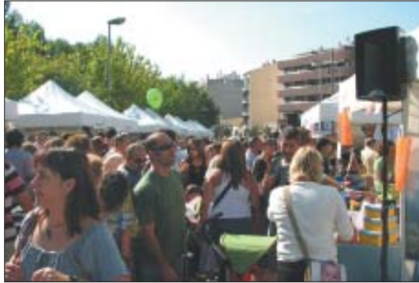
ELS ESTANDS DEL RIPOSTOCK DEL PASSAT 7 D'OCTUBRE

Després de l'èxit del passat Ripostock, que va tenir lloc el passat 7 d'octubre, la comissió organitzadora del 20è Aniversari de la Unió de Botiguers ha presentat el programa d'activitats. A partir d'aquest mes de novembre els comerços de la UBR repartiran l'àlbum de cromos Pas a Pas . Els clients dels comerços rebran per cada compra els cromos de l'àlbum que són un conjunt de fotografies inèdites antigues i modernes de Ripollet. Aquesta campanya es realitzarà fins el Sant Jordi 2008, on, aprofitant la jornada festiva, totes les persones que acabin l'àlbum entraran en el sorteig de quatre televisors de plasma. A més a més, el proper 10 de novembre es farà un sopar, al Poliesportiu Municipal Joan Creus on s'homenatjarà els expresidents de la UBR, als comerços que celebren 20 anys i als membres, que encara continuen actius, de la primera junta de la UBR. La comissió de l'aniversari també està treballant aquest dies en la campanya de Nadal, per tal d'oferir una imatge corporativa més moderna, en relació amb l'aniversari, així com també en les activitats habituals.