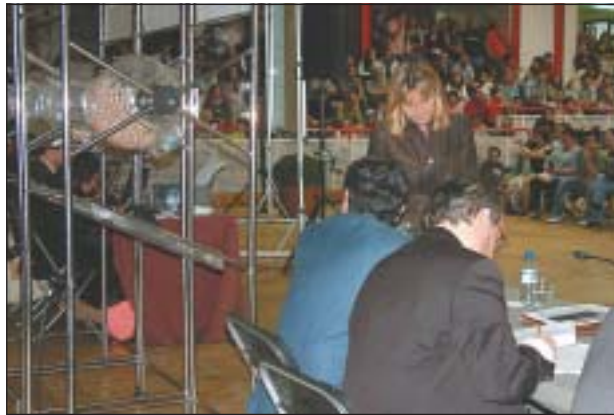
A L'ESQUERRA: ELS NOTARIS SEGUINT EL SORTEIG I DRETA, INTERESSATS I CURIOSOS A UNA UNA DE LES GRADES DEL PAVELLÓ.

La finca, situada a peu del parc dels Pinetons, té una extensió d'11.300 m 2 . A més dels pisos hi haurà locals comercials i una zona ajardinada. El govern ha avançat que pròximament es tirarà endavant la segona fase, amb altres 172 pisos.