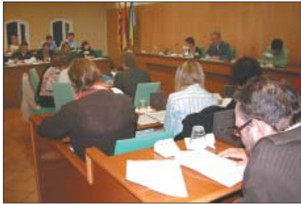
SALA DE PLENS MUNICIPAL

Les ordenances van ser aprovades amb els vots favorables del dos partits de l'equip de govern PSC i CiU, mentre que els dos de l'oposició, CpR i PP, van votar en contra.