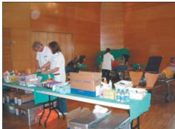
EL CENTRE CULTURAL VA ACOLLIR LA MARATÓ

A la marató de l'any 2004 es va batre el rècord de donacions, amb un total de 224.