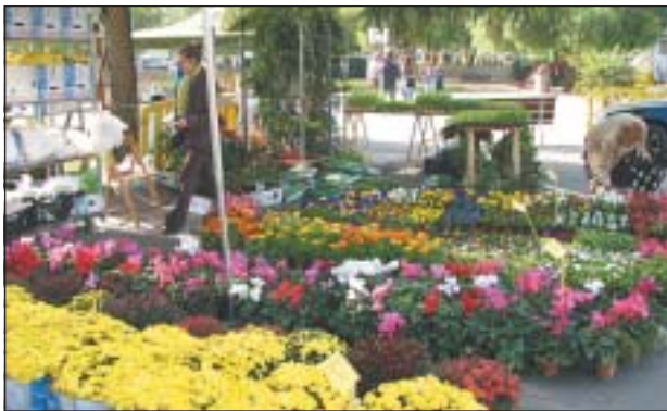
UNA DE LES ACTIVITATS DE LA FESTA DE LES 3R

El diumenge 21 d'octubre va tenir lloc, al parc del Riu Ripoll, la 3a edició de la Festa de les 3R, organitzada per les associacions de veïns de Can Clos, Can Mas i Maragall i que té com a objectiu conscienciar de la necessitat de reciclar i estalviar aigua.