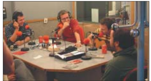
SABOTAJE VA CELEBRAR EL 25 DE SETEMBRE EL PROGRAMA N° 200

A més, cal destacar la difusió de l'esport local, que es fa a través del programa Infosport , que s'emet els dilluns i divendres a les 19 hores. Tota la programació es pot seguir també per Internet, a través de ripollet.cat .