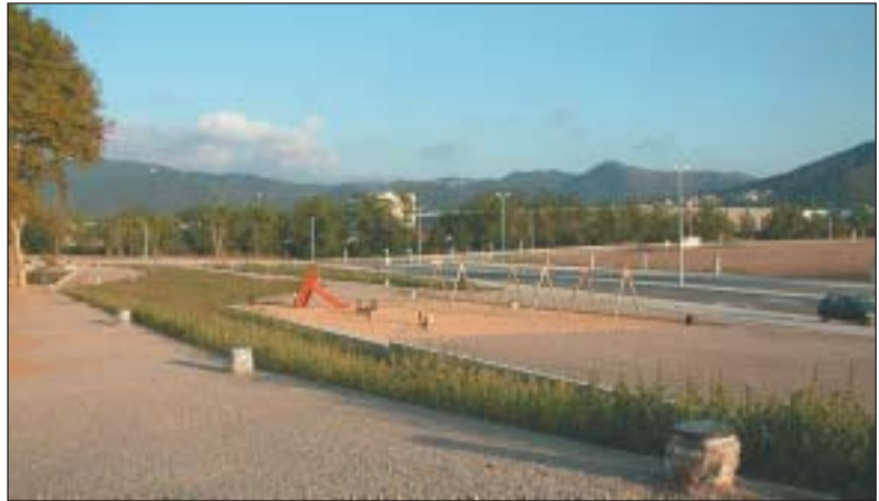
A L'ESQUERRA, EL NOU ASPECTE QUE ESTÀ COBRANT EL PARC DE FERRAN FERRÉ I A LA DRETA, EL NOU PARC DE CARLES FERRÉ, TAMBÉ EN OBRES