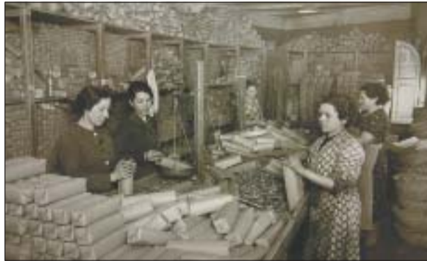
UNA DE LES FOTOGRAFIES INCLOSES A L'EXPOSICIÓ

El dimarts 18 de setembre es va inaugurar l'exposició El món del treball industrial a la Catalunya del primer terç del segle XX: les llavors de la revolució . La mostra, iniciativa de la CRAC, amb motiu de l'any Brull, va ser produïda per l'Arxiu Nacional de Catalunya l'any 2004. Les fotografies, que pertanyen al Fons Brangulí, a Gabriel Cases i a Josep Maria de Segarra, mostren la