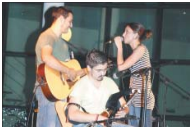
EL GRUP HAMBREST VA SER UN DELS ÈXITS D'AQUESTA FESTA MAJOR

La Festa Gran d'enguany ens ha deixat imatges entranyables i divertides