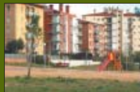
P. Molí d'en Rata 14.700 m 2