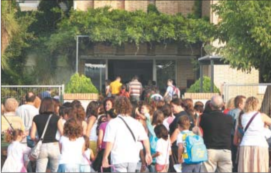
ALUMNES DEL CEIP GINESTA, EL PRIMER DIA DE CLASSE