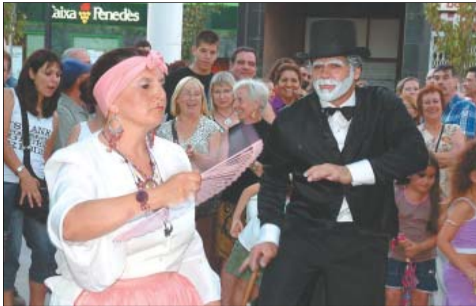
CANDOMBE DE ALLÁ LEJOS ÉS UNA DE LES ENTITATS DE RIPOLLET QUE ORGANITZA UN TALLER AL CENTRE CULTURAL

El Patronat Municipal de Cultura i Jovetut, en col·laboració amb les entitats de Ripollet, endega, un any més, els cursos i tallers que durant tot el curs tindran lloc al Centre Cultural. Guitarra, taller de disfresses per Carnestoltes o ioga, entre d'altres, formen part del paquet de desenes d'activitats que enguany s'ofereixen.