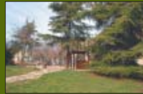
Parc de les Moreres 1.100 m 2