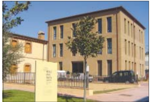
A L'ESQUERRA EL MOLÍ D'EN RATA I A LA DRETA EL CIP

El passat diumenge, 30 de setembre, el Centre d'Interpretació del Patrimoni i el Molí d'en Rata es va sumar a les Jornades Europees del Patrimoni, apadrinades pel Consell d'Europa i la Unió Europea. Així, sota el lema 'Apropa't al nostre patrimoni' al llarg del dia es van celebrar diferents activitats, com ara un taller sobre el pà, una visita guiada pel nucli antic i una jornada de portes obertes.