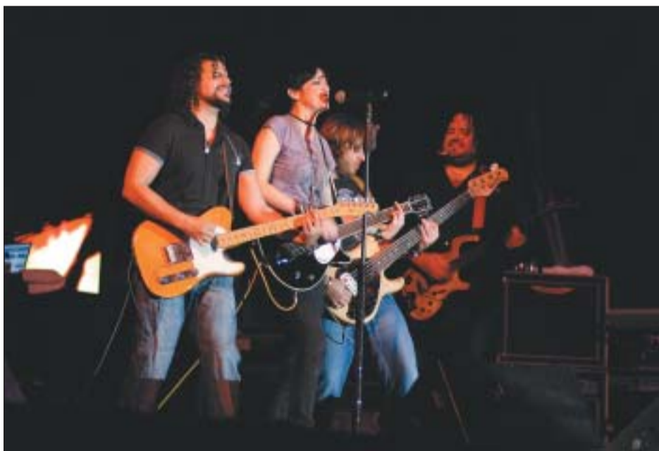
A L'ESQUERRA, MERCAT MEDIEVAL I A LA DRETA, ACTUACIÓ DEL GRUP EFECTO MARIPOSA