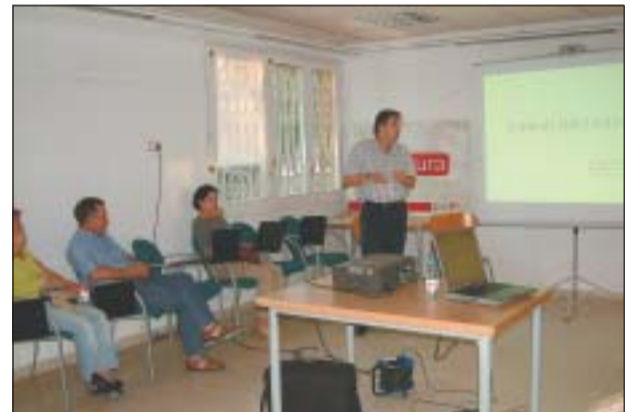
EL DR. GUIU VA REALITZAR UNA XERRADA SOBRE SALUT I ESPORT