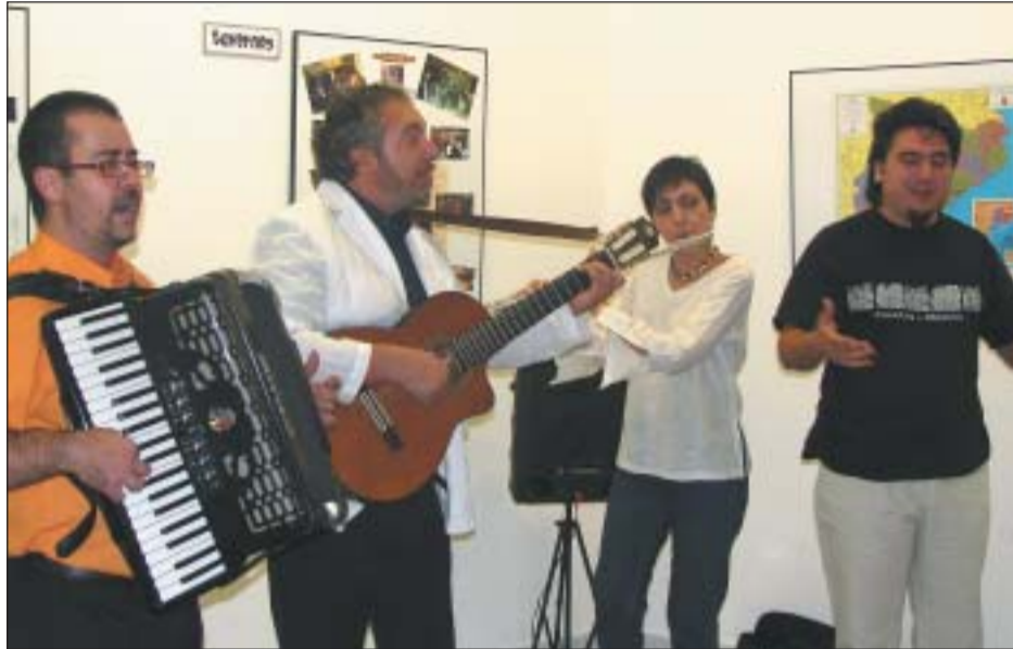
ACTUACIÓ DE L'ESPINGARI, DURANT LA INAUGURACIÓ DE L'EXPOSICIÓ DEL CENTRE CULTURAL

El grup d'havaneres Espingari ha escollit Ripollet per presentar el seu nou disc. Espingari, 25 anys cantant recull algunes de les peces mítiques del grup. El passat 15 de setembre el van fer públic, en un emotiu i original concert, amb un muntatge audiovisual, en record de la presentació del grup l'any 82, a les festes de Montcada.