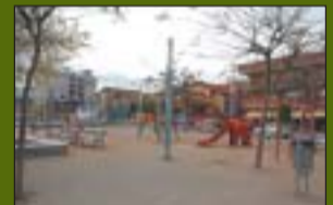
Parc de Tiana 3.200 m 2