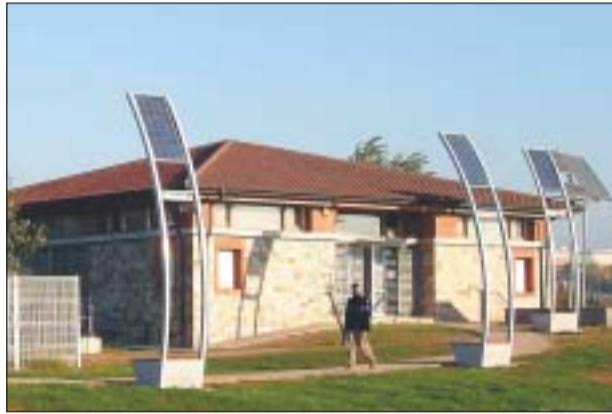
LA CASA NATURA ESTÀ SITUADA A LA CARRETERA DE SANTIGA

La Casa Natura va encetar les activitats de tardor amb dues xerrades: una sobre l'observació d'estels i l'altra sobre salut i exercici. Aquesta programació pren el relleu al Punt d'Informació del parc Pinetons, posat en marxa aquest any.