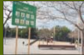
P. Norbert Fusté 6.270 m 2