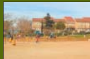
P. Oriol Martorell 16.500 m 2