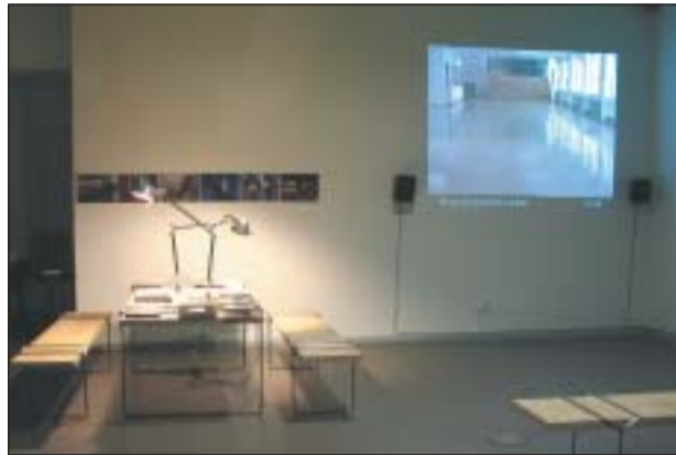
UN DELS ESPAIS DE LA EXPOSICIÓ

A mitjan setembre, el Centre Cultural va presentar la primera exposició de videoart a Ripollet, 'Sessió Continua'. Una mostra d'obres de deu artistes contemporanis, de renom internacional, que es podrà visitar fins al 28 d'octubre.