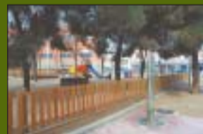
P. del Primer de Maig 8.100 m 2