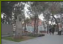
P. Anselm Clavé 3.800 m 2