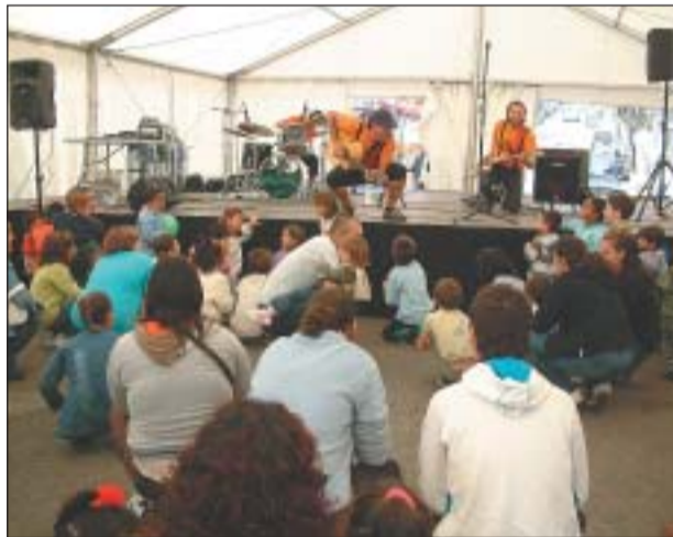
UNA DE LES ACTIVITATS DE LES FESTES DE LA TARDOR

L'últim cap de setmana de setembre es van celebrar les XXVII Festes de la Tardor del Pont Vell, organitzades per la Comissió de Festes de la Tardor. Aquesta edició va comptar amb tallers infantils, fira d'art i artesanía, havaneres i rom cremat, exhibició de patinatge artístic i la mostra de cuina multicultural, entre d'altres.