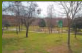
Parc de Gassó Vargas 48.962 m 2