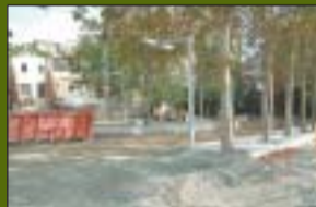
Parc de Ferran Ferré 3.293 m 2