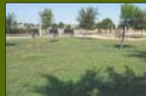
Parc dels Pinetons 211.025 m 2