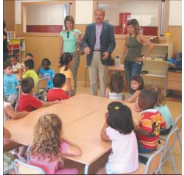
LA REGIDORA D'EDUCACIÓ I L'ALCALDE AL NOU COL·LEGI PINETONS

El passat 12 de setembre prop de 5.000 nens i nenes de Ripollet van reprendre les classes. La tònica general va ser la normalitat i l'emoció dels que s'estrenaven com escolars, sobretot els nous alumnes de P3 i P4 del vuitè col·legi públic de Ripollet, que duu el nom de Pinetons i que aquest curs