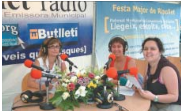
A L'ESQUERRA L'EQUIP DE PERIODISTES DEL PATRONAT DE COMUNICACIÓ I A LA DRETA UN MOMENT DEL PROGRAMA DE L'ENTITAT ALEGRÍAS DEL SUR

L'emissora municipal ha reprès la seva programació estable amb una vintena de programes, entre informatius, musicals i especialitzats. Molts d'ells es van poder veure la passada Festa Major fent ràdio cara al públic.