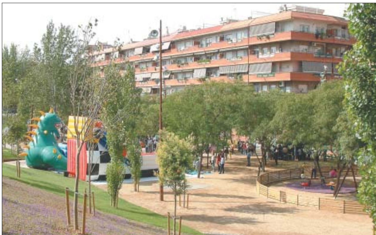
S'HA FET UNA REFORMA INTEGRAL DEL PARC, TANT DE L'ESPAI, COM DELS SERVEIS I ACCESSOS.

El dissabte 29 de setembre, coincidint amb les Festes de la Tardor de Tiana-Pont Vell, es va inaugurar la remodelació del parc de Maria Regordosa. Aquest espai, de 5.400 metres quadrats, ha estat refet completament, així com els seus accessos. Aquesta és la primera actuació acabada, de les tres del pla renove , juntament amb la reforma en marxa del parc de Ferran Ferré i el nou parc que s'està fent darrera la Comissaria dels Mossos.