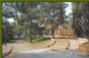
Parc de Gaudí 1.625 m 2