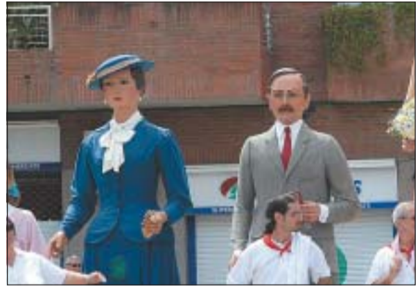
GONÇAL I TERESA PROTAGONISTES DE LA TROBADA

El dia 7 d'octubre tindrà lloc a Ripollet la 17a Trobada de Gegants. Organitzada per la CRAC, amb motiu de l'any Brull, la festa comptarà amb la presència destacada dels gegantons Gonçal i Teresa, construïts l'any