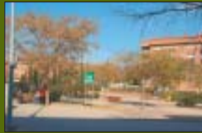
P. Dolores Ibárruri 4.708 m 2