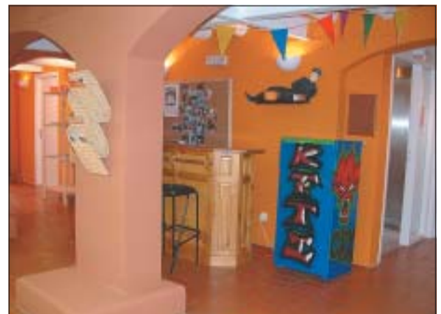
EL KFTÍ OFEREIX UN ESPAI PER AL TEMPS D'OCI DELS JOVES

tots els joves de Ripollet. El Kftí de tarda és una iniciativa de la Regidoria de Jovetut i del Patronat Municipal de Cultura i Jovetut i té com a finalitat que els joves aprenguin a ocupar el temps d'oci i de lleure potenciant valors cívics i democràtics, per tal de motivar-los a que participin en la societat.