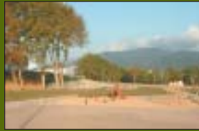
Parc de Carles Ferré 12.700 m 2

Ripollet disposa d'una vintena de parcs repartits pel terme municipal, que sumen més de 440.000 metres quadrats de superfície. La política de manteniment dels parcs aposta per la progressiva implantació d'espècies autòctones i la racionalització del reg i els productes químics.