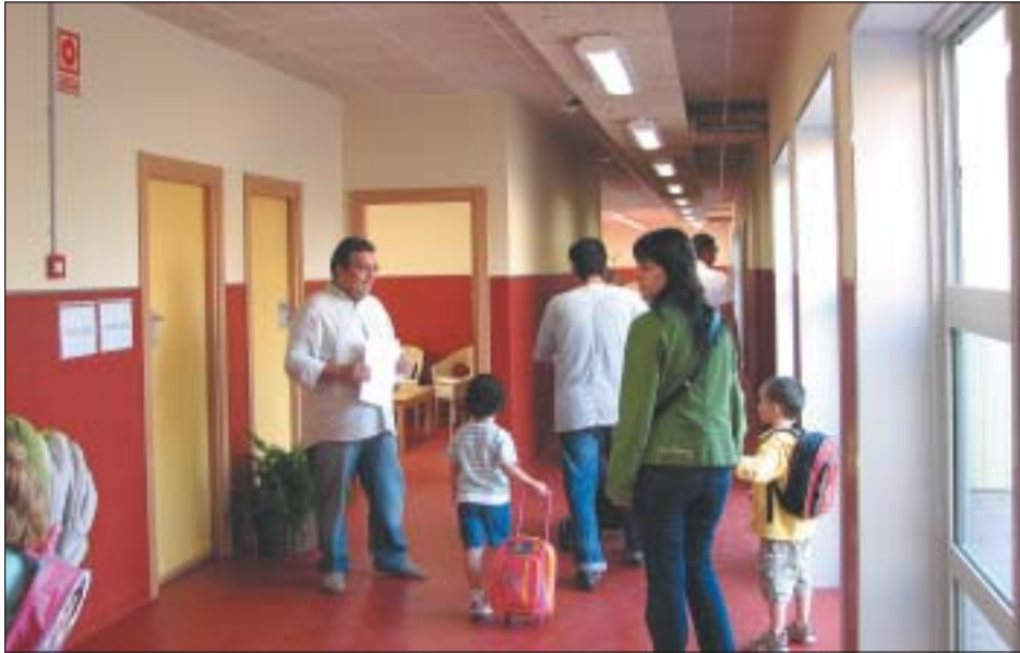
EL DIRECTOR DEL NOU CEIP PINETONS DONANT LA BENVINGUDA ALS NOUS ALUMNES DEL CENTRE

■ Ajuntament i Generalitat ja han posat en marxa la planificació per a la novena escola de la Vila