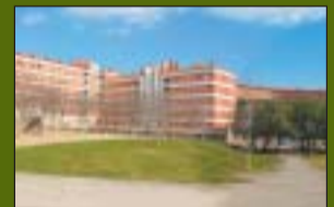
Parc de la Solidaritat 5.900 m 2