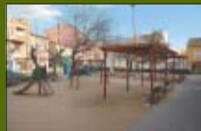
Parc dels Mestres 577 m 2