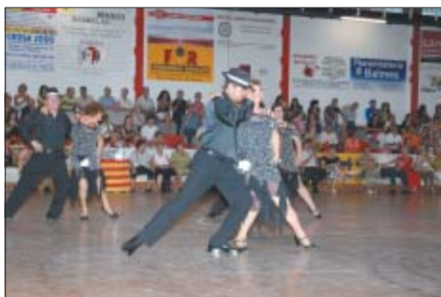
UN MOMENT DE L'EXHIBICIÓ D'AMICS DEL BALL