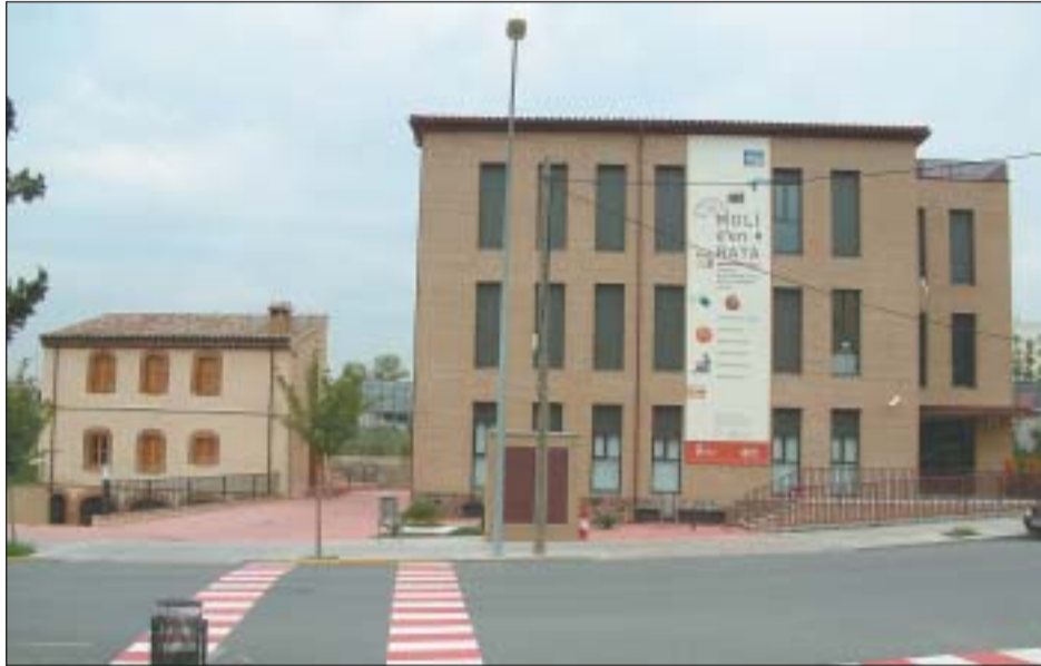
ES POSARÀ EN MARXA UNA ESCOLA DE MÚSICA MUNICIPAL A LES INSTAL·LACIONS DEL CIP

La Junta també va donar conformitat a les obres complementàries del projecte de climatització del Poliesportiu, per un import de 38.014,98 euros, adjudicades a la empresa Climatització y Energía SA. Aquesta instal·lació municipal també és beneficiària d'una partida de 200.000,39 euros per a la construcció de la nova consergeria i l'ascensor. D'altra banda, es va donar el vistiplau a la despesa per valor de 16.167,70 euros per a la construcció del bar del Poliesportiu, per part de l'empresa Instal·lació S.L, i es va ratificar la reparació de la gespa de la piscina descoberta, per un import de 25.399,36 euros, a l'empresa