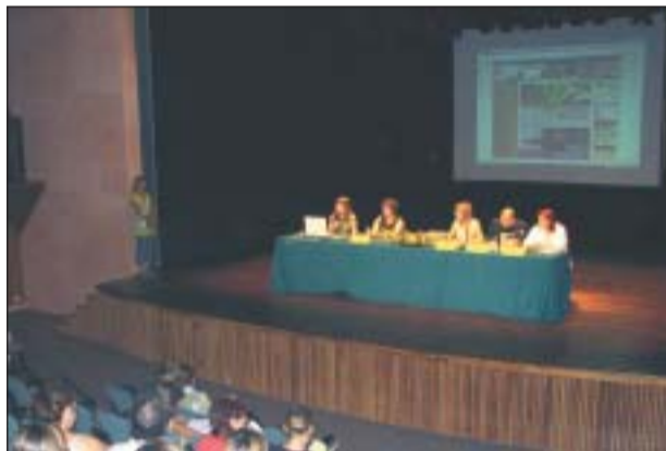
PRESENTACIÓ DE LA GUIA, AL TEATRE AUDITORI, EL 6 DE SETEMBRE

La Regidoria d'Educació i Polítiques d'Igualtat va presentar a la comunitat educativa la nova Guia d'Activitats Educatives del curs 2007-2008, que compta amb un centenar d'activitats d'educació i lleure, complementàries als cicles escolars.