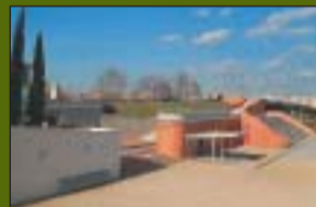
Parc de Massot 16.572 m 2