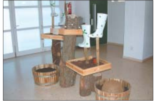
UNA DE LES PECES DE L'EXPOSICIÓ 'CABANES'

El programa de tardor va començar el passat 22 de setembre amb la segona trobada per observar estels, amb la col·laboració de l'Associació Astronòmica de Sabadell, que va comptar amb una trentena de participants. Amb motiu de la Setmana de la Mobilitat es va organitzar una xerrada sobre l'exercici i la salut i es va presentar 'Ripollet per Quatre Camins'. Seguidament, el 30 de setembre va tenir lloc un d'aquest recorreguts, pel Ripollet Botànic.