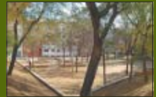
Parc de Rizal 2.603 m 2