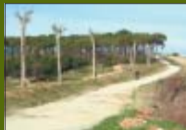
Bosc dels Pinetons 36.178 m 2