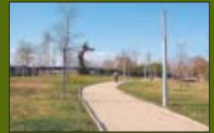
Parc del Riu Ripoll 18.678 m 2