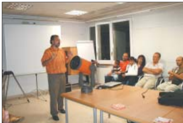
L'ASSOCIACIÓ ASTRONÒMICA VA OFERIR UNA CONFERÈNCIA

A mitjan mes els bolets cobraran protagonisme i per novembre s'ha previst l'organització d'uns tallers sobre energia solar i una nova exposició d'interès mediambiental.