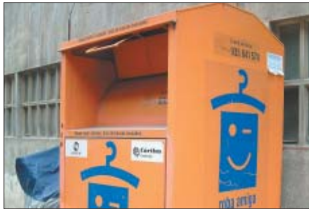
UN DELS CONTENIDORS DE ROBA AMIGA

El projecte Roba Amiga ha fet la valoració dels 6 primers mesos de 2007. Les dades conclouen que, a Ripollet, s'han recollit, de forma selectiva, un total de 37.050 kg de material tèxtil, procedent dels 16 contenidors instal·lats a la ciutat.