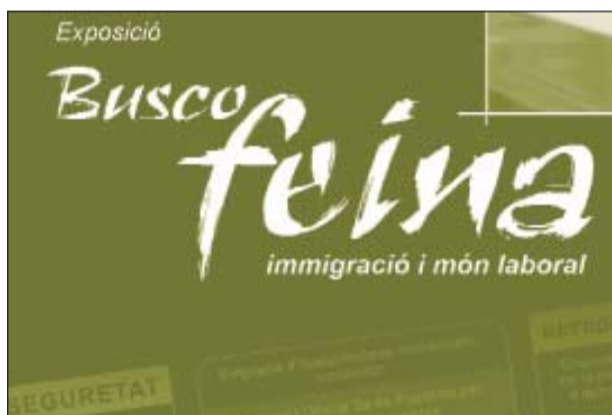
CARTELL DE L'EXPOSICIÓN

L'exposició 'Busco feina! Immigració i món laboral', forma part d'un projecte expositiu més ampli que tracta de recollir diferents aspectes sobre la realitat quotidiana de la immigració a Catalunya. La mostra està formada per diversos elements de petit format, que combinen els materials visuals amb breus textos explicatius, i s'acompanyen d'enregistraments audiovisuals, que recullen les diferents experiències personals de diversos protagonistes d'aquests processos migratoris. L'exposició va adreçada principalment als alumnes de tercer i