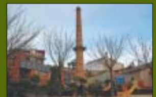
Parc de la Xemenia 1.825 m 2

NONELL I CANALS, S.L.L. CORREDORIA D'ASSEGURANCES J174GC