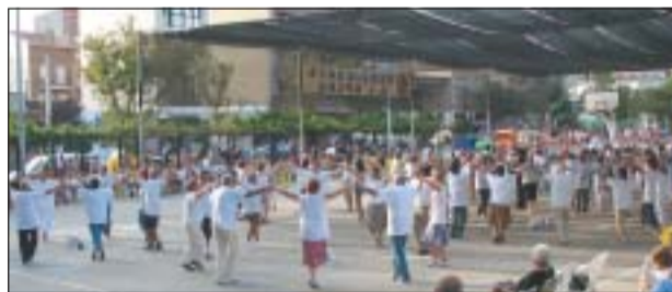
A DALT, LA PRIMERA EDICIÓ DE L'APLEC. A SOTA, L'EDICIÓ D'ENGUANY