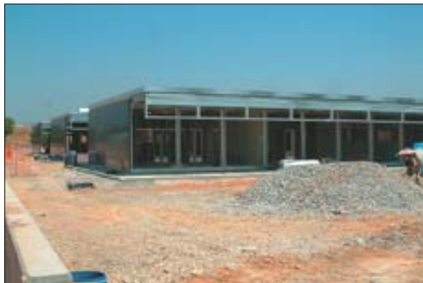
ESTAT ACTUAL DE LES OBRES DE L'ESCOLA PINETONS

El proper 12 de setembre està previst que puguin entrar en funcionament els edificis de preescolar del nou col·legi Els Pinetons. El projecte, en un avançat procés d'execució, segueix el sistema utilitzat al CEIP El Martinet, de tipus industrialitzat.