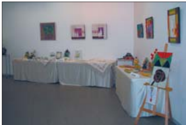
UNA MOSTRA DELS TREBALLS REALITZATS

Després de tot un curs d'aprenentatge i treball, els alumnes dels tallers, que el PMCij organitza al Centre Cultural, han exposat les seves obres durant tot el mes de juny. Pintura, fang, vidre o roba han estat alguns dels suports materials de les peces.