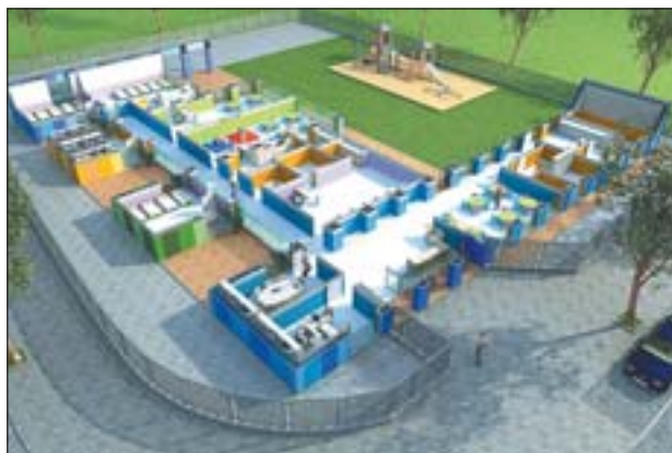
MAQUETA DE LA SEGONA LLAR D'INFANTS

2A FASE DEL CEIP PINETONS En breu es farà la licitació de la resta del complex escolar per tal que pugui proseguir la seva construcció i tenir en funcionament el 100% de les instal·lacions a l'inici del curs 2008-2009. En total l'escola s'ha pressupostat en 8 milions d'euros.