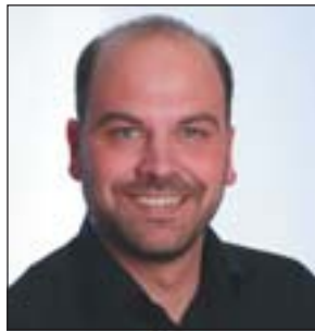
FERRAN TORNEL. Tinent d'ALCALDE. REG. CULTURA I JOVENTUT