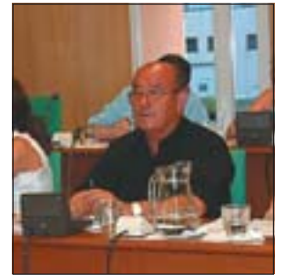
SESSIÓ DEL 16/6 PÀG. 3.

Durant aquest temps havia estat al càrrec de Manteniment, Parcs i Jardins i el Patronat d'Ocupació.