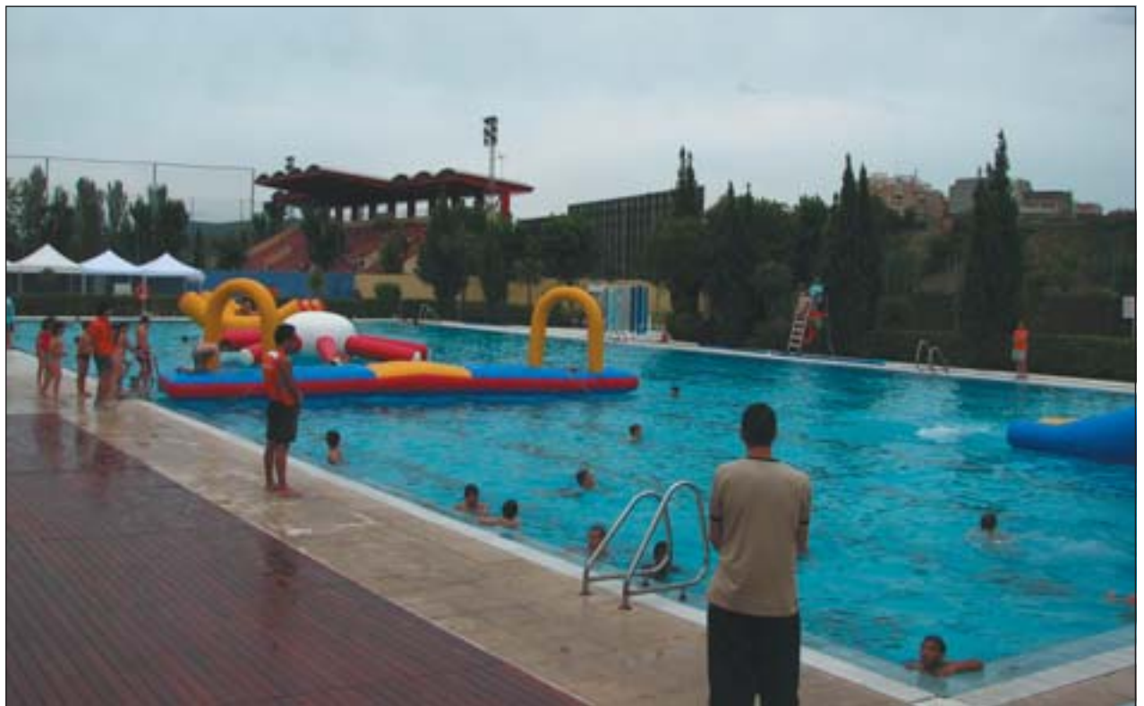
LES PISCINES, OBERTES AL PÚBLIC, TAMBÉ VAN FORMAR PART DE LA FESTA DE L'ESPORT 2007

Durant el matí, prop d'un miler de nens i nenes van participar a la festa de cloenda de l'esport extraescolar. Van poder gaudir de jocs, inflables, proves esportives i sorteig de regals. Com és habitual, la festa va comptar també amb un gran nombre d'actuacions a càrrec