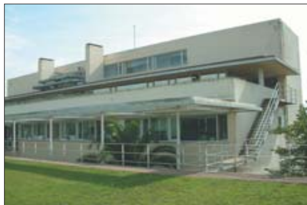
EL CENTRE D'URGÈNCIES DEL S.A.P. Cerdanyola-Ripollet

El nou Centre d'Urgències 24 hores, situat al cap del carrer de Tarragona, està completant el seu equipament amb mitjans de suport en radiologia, cardiologia i traumatologia. El centre va començar a funcionar el passat mes de maig i té atenció ininterrompuda.