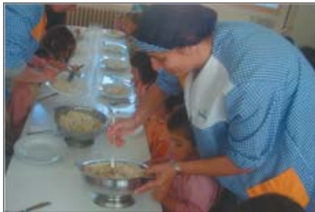
LES ALUMNES DEL CURS, EN UN MENJADOR ESCOLAR

Més del 70% dels alumnes que han participat al programa ILO-SER, del Patronat d'Ocupació, de monitors de lleure i menjador han finalitzat el curs amb èxit i la meitat ja han trobat feina a partir de les pràctiques realitzades.