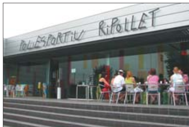
NOVA RETOLACIÓ DEL POLIESPORTIU

En total, de 2005 a 2007, s'han invertit més de 2,5 milions d'euros en la millora del poliesportiu. L'objectiu del Patronat Municipal d'Esports, amb aquest Pla director 2005-2011, serà arribar a convertir la instal·lació en un parc de l'esport de 45.000 metres quadrats. Actualment l'equipament ja compta amb més d'11.000 socis.