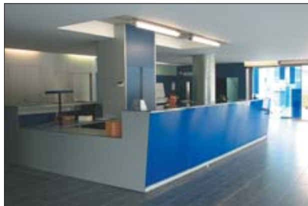
EL VESTÍBUL S'HA REMODELAT COMPLETAMENT

A final de juny va concloure la primera fase del Pla director del Poliesportiu, amb la inauguració d'una nova piscina exterior i la remodelació de la petita circular. Aquestes instal·lacions van obrir al públic el passat 16 de juny, coincidint amb la Festa de l'Esport.