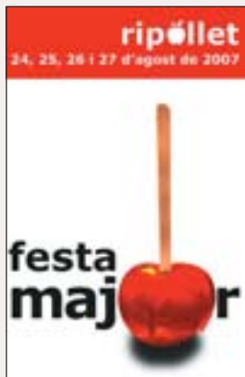
CARTELL DE LA FESTA MAJOR '07

El grup d'alumnes del curs de Photoshop, organitzat pel Casal de Joves, ha guanyat el concurs de Cartells de Festa Major de Ripollet d'enguany. Un total d'onze obres van optar a l'edició del certamen, una participació molt similar a la registrada en l'anterior convocatòria. El jurat va