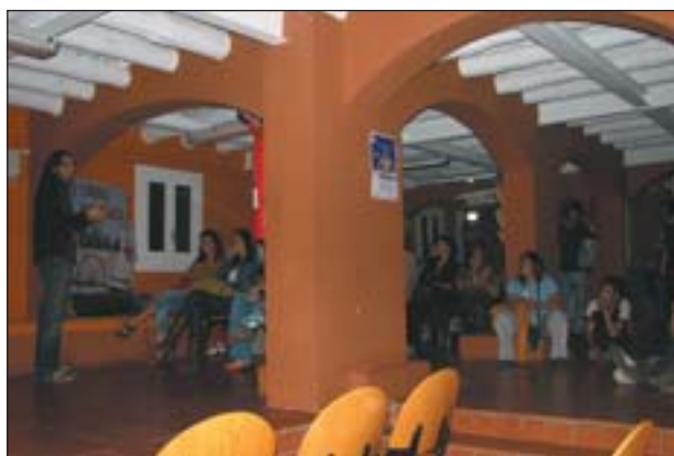
EL CERTAMEN DE MONÒLEGS AL KFTÍ DE NIT

Durant el mes de juny el Kftí ha realitzat, per als joves, diferents activitats, com ara tallers de graffiti, d'interculturalitat i altres dins la festa de la Gibrelleta, tots ells gratuïts. D'altra banda, també continua l'espai amb ordinadors per connectar-se a Internet o les partides de Play Station. Aquest juliol tindran lloc més tallers, que continuaran durant l'últim trimestre de