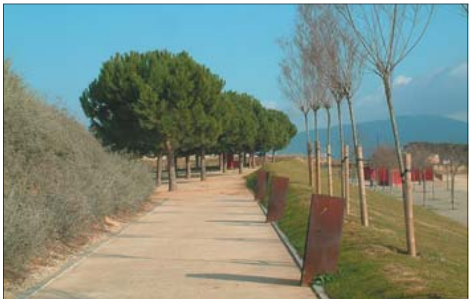
EL PARC PINETONS CONTINUA EL PROCÉS DE REMODELACIÓ I MILLORA

Aquesta JGL va destacar principalment per la concessió de diferents ajuts del departament de Serveis socials, per un import total superior als 7.300 euros. Entre d'altres punts de tràmit cal indicar l'aprovació del pressupost que es destinarà la Festa de la Gibrelleta del 30 de juny. L'import total, d'uns 44.300 euros, inclou el concert de La Cabra Mecànica, la logística i seguretat,