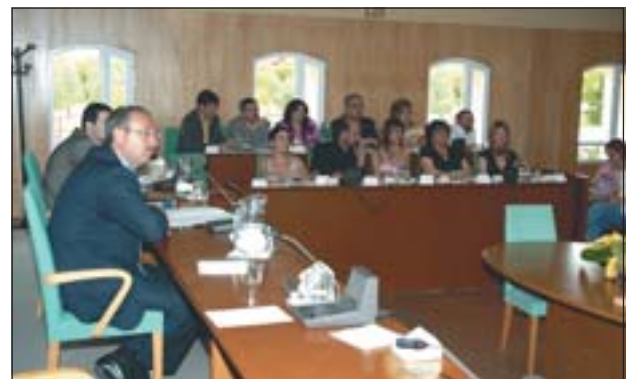
L'ALCALDE AMB ELS REGIDORS DE L'EQUIP DE GOVERN

El cap de llista del COP-CpR, Jacint Padró, va criticar "la taca en la legitimitat" dels electes, a causa de l'alta abstenció, que, per Padró, ha deixat "un mapa polític molt preocupant". Va manifestar que les urnes havien donat la victòria a les esquerres, referint-se als 9 regidors del PSC més els 5 del CpR, pel que va qualificar el pacte de PSC-CiU de "fraudat a l'expressat pel poble de Ripollet".