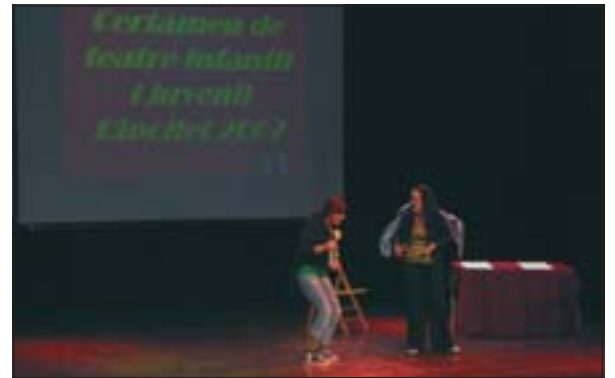
UN MOMENT DE LA CLOENDA DEL CERTAMEN DE TEATRE

Durant tot el mes de juny, 80 alumnes dels col·legis Sant Joan de la Creu, Enric Tatché, Gassó i Vidal, Josep Maria Ginesta i Anselm Clavé han participat al Certamen de Teatre Infantil i Juvenil. Les representacions van tenir lloc al Teatre Auditori de Ripollet i l'acte de cloenda es va realitzar el dia 13 a les 6 de la tarda, quan es va atorgar un diploma a tots els participants. S'han representat un total de 6 obres que han tractat temes històrics, fantàstics i d'humor.