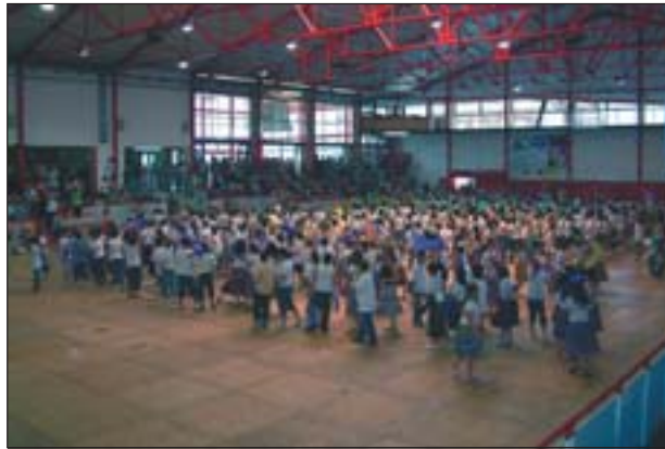
EL PAVELLÓ DE GOM A GOM AMB LA TROBADA DE DANSAIRES

Ripollet posa punt i final al curs escolar. El cap de setmana de l'1 i 2 de juny l'Escola Escursell va celebrar la festa de fi de curs, que va tenir un gran nombre de participants. Les activitats es van allargar fins les 3 de la matinada, amb focs d'artifici i ball.