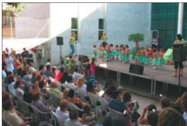
ELS MES PETITS ACOMIADEN L'ESCOLA AMB L'ESTIU AL CARRER

Els esplais també han començat les activitats. Aquest estiu més de 130 joves d'entre 3 i 16 anys participaran en les activitats de l'esplai La Gresca i més de 230 nens i nenes gaudiran de les activitats organitzades per l'esplai l'Estel. D'altra banda, el Patronat Municipal d'Esports també ha començat l'escola esportiva amb més de 320 joves inscrits. Els responsables de tots tres casals han valorat molt positivament el número de nens inscrits. Però les protagonistes d'aquest estiu seran, sense cap mena de dubte, les piscines del Poliesportiu Municipal.