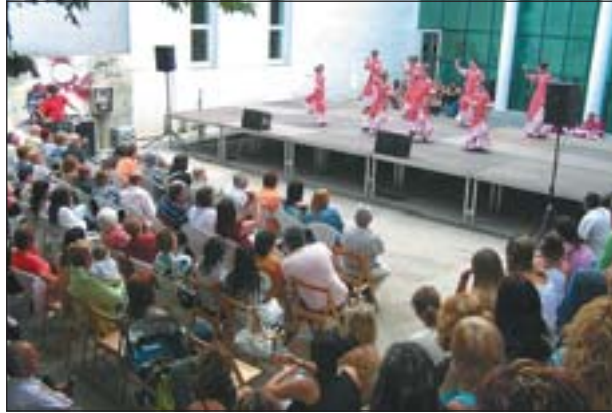
LA PENYA LA MACARENA PARTICIPA TAMBÉ A L'ESTIU AL CARRER

El circuit de concerts Sonajove, el segon Concurs de Monòlegs, la diada del Corpus, la Gibrelleta i la tradicional revetlla de Sant Joan són algunes de les principals activitats programades dins el cicle de l'Estiu al carrer 2007.