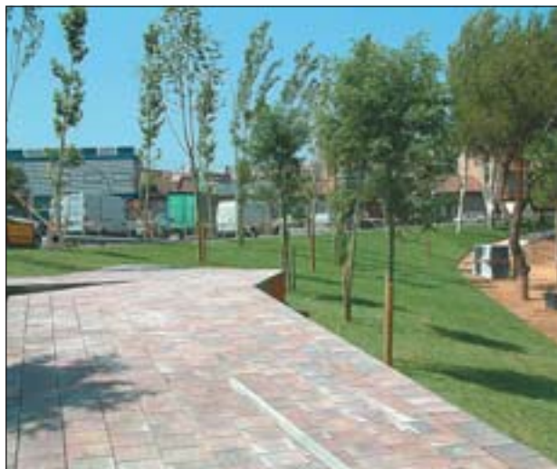
EL PARC MARIA REGORDOSA TAMBÉ ESTÀ FINALITZANT LES OBRES

L'Incasol està finalitzant la urbanització d'aquesta nova zona industrial de Ripollet, antigament propietat de l'exèrcit. En aquesta parcel·la ja s'ha fet una escola, la comissaria i també s'està fent el nou parc Carles Ferré, en record a l'alcalde. En una segona fase, una escola taller del PMO es podria encarregar d'enjardinar-lo.