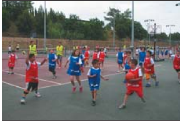
LA FESTA VA SUPOSAR LA CLOENDA DE L'ESPORT EXTRAESCOLAR

El passat 16 de juny va tenir lloc al Poliesportiu Municipal una jornada de portes obertes i la tradicional Festa de l'Esport, com a cloenda de la temporada esportiva, l'extraescolar i per obrir les piscines d'estiu, enguany ampliades.