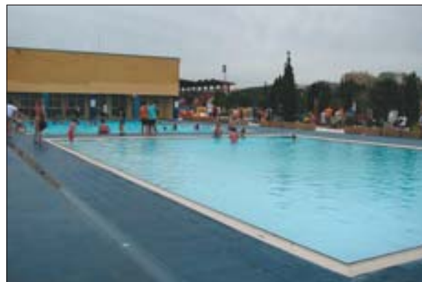
LES PISCINES NOVES, EL DIA DE LA FESTA DE L'ESPORT

En aquesta primera fase també s'ha acabat la construcció d'un gran vestíbul-consergeria de 600 m 2 , amb nous accessos adaptats i ascensor. A tot això cal sumar la recent col·locació la gespa al camp de futbol municipal. A principis de juliol està previst ultimar els darrers detalls de la zona de bar de la piscina exterior.