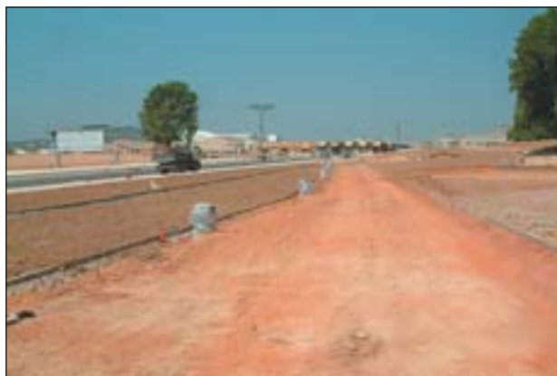
TERRENYS DEL FUTUR PARC CARLES FERRÉ

El passat més de juny es va aprovar el projecte executiu de la construcció de la segona llar d'infants municipal, per un import aproximat de 727.000 euros. La durada de les obres té una previsió de sis mesos i podrien començar a final d'any.