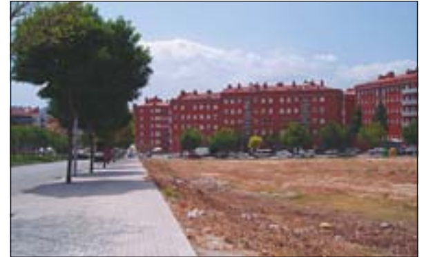
SOLAR ON ES CONSTRUIRAN ELS PISOS DE PROTECCIÓ OFICIAL

L'oficina de l'Institut Metropolità de Promoció de Sòl i Gestió Patrimonial de la Generalitat ha rebut un total de 993 sol·licituds pels 128 pisos de protecció oficial que es faran a la zona Pinetons. LIMPSOL publicarà en breu la llista provisional d'admesos al sorteig. Una vegada acabi el termini per presentar reclamacions, es donarà a conèixer la llista definitiva d'admesos que entraran al sorteig, que possiblement es farà aquest setembre.