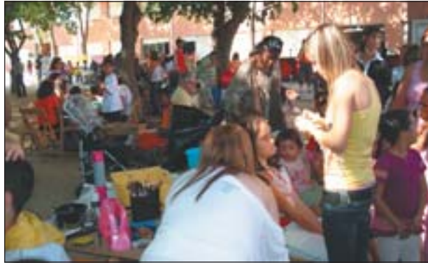
IMATGE DE LA FESTA DE FI DE CURS DEL CEIP ESCURSELL

Activitats esportives, tallers infantils, ball, xocolatades i gimcanes han servit per acomiadar el curs escolar. El pavelló Joan Creus va acollir també la Trobada de Dansaires, amb més de 600 alumnes participants de diverses poblacions.