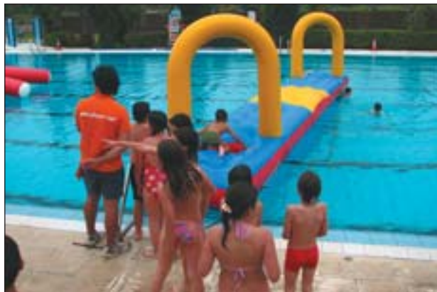
LES PISCINES MUNICIPALS, LES GRANS PROTAGONISTES DE L'ESTIU

A final del mes de juny, esplais, entitats i instal·lacions municipals han obert les portes a l'estiu. Petits i grans poden escollir entre diverses activitats per combatre la calor i l'avorriment fins que tornin a començar les classes al setembre.