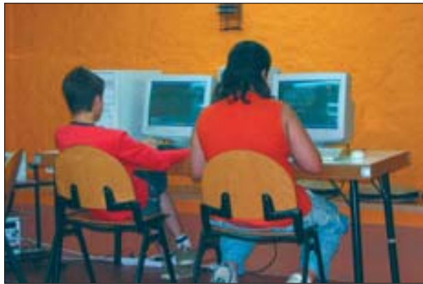
L'ESPAI LLIURE DEL KFTÍ ACULL JOVES DE 12 A 16 ANYS

Durant els mesos d'estiu, el Kftí obrirà entre les 6 i dos quarts de 9 del vespre, per a joves de 12 a 16 anys. En aquest espai s'estan realitzant tallers, cursos i jocs organitzats, amb pre-inscripció prèvia, pels usuaris habituals.