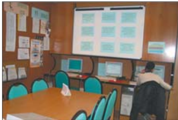
SALA DE FORMACIÓ INFORMÀTICA

L'objectiu principal d'aquest programa ocupacional ILO-SER 4, impartit a les dependències del Patronat Municipal d'Ocupació, amb suport de la Diputació de Barcelona, ha estat la inserció de persones aturades, especialment dones, joves i persones immigrants. Ha consistit en un itinerari de cinc mòduls,