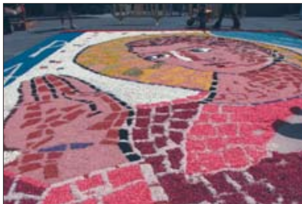
LES TRADICIONALS CATIFES DE FLORS, PROTAGONISTES DEL CORPUS

Fins ara, han comptat amb una gran participació dels ripolletencs els actes del Corpus 2007,