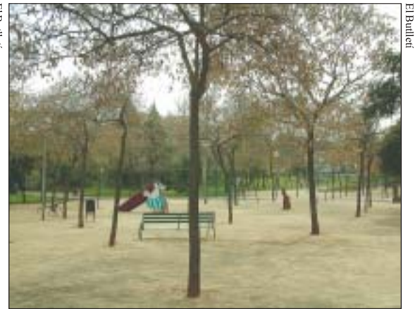
Imatges dels parcs abans de la seva remodelació.