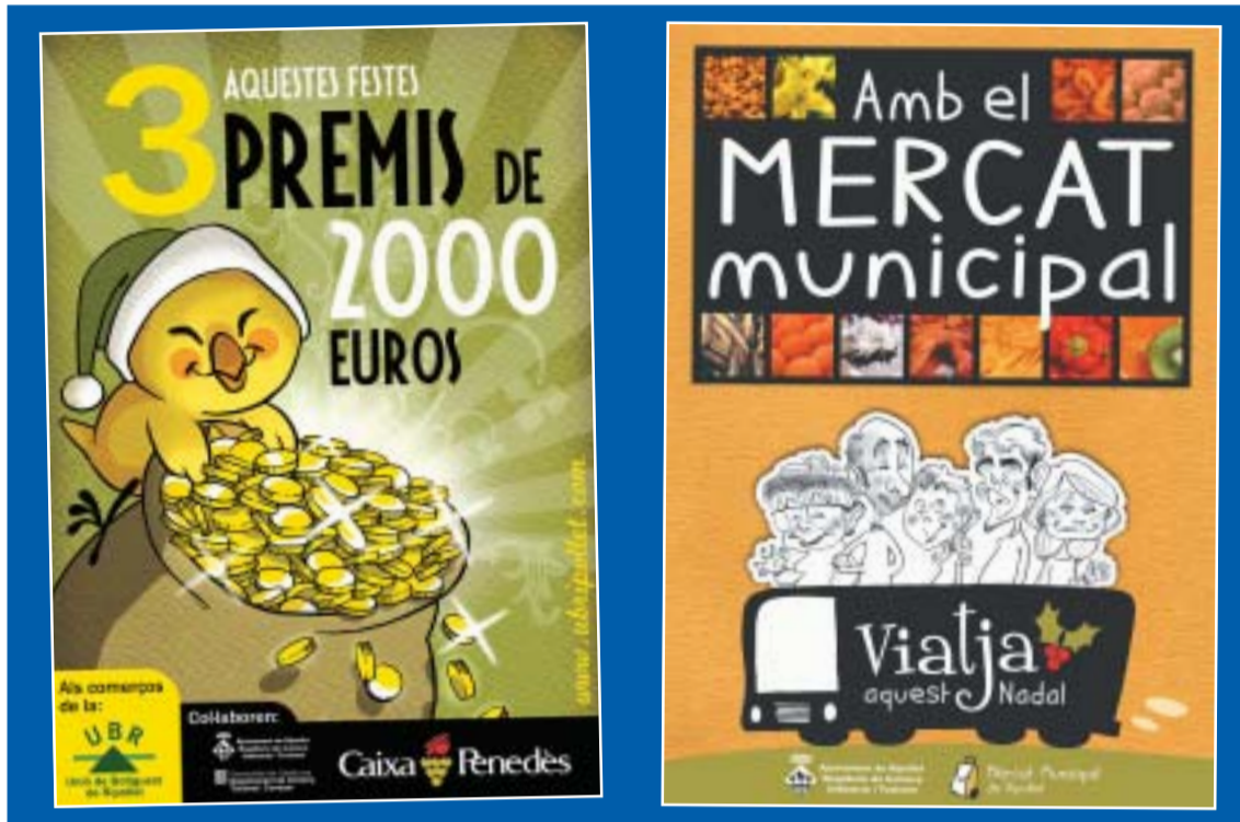
La Unió de Botiguers i el Mercat organitzen novament, amb el suport de l'Ajuntament, sortejos per premiar la fidelitat de la seva clientela.

Es va presentar Tot a un pas , nou lema per a la promoció del comerç local. La campanya està organitzada per la UBR i l'Ajuntament de Ripollet.