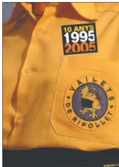
A dalt, portada de la publicació. A la dreta, actuació dels Vailets durant la seva 10a diada

Aquelles persones que estiguin interessades en aconseguir un dels 1000 exemplars publicats o vulguin formar part dels Vailets de Ripollet, ho poden fer els divendres, de 20 a 21 hores, al Centre Cultural.