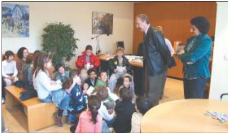
Alumnes del col·legi El Roser a la primera visita del curs.

D'altra banda, el Ple Juvenil s'adreça a alumnes de 4rt d'ESO. Aquesta activitat preten donar a conèixer els mecanismes de presa de decisions al consistori i compta amb una visita a l'aula per part de l'Alcalde o un regidor i la realització d'un simulacre de Ple. Es faran un total de 6 sessions, amb un total de 250 alumnes.