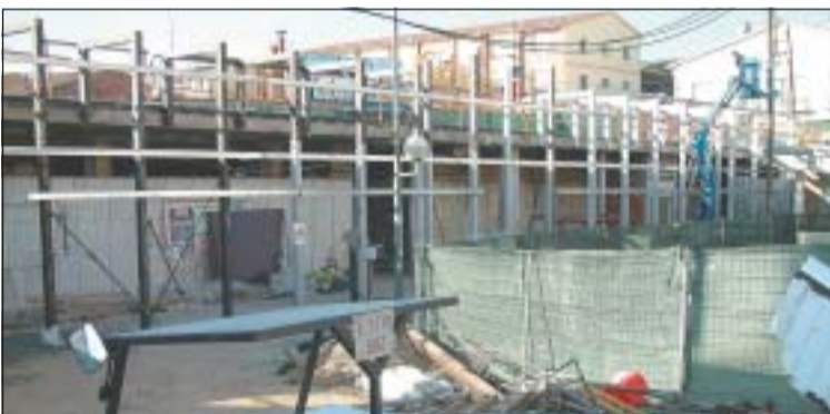
Esquelet sobre el que es col·locarà la nova façana de vidre del Mercat.

Aquest mes de desembre està previst obrir a la circulació el darrer tram de la rambla de Sant Jordi. Amb aquesta fase, que ha tingut un cost d'uns 600.000 euros, acaba l'actuació integral realitzada a una de les principals vies de la ciutat. Ha consistit en la renovació i ampliació de les voreres, la instal·lació de nou paviment, mobiliari urbà i il·luminació. A més, s'ha intervingut en l'eliminació de barreres urbanes i s'ha adequat en seguretat vial, amb la millora de senyalització i passos de ressalt. De la inversió també cal destacar el soterrament de les línies elèctriques, que fins ara penjaven de