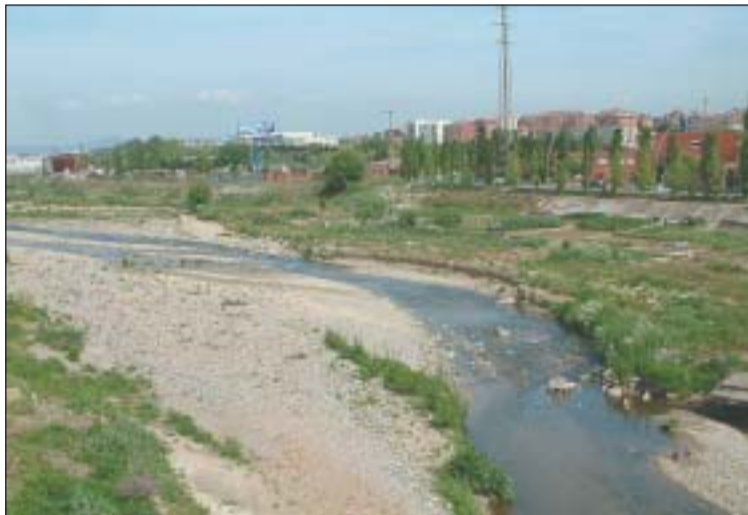
Els municipis riberencs del Ripoll i la Generalitat definiran conjuntament la recuperació i aprofitament del marge del curs fluvial.

En aquest sentit, també es va aprovar l'atorgament d'una subvenció de 9.000 euros destinats a diversos estudis sobre el Mercat Municipal en el marc de la Xarxa Barcelona Municipis de Qualitat 2004-2007. Un altre