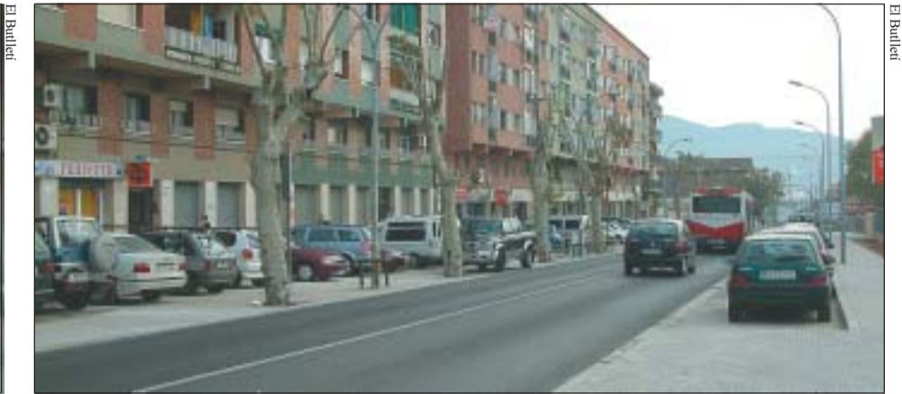
A dalt, vista general de la rambla, on destaquen els seus moderns fanals i els passos de vianants elevats. A la foto de la dreta, la nova fisonomia del carrer de Sant Jaume.