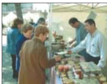
Una cita amb l'educació mediambiental i l'afició a les plaques de cava.