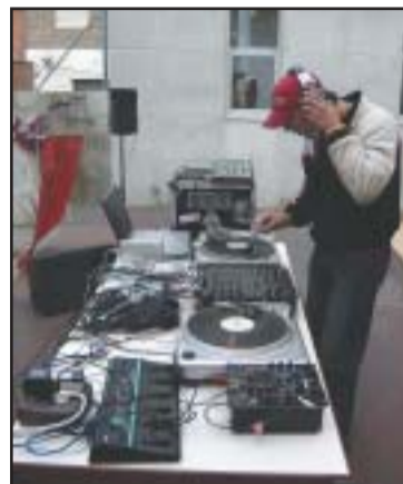
Uns dels disjòqueis, punxant a la festa d'aniversari d'el Kftí

El Kftí del Casal de Joves de Ripollet va celebrar el passat divendres 19 d'abril el seu aniversari, amb diverses activitats, com ara jocs de rol, música, video i focs, amb la col·laboració de les entitats juvenils locals. Amb aquest acte es va encetar la programació estable, anomenada 'Kftí de nit', que tindrà lloc cada di-