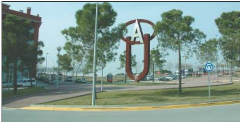
Al'esquerra, fotografia d'un tram descobert de la línia Mollet-El Papiol, amb el Baricentro al fons. A la dreta, la plaça d'Avillé, amb el parc dels Pinetons al darrere.

Els diferents partits amb representació a l'Ajuntament han acordat demanar, de manera unitària, a la Generalitat, importants millores en el servei de transport públic a Ripollet, entre les quals cal destacar la petició de l'arribada a Ripollet del tren i el metro lleuger, que estarien connectats en una estació central, a peu del parc dels Pinetons, a prop de la plaça d'Avillé. Aquesta iniciativa forma part d'un extens paquet de propostes al Pla d'infraestructures de transport de Catalunya i ha estat consensuat amb les aportacions de tots els grups. El document també recull la reivindicació d'una millora substancial del transport en autobús amb els municipis de l'entorn, la Universitat i especialment del barri de Can Tiana. Per la seva part, les associacions veïnals i la Unió de Botiguers de Ripollet també han presentat propostes en aquesta línia, fent seves les promogudes porta a porta pel ciutadà, gran amant del ferrocarril, Salvador Gorina.