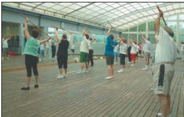
A l'esquerra, gent gran practicant gimnàstica de manteniment a la sala polivalent. A la dreta, obres del nou bar i la sala tècnica de serveis.

Va aprovar la realització de set tallers de prevenció de la violència de gènere, amb un pressupost de 1.680 euros. Aquesta iniciativa es portarà a terme a l'IES Palau Ausit, a càrrec de l'Associació contra la Violència vers les Dones 'El Safareig'. En aquesta sessió també es va donar llum verda al conveni marc entre l'Ajuntament i el Consorci per a la Normalització Lingüística, que té per objecte la realització de cursos de català per a població immigrant. A més, es va autoritzar una despesa de 12.000 euros per a l'organització de la X Mostra Gastronòmica d'abril. En el pla urbanístic, la JGL va adjudicar la direcció d'obres de la segona fase del projecte d'adequació del Mercat, la plaça de Pere Quart i entorn, per un import de 66.000 euros, i la redacció, direcció d'obres i con-