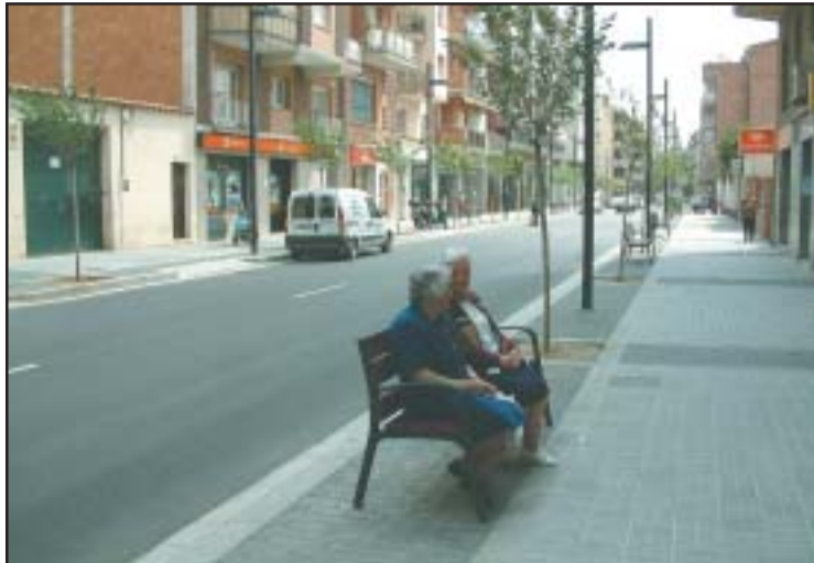
En breu s'emprenrà la remodelació del darrer tram de la rambla de Sant Jordi.