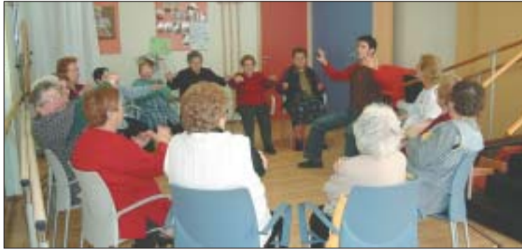
Avis del Centre de Dia Can Vargas, durant una sessió d'estimulació psicomotriu.

L'Ajuntament va aprovar en Ple, el passat 30 de març, el concurs per a la construcció i gestió del futur complex de serveis per a la gent gran. El projecte preveu que el centre tindrà 120 places de residència i les 32 de centre de dia, ja concertades amb la Conselleria de Benestar i Família de la Generalitat. A més, va més enllà de l'anunciat inicialment, ja que també s'ha tancat un altre acord, en aquest cas amb la Conselleria de Salut, perquè també compti amb 50 llits per a llarga estada i de 15 a 20 places d'hospital de dia.