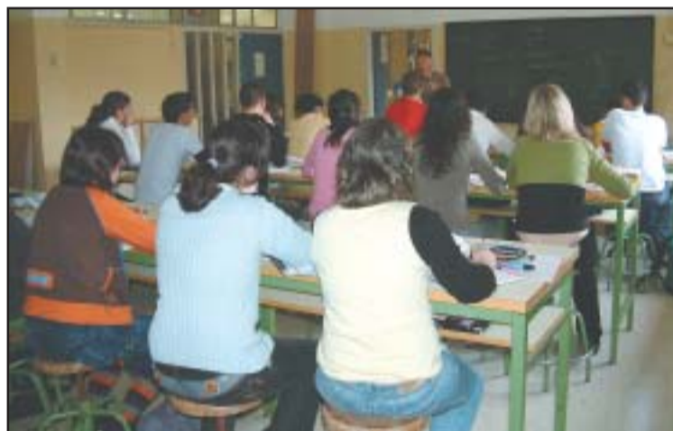
Una de les aules-laboratori que seran remodelades per a acollir els nous estudis.

En aquesta ubicació s'impartiran les classes teòriques i pràctiques dels cicles, que comptaran amb material específic per a fer pràctiques, com ara una cuina, un llit articulad, etc. En el futur, segons la directora de l'institut, s'espera disposar d'un nou edifici annex, on es realitzarien els cursos de cicles formatius. L'IES Lluís Companys, amb més de 20 anys d'història, té actualment 480 alumnes, entre primària i secundària. ●