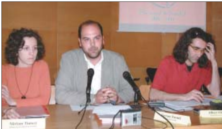
Acte de presentació de L'Anàlisi de la realitat juvenil a Ripollet 1996-2001