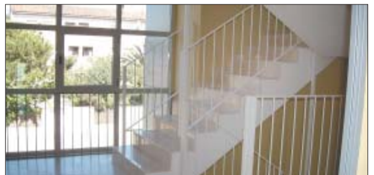
La finca està situada al carrer de Federico García Lorca