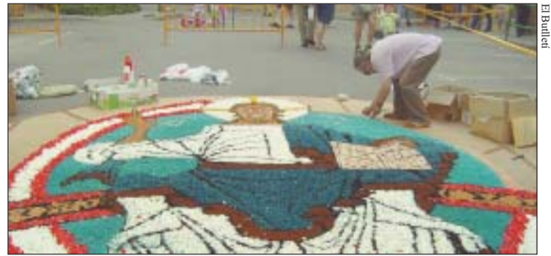
Catifa floral del Corpus 2004 a la plaça Clos

La Federació s'ha constituït amb l'objectiu de preservar, difondre i mantenir aquest art popular, facilitant l'intercanvi d'experiències entre els catifaires i els seus pobles. L'entitat es va presentar en un acte so-