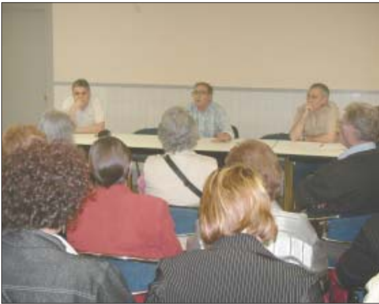
L'assemblea veïnal es va celebrar al Centre Cívic del Pont Vell