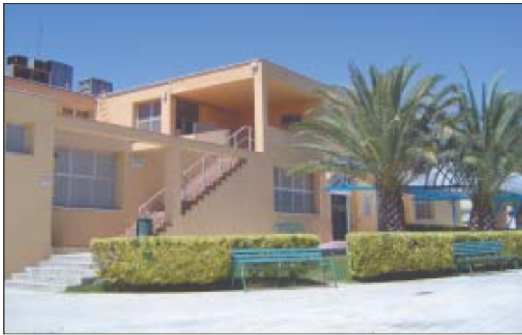
S'instal·larà una nova climatització al poliesportiu municipal

Quant a inversions, cal destacar l'acord per a la reforma interior del Centre Cívic de Can Calvet, que tindrà un cost d'uns 24.500 euros. A més, es va donar conformitat al plec de condicions per al subministrament de noves paperes, per un import total màxim de 20.000 euros.