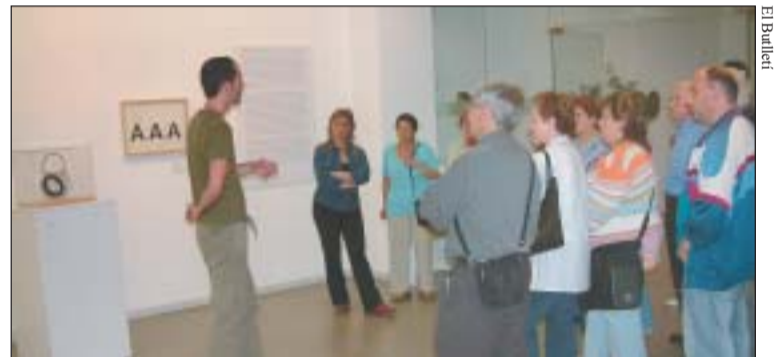
Un grup d'alumnes de l'Escola d'Adults en una visita guiada

El Patronat de Cultura i Joventut de l'Ajuntament de Ripollet ha valorat d'altament positiva l'acollida de la ciutadania i, especialment, del món educatiu de l'exposició 'Brossa, poeta de la imatge', promoguda per la Diputació de Barcelona. Durant el mes de maig es van organitzar 53 visites guiades, 45 d'elles d'escolars de 7 col·legis, amb una assistència de 1.200 persones, a més del miler de visitants que hi van acudir pel seu compte.