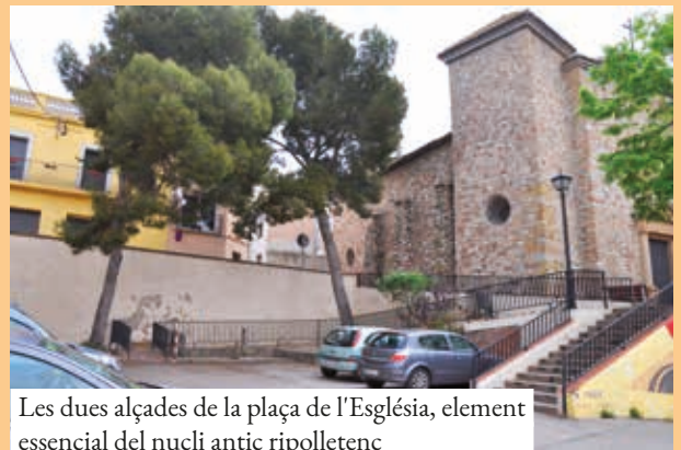
Les dues alçades de la plaça de l'Església, element essencial del nucli antic ripolletenc

Al número d'abril de la revista municipal lallana vam repassar les diferents etapes de creixement del nucli antic de Ripollet, analitzades a l'estudi de l'espai públic històric que servirà per a fer-hi intervencions urbanístiques en un ambiciós projecte de remodelació que vol ser respectuós amb els seus elements més característics. Un cop vistes les etapes, que expliquen per què Ripollet és avui com és, cal entrar a analitzar les característiques urbanístiques que trobem a aquests carrers i places.