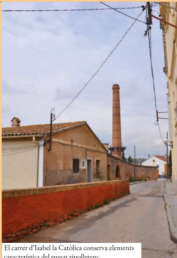
El carrer d'Isabel la Catòlica conserva elements característics del passat ripolletenc

ara ja carrers tots ells, que han estructurat un centre històric i n'han definit la seva morfologia fins avui. Alguns, amb referència històrica, com el carrer de la Salut –corresponent a l'antic camí que unia l'església de Sant Esteve amb el santuari de la Salut, a Sabadell–, encara conserven l'origen de la toponímia a algunes plaques dels carrers. Tots els carrers principals passaven per l'església, però l'estudi veu com no es toquen, no arriben a formar els habituals encreuaments a quatre.