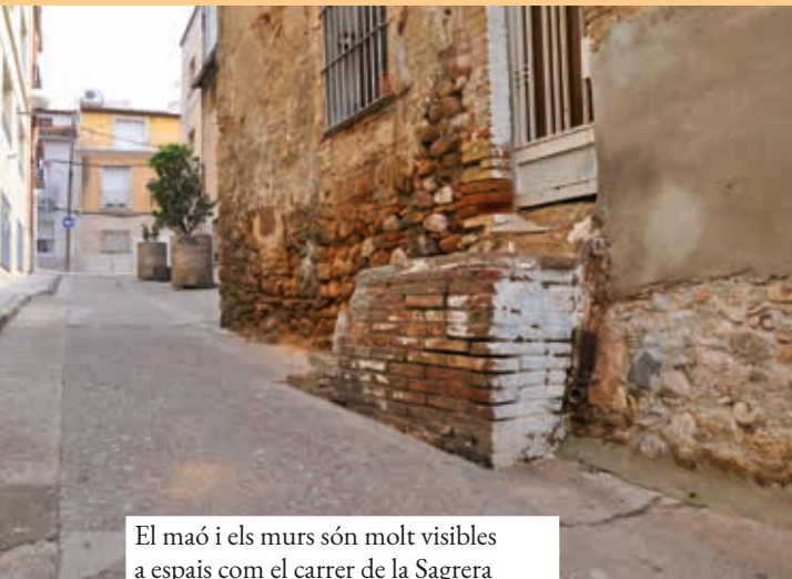
El maó i els murs són molt visibles a espais com el carrer de la Sagrera