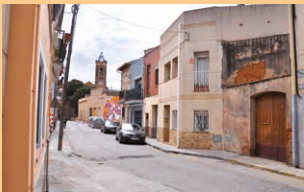
Al carrer de la Salut s'aprecia l'alçada uniforme dels edificis