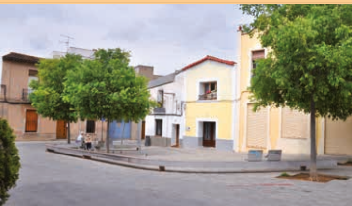
La plaça d'en Clos, un dels epicentres del centre històric