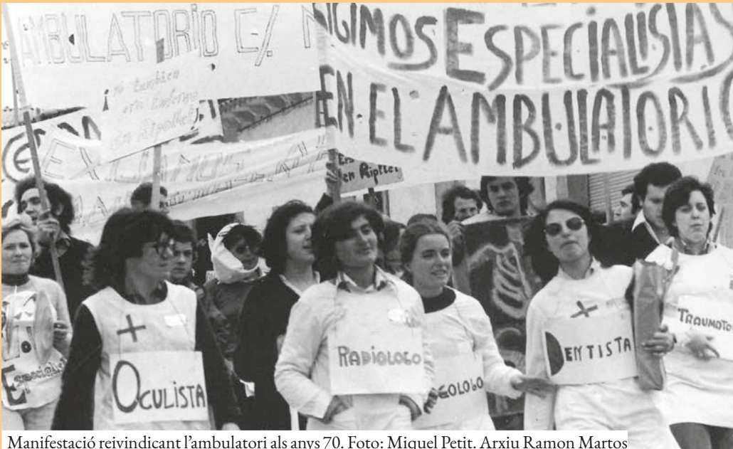
Manifestació reivindicant l'ambulatori als anys 70.

tenim constància d'activitat de cap nova associació fins al desembre de 1978. Aquest fet ens mostra que la Coordinadora estava formada per associacions fantasmes, ja que ni estaven legalitzades —ho seran el novembre de