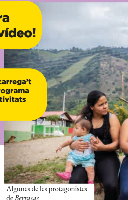
Algunes de les protagonistes de Berracas