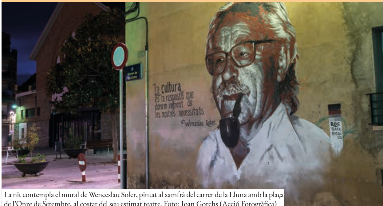
La nit contempla el mural de Wenceslau Soler, pintat al xamfrà del carrer de la Lluna amb la plaça de l'Onze de Setembre, al costat del seu estimat teatre.

Una quarentena de persones i quatre entitats han promogut un mural en record a Wenceslau Soler, obra de l'artista Roc Blackblock. La creació és un homenatge a la gran influència en la cultura local de l'activista cultural i president d'honor de l'Associació d'Espectadors del Teatre del Mercat Vell, mort el passat mes de març als 86 anys.