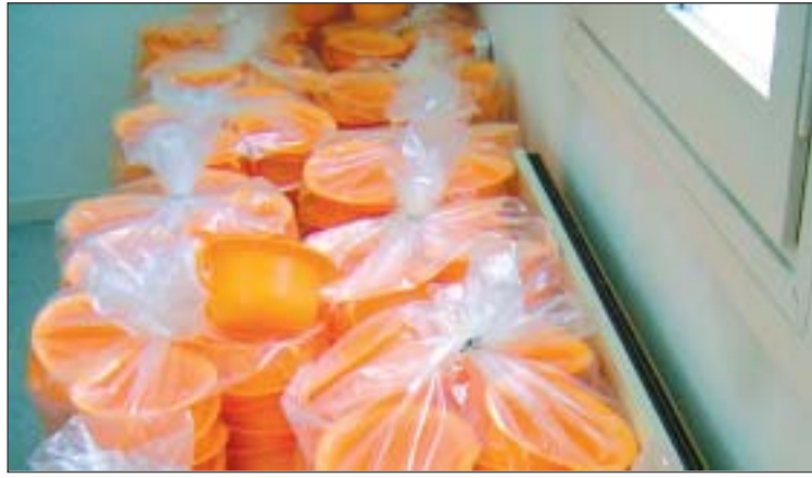
Les gibrelletes, preparades per ser utilitzades

Canviat el look, fes-te extensions, un massatge, prova amb un tatuatge. A preus rebentats. De 18 a 02 h.