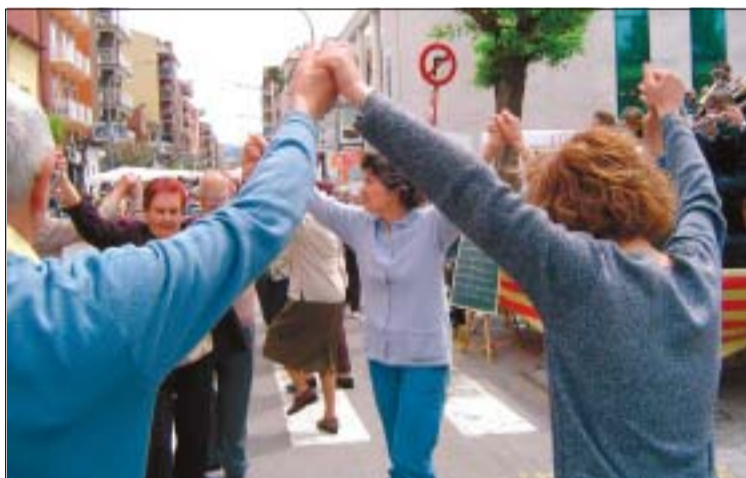
Moltes entitats locals, com Ripollet Sardanista, participen al programa d'actes

El programa d'actes també ha comptat amb una visita als nous locals d'assaig, l'assistència a la concentració de Harleys que es va realitzar a Ripollet i un concert al Teatre Auditori. Diumenge al migdia, com ja és tradicional, es va oferir un dinar de germanor a càrrec del Setrill. El programa d'actes d'aquest intercanvi ha estat elaborat pel Comitè d'Agermanament i la regidoria de Relacions Institucionals.