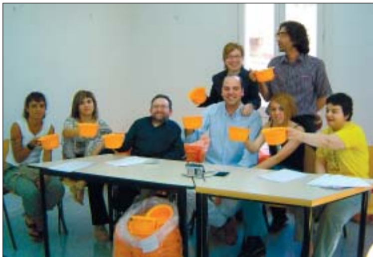
L'organització brindant amb el got-gibrelleta

Ripollet celebrarà el proper 19 de juny una macrofesta jove anomenada La Gibrelleta, organitzada per l'Ajuntament de Ripollet, amb el suport de comerços i de totes les entitats juvenils. A partir de les 5 de la tarda i fins a la matinada el jove podrà, entre d'altres, llançar-se des d'una grua de 40 metres, jugar a videojocs en pantalla de cine, canviar-se el look o ballar a sessions rock i discjòqueis. Tot això, sense oblidar l'associacionisme, la informació i la cultura de la pau. Els símbols de la macro són el got-gibrelleta o un original concurs de llançament de tasses de wàter. Els nascuts el 1986 tindran un passí preferent.