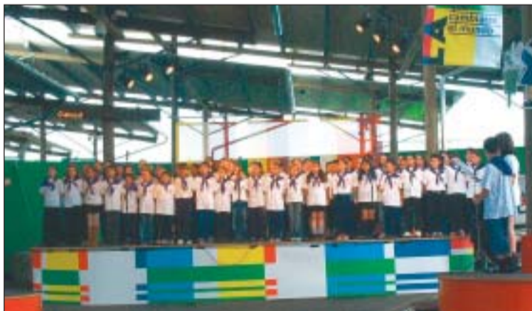
69 nens del CEIP Tatché van cantar al recinte del Fòrum el passat 13 de maig

Uns 150 escolars de 5è i 6è de primària dels centres educatius de Ripollet i també d'alguns de Montcada realitzaran una cantata, el proper 15 de juny, al Pavelló d'Esports. Enguany, aquesta activitat, que s'organitza bianualment per una comissió intermunicipal formada per professors de música, constarà d'11 cançons i 12 textos relatius a l'obra El petit príncep , d'Antoine de Saint-Exupéry. Aquesta obra ja va ser interpretada l'any 2.000 per escolars de Ripollet i Montcada, amb un gran èxit de públic.