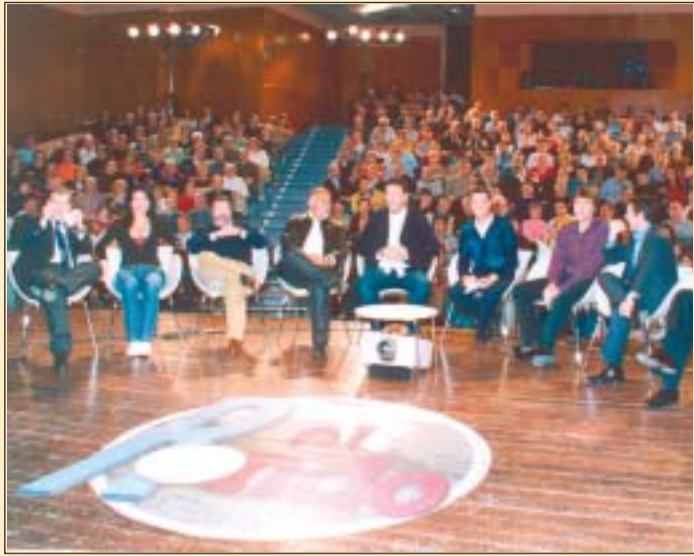
Penya Barcelonista de Ripollet