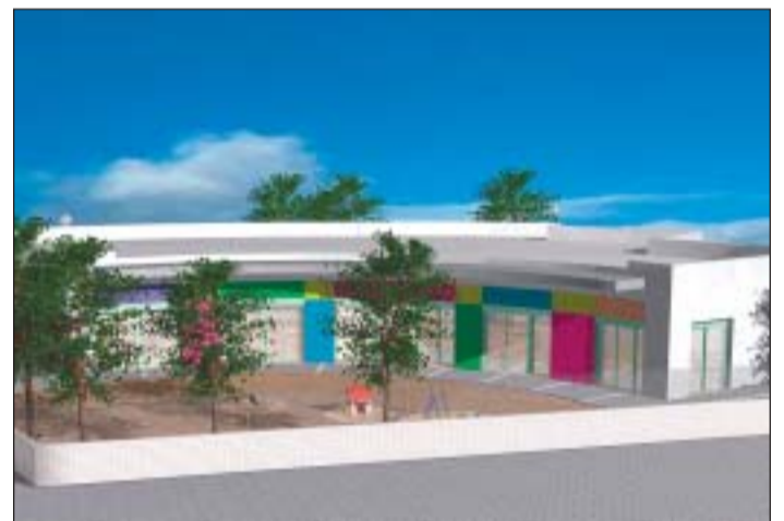
Maqueta virtual de l'escola bressol municipal, que obrirà el gener de l'any vinent

Ja s'han iniciat les obres dels dos nous equipaments educatius de Ripollet, llargament reivindicats, l'escola Teresa Vila i Arrufat i les de la primera escola bressol municipal. Una vegada acabada l'estructura i el mur perimetral de la setena escola es condicionaran els accessos i s'habilitarà la zona de jocs, perquè al setembre ja comencin les classes uns 125 nens i nenes de P3 a P5. Fruit de les reivindicacions d'una representació dels pares dels futurs alumnes i de l'Ajuntament, s'han introduït algunes millores en el projecte. La resta del complex educatiu, amb l'edifici dels grans, la biblioteca, el menjador, el gimnàs i les pistes esportives estaran a punt per al curs següent. Simultàniament, els operaris també treballen en la cimentació de la llar d'infants, situada al costat del Molí d'en Rata, que obrirà les portes al gener del 2005.