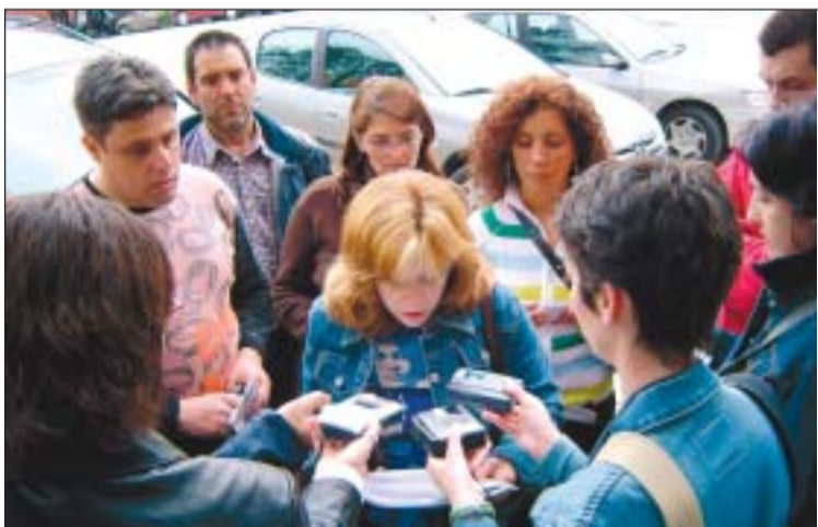
Un grup de l'AMPA del Teresa Vila va expressar la seva preocupació per la seguretat viària a l'entorn de la nova escola

valent, cuina, oficines, pati i zona de jocs específica per als més petits. L'edifici, d'una planta, de 350 metres quadrats, ampliable a dues, tindrà l'entrada situada al carrer de Magallanes, que és menys transitat.