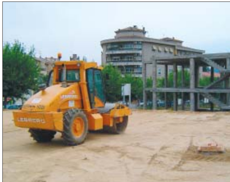
Els operaris treballant en l'estructura i el mur del Teresa Vila i la cimentació de l'escola bressol