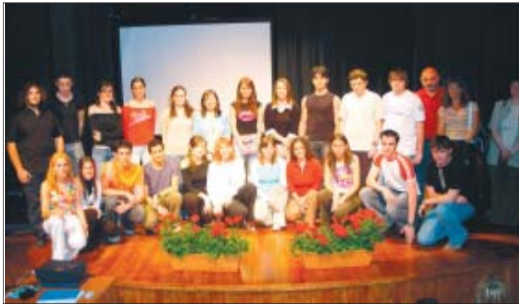
El Centre de Recursos Pedagògics va premiar els dos millors treballs de cada centre

Els guanyadors van rebre un diploma i un tiquet per a la compra de material escolar. L'acte de lliurament dels premis, a l'Auditori de Montcada, va comptar amb la presència de les regidores d'Educació dels tres muni-