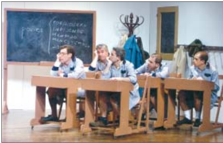
El grup local Amics del Teatre es va endur tres premis

La companyia de Granollers Quatre per Quatre va guanyar el concurs de teatre amateur d'enguany, convocat pel Patronat de Cultura i Joventut de