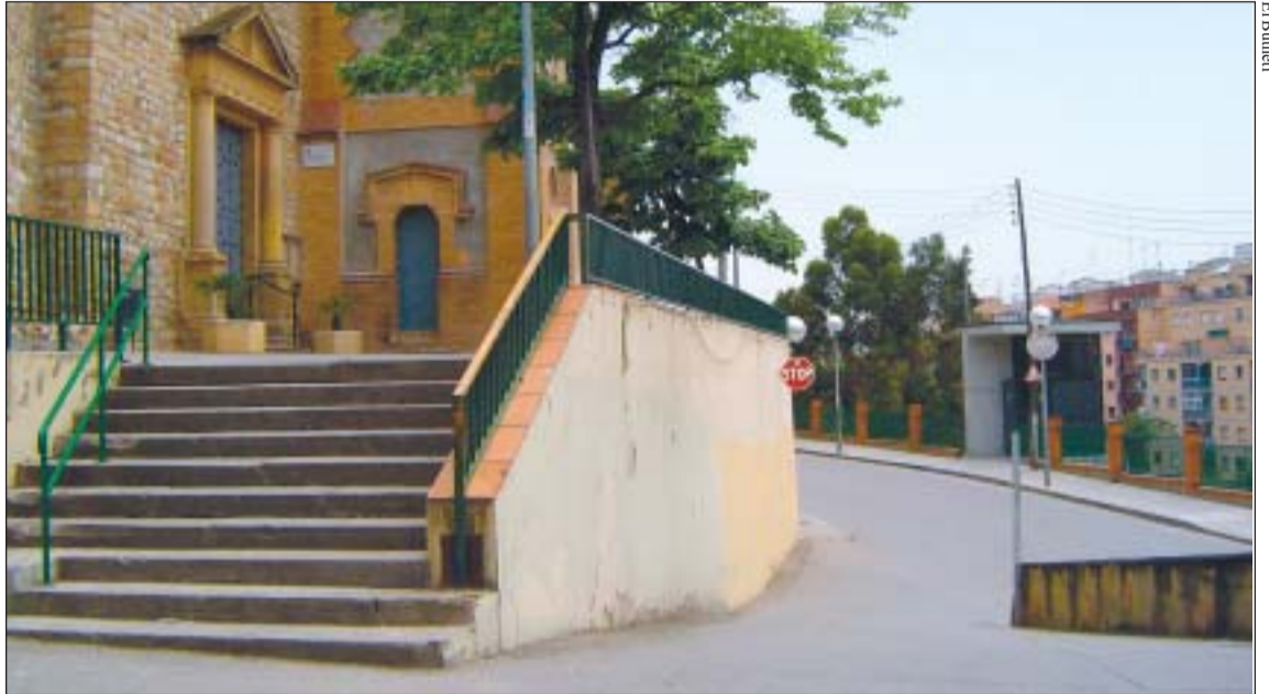
S'adequarà la baixada de l'església per fer-la més accessible fins l'ascensor

En aquesta altra Junta de Govern Local de l'Ajuntament es va aprovar la realització de diverses obres, com ara l'eliminació de barreres arquitectòniques al voltant de l'església de Ripollet, amb un cost de 50.000 euros, de manera que sigui més fàcil l'accés des de l'ascensor del carrer de Padró a la parròquia. En roda de premsa, el se-