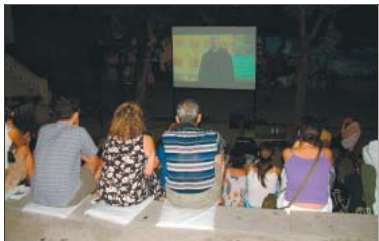
El Cinema de barri és una de les activitats destacades de l'Estiu al carrer

Altres activitats destacades del programa de l'Estiu al carrer són el concert Cortocircuit, que