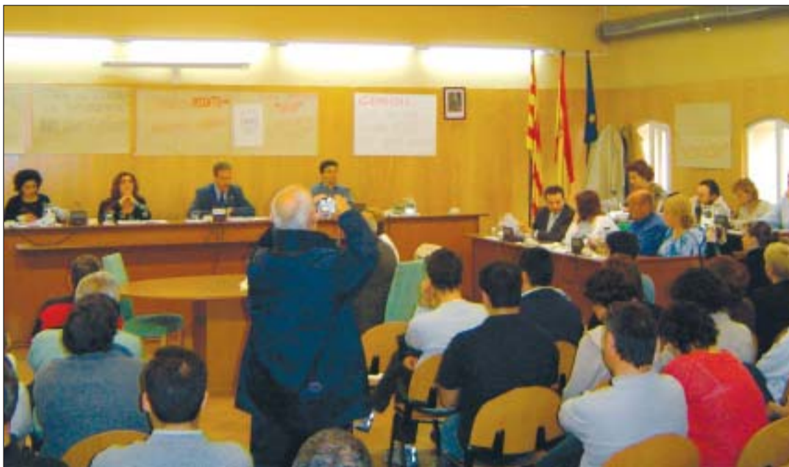
El Ple d'abril va comptar amb l'assistència de molts treballadors municipals