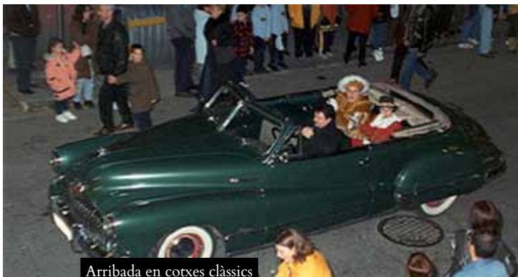
Arribada en cotxes clàssics