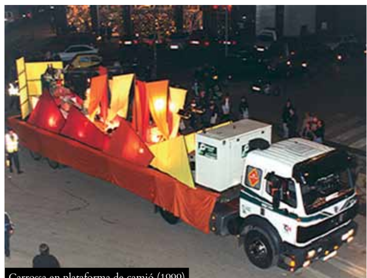
Carrossa en plataforma de camió (1999)