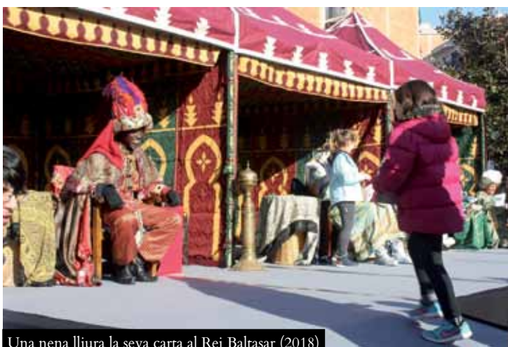
Una nena lliura la seva carta al Rei Baltasar (2018)