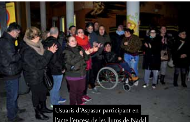
Usuaris d'Aspasur participant en l'acte l'encesa de les llums de Nadal

Després de l'èxit de l'any passat, el Trenet del Nadal arrencarà novament aquest dilluns 27 de desembre i circularà fins al 4 de gener per Ripollet. L'activitat forma part del programa Més Nadal, + Ciutat , que també inclou la campanya d'intercanvi de joguines, Donem Joc ; un servei d'embolicament gratuït de regals, projeccions al Mercat, el 3r Concurs d'aparadors i Tallers de Nadal per a joves i infants. A més, també s'han celebrat l'acte d'encesa de la il·luminació de Nadal, una Jornada de consum responsable i activitats a la Biblioteca, entre altres (vegeu l'Agenda).