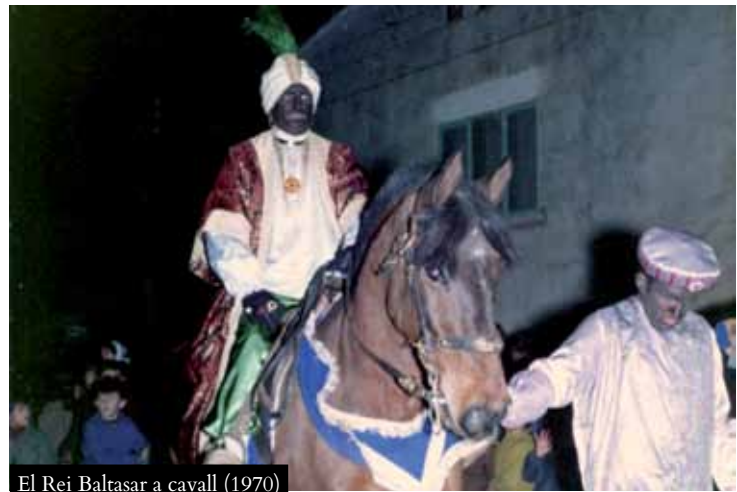
El Rei Baltasar a cavall (1970)