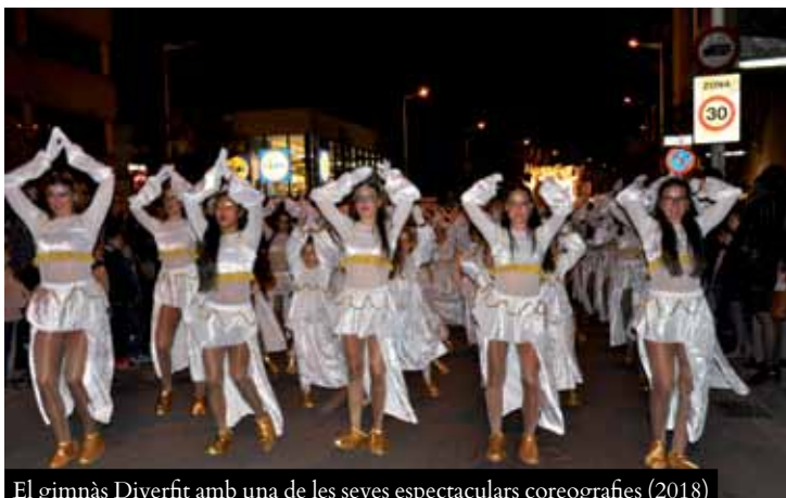
El gimnàs Diverfit amb una de les seves espectaculars coreografies (2018)

Després d'anys de recollides de cartes a càrrec dels patges reials, l'any 2000 es va decidir realitzar un acte més solemne, on els nens i nenes poguessin lliurar les cartes directament als Reis, acompanyats dels Gegant de Ripollet. Es va començar amb un acte al centre i actualment en són dues: a la plaça de Pere Quart, el 30 de desembre i a la ctra. de l'Estació, el 2 de gener. L'any passat van portar la seva carta, en total, més de 1.200 infants.