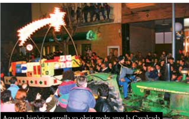
Aquesta històrica estrella va obrir molts anys la Cavalcada