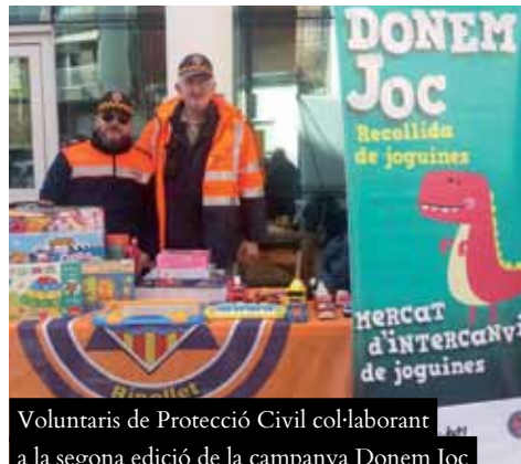
Voluntaris de Protecció Civil col·laborant a la segona edició de la campanya Donem Joc