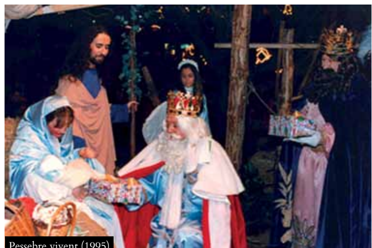
Pessebre vivent (1995)