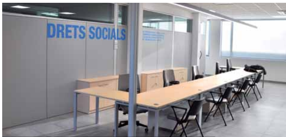
Les noves oficines de Drets Socials es van obrir al públic el 17 de desembre

Aquesta tardor, la Brigada de jardineria municipal ha iniciat la campanya de podes d'arbrat viari, que es preveu allargar fins a finals del mes de febrer. La campanya s'està concentrant només en els arbres que realment ho necessiten, ja que la Regidoria de Medi Ambient i Parcs i Jardins de Ripollet aposta per fer només les podes que siguin estrictament necessàries per al correcte desenvolupament i salut de les plantes. Mantenir la biomassa correcta és important també per a la nostra salut. Els arbres contribueixen a regular la temperatura de l'ambient i dels habitatges, ajuden a retenir l'aigua de la pluja, afavoreixen la biodiversitat, redueixen el soroll i retenen la pols evitant que entri a les cases, a més de proporcionar oxigen i netejar l'aire de les emissions atmosfèriques de CO 2 dels vehicles i xemeneies, entre altres.