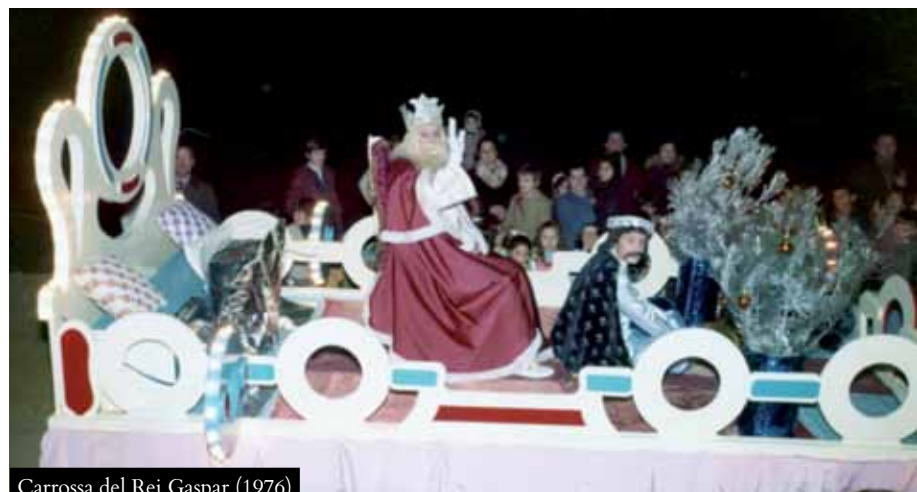
Carrossa del Rei Gaspar (1976)