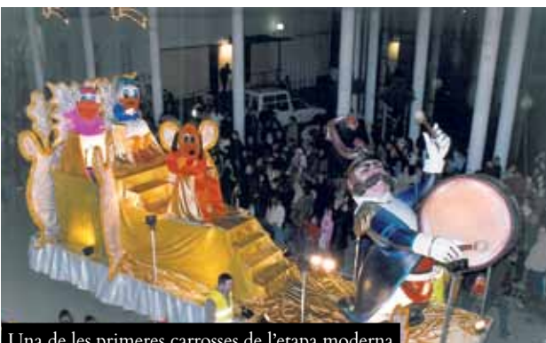
Una de les primeres carrosses de l'etapa moderna