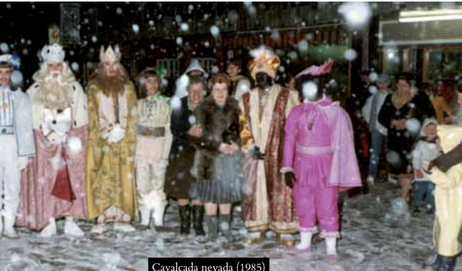
Cavalcada nevada (1985)