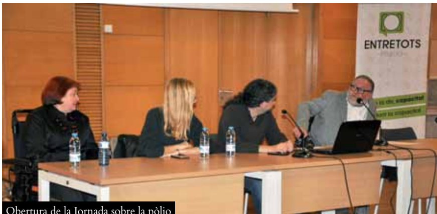
Obertura de la Jornada sobre la pòlio