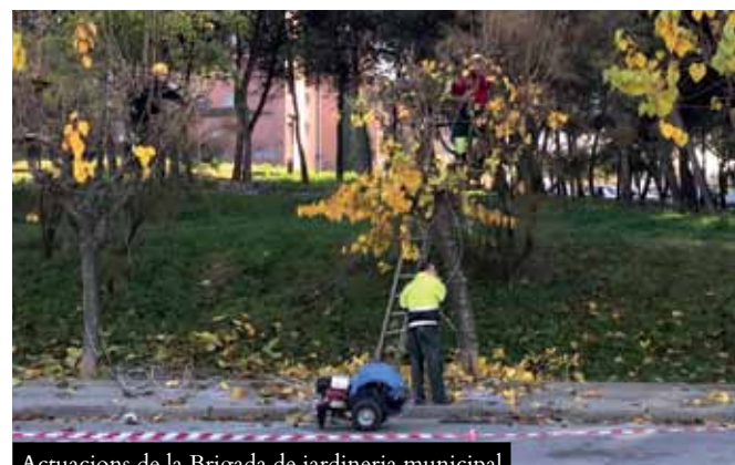
Actuacions de la Brigada de jardineria municipal en els arbres de la rambla de Sant Esteve

Els darrers dies, l'Ajuntament de Ripollet ha adreçat prop de 350 cartes a empreses locals amb l'objectiu que el teixit empresarial esdevingui una peça clau en la millora de polítiques d'ocupació en l'àmbit LGTBI. Concretament, s'han centrat en el foment de l'ocupació per a les persones trans, un col·lectiu amb prop d'un 75% de desocupació. Aquesta és una de les línies de treball marcades al Pla Municipal LGTBI i uns dels compromisos de l'Ajuntament de Ripollet per a la igualtat d'oportunitats.