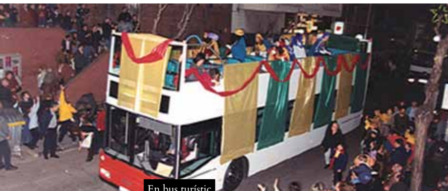
En bus turístic