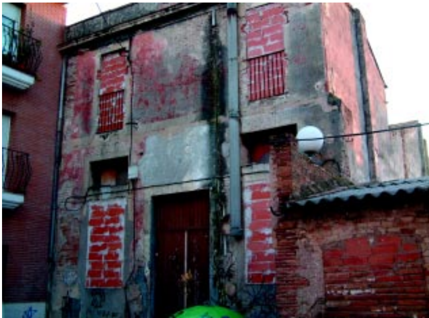
Estat actual de l'edifici

De moment, s'està negociant amb els actuals propietaris per aconseguir que l'edifici sigui propietat de l'Ajuntament. Quan es tingui la propietat es realitzarà el projecte museístic -adaptant el projecte que ja va realitzar la Diputació de Barcelona- i, posteriorment, el de rehabilitació i reforma de l'espai.