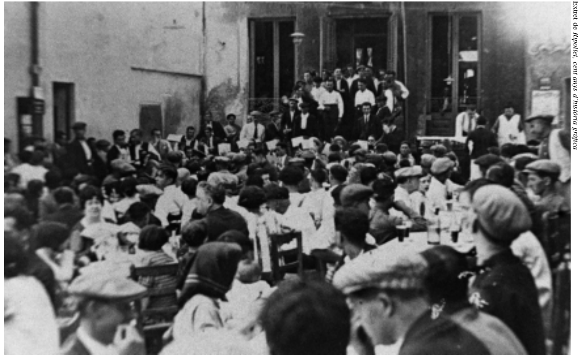
Festa Major a l'antic Casino durant els anys 30

El que més recorden els veïns que van conèixer el Cafè de Dalt és la sala de ball. Era un espai ample, amb el terra de fusta, que obria els diumenges de 6 de la tarda a 9 del vespre. Els veïns recorden el Cafè de Dalt com