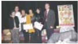
La Unió de Botiguers va regalar tres sous de 200 euros durant tot l'any 2004

Molts ciutadans i ciutadanes de Ripollet també han rebut aquest Nadal regals dels comerços lo-