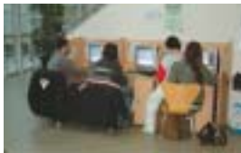
Estres nous punts poden ser utilitzats per totes les persones majors de 18 anys

Amb la posada en marxa, el passat 12 de gener, de tres nous punts d'accés públic a Internet al Centre Cultural, Ripollet ja compta amb 16 estacions gratuïtes. Els tres ordinadors, instal·lats al vestíbul del Centre Cultural, se sumen als sis del Punt d'Informació Juvenil del Casal de Joves i als set que hi ha a la Biblioteca, dels quals sis són per a adults i un altre per a infants. A més, properament es posaran en marxa unes altres tres estacions a la Biblioteca i un nou telecentre al Patronat Municipal d'Esports, que comptarà amb dos punts d'accés més. Les tres noves estacions podran ser utilitzades per tots els majors de 18 anys, durant un màxim de 30 minuts seguits. Els horaris del servei seran de dilluns a divendres de 10 a 12.30 i de 16 a 21.30 hores.