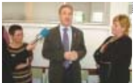
El nou menjador es va inaugurar el passat 9 de gener, amb una jornada de portes obertes

El passat 9 de gener va ser el darrer dia de la cinquantena d'alumnes del CEIP Gassó i Vidal que es queden a dinar a l'escola van haver d'anar al Tatché per gaudir d'aquest servei. Amb la inauguració del nou menjador del centre, ara ja totes les escoles públiques de Ripolllet disposen de menjador propi. Durant l'acte d'inauguració, al qual va assistir personal docent d'altres escoles, diversos regidors de l'Ajuntament i l'arquitecte municipal, l'alcalde, Juan Parralajo, destacà "l'aposta important" que ha suposat aquest projecte. Parralajo agrai a l'escola Tatché la seva col·laboració i destacà el fet que el projecte s'hagi anat millorant a mesura que s'anava executant. Així, el projecte inicial, adjudicat per 119.219 euros, s'ha vist modificat en introduir actuacions relacionades amb la ubicació de les calderes, el ca-