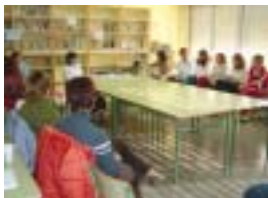
Sesión de formación de padres y madres en el CEIP Enric Tàrrer

En cuanto a los datos de la encuesta realizada durante el curso 2002-2003 (ver cuadro de resultados), se encuentran algunas diferencias significativas respecto a los del curso anterior. Por ejemplo, el número de jóvenes que se considera suficientemente informado ha aumentado un 18%, siendo el colegio el principal lugar donde los jóvenes obtienen esta información, por encima de la calle, que había sido la opción mayoritaria en el curso anterior. Además, ha disminuido en un 30% el número de jóvenes que dice haber fumado alguna vez y en un 23% los que dicen haber consumido bebidas alcohólicas. El número de jóvenes que