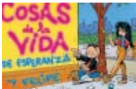
Para realizar las actividades del programa se elabora material de apoyo para padres, profesores y alumnos

El problema de las drogodependencias ha sido y continua siendo un problema sanitario de primer orden y uno de los que más preocupa a la sociedad, especialmente a los padres. Actualmente, el consumo de drogas es muy elevado y ha sufrido cambios importantes en los últimos años. La drogodependencia está muy relacionada con el ocio y los fines de semana, siendo los jóvenes los que más han incrementado el consumo de drogas. La prevención es una de las mejores alternativas para que el problema de las drogas no resulte incontrolable. Pero ésta no debe aplicarse sólo ante los grupos de riesgo, es decir, los jóvenes, sino también en todos los aspectos que pueden influir en ellos, como la familia o la escuela. Además, es necesario ir adaptando los programas preventivos de intervención a