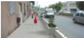
Maqueta de la calle Balmes, una vez finalizadas las obras para evitar inundaciones

La calle Balmes, en el tramo situado entre las calles Moli y Calvario, viene siendo un punto conflictivo en cuanto a inundaciones, tal y como quedó reflejado en un estudio reciente, realizado tras las fuertes lluvias de principios de setiembre, en la que numerosos puntos de Ripolllet se vieron afectados. Por este motivo, el Ayuntamiento, junto a las asociaciones de vecinos de Maragall y Can Mas han estado trabajando este tema en los últimos meses. Fruto de estas reuniones, los Servicios Técnicos Municipales han redactado un proyecto, que fue aprobado inicialmente por la Comisión de Gobierno del