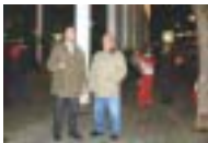
L'altalena va encendre els llums de Nadal amb un comandament a distància

T'has portat bé aquest any? Aquesta és la gran pregunta que tothom fa als nens per Nadal. A l'espera dels Reis Mags d'Orient, la il·lusió va augmentant conforme s'apropa la data. Ja no hi ha classes, però ningú no s'avoreix, perquè, com cada any, entitats i Ajuntament tenen preparades nombroses activitats.