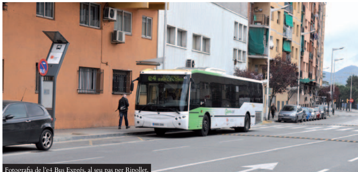
Fotografia de l'e4 Bus Exprés, al seu pas per Ripollet.

o bé no rebre'n cap, però haver estat inscrit/a com a demandant d'ocupació durant un mínim de 12 mesos en els darrers 2 anys i trobar-se en un procés actiu de cerca de feina: us heu d'adreçar a l'Oficina de Treball del Servei d'Ocupació de Catalunya.