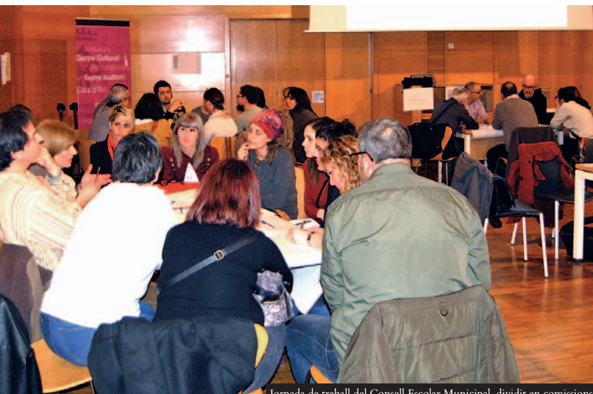
Jornada de treball del Consell Escolar Municipal, dividit en comissions