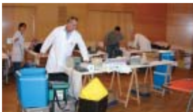
Prop de 300 persones es van apropar al Centre Cultural per donar sang

Ripollet ha demostrat, una vegada més, el seu esperit solidari, superant àmpliament les expectatives del Banc de Sang durant la jornada extraordinària de donació de sang que va tenir lloc el passat 10 d'octubre. En total, es van aconseguir 253 donacions. Tot i que van ser prop de 300 les persones que es van apropar al Centre Cul-