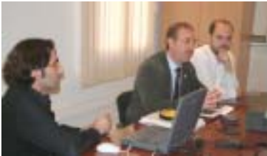
L'alcalde, amb el regidor i el tècnic de Joventut, durant la presentació de l'esborrany del Pla

La Regidoria de Joventut està treballant des de fa uns mesos en un esborrany del que serà el Pla jove local 2004-2008. Es tracta d'un projecte quadriennal que vol optimitzar els recursos de què es disposen, a nivell municipal, en l'àmbit de la joventut. Així, en aquest Pla, un cop finalitzat, restaran definides les polítiques municipals de joventut, estructurades a partir de sis eixos bàsics, que són: l'habitat-