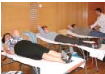
Els dies 1 i 2 de novembre es realitzarà una altra jornada de donació de sang

Els ciutadans i ciutadanes de Ripollet van aconseguir doblar gairebé les expectatives del Banc de Sang durant la jornada extraordinària del passat 10 d'octubre, amb un total de 253 donacions i 42 oferiments que no es van poder fer efectius. L'èxit principal de la jornada va radicar, especialment, en el gran nombre de donants nous que es va registrar, ja que per a 89 d'ells era la primera vegada que donaven sang. A més, prop de la meitat dels donants eren menors de 35 anys, un fet que també ha estat valorat molt positivament pel Banc de Sang de l'Hospital Dos de Maig i l'Hospital de la Santa Creu i Sant Pau. El proper 1 i 2 de novembre, el Centre Cultural acollirà dues sessions més de donació de sang, dins del calendari anual establert.