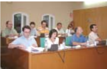
El CPr i el PP van votar en contra de la proposta de modificació de les indemnitzacions