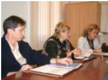
Informant de la reunió Comissió Permanent del Consell Escolar Municipal

A la passada reunió de la Comissió Permanent del Consell Escolar Municipal, celebrada el 22 d'octubre, es va tractar, entre d'altres temes, la incorporació de Ripollet al Pla d'actuació per a l'alumnat de nacionalitat estrangera 2003-2006 de la Generalitat de Catalunya. L'entrada, però, de Ripollet en aquest programa, està subjecta a la condició que en lloc d'aplicar-se a dos dels centres educatius de la ciutat, tal i com havia previst la Generalitat, s'estengui a tota la població, una condició que ha estat acceptada. Es tracta, doncs, de crear un pla específic de Ripollet, amb l'objectiu de millorar la integració social i escolar de tots aquells alumnes, pares i mares que tinguin necessitats. A Ripollet, juntament amb Palau-Solità i Plegamans, seran les dues poblacions de la comarca