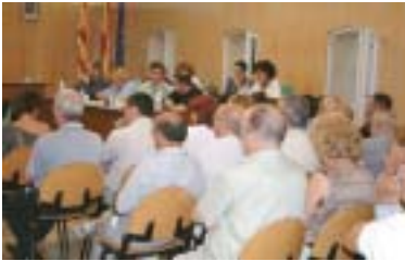
El compte general de 2002 va ser rebutjat durant el Ple de setembre

La ratificació del preu del tiquet del menjador escolar per al curs 2003-2004 va ser un dels acords que es van prendre al Ple Ordinari que l'Ajuntament de Ripollet va celebrar el passat 25 de setembre. Durant aquest curs, el menú del servei de menjador a les escoles públiques costa 4,50 euros per a tots els alumnes de parvulari i primària, i així s'apuja dos cèntims d'euro respecte el preu de l'any passat. L'acord, que ratifica l'adoptat per la Comissió de Govern del passat 30 de juliol, va ser pres per 12 vots a favor, 3 en contra del PP i 6 absències del grup del CpR. ICV i CIU, tot i que hi van votar a favor, van destacar la necessitat de revisar la política actual de beques. El PP es va manifestar en contra de l'acord i el CpR s'hi abstingué, ja que, tot i el lleuger increment del preu, aquest continua essent una càrrega per a moltes famílies.