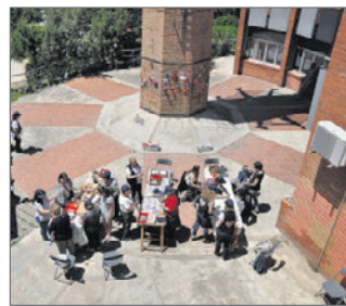
Xemeneia de Can Calvet