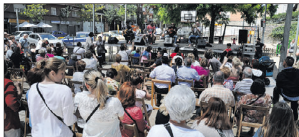
El barri de Maragall va celebrar del 27 al 29 de maig la 25a edició de la seva festa amb tot d'activitats al parc de Maria Lluïsa Galobart.