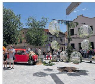
Plaça de Can Clos