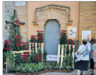
Església de Sant Esteve