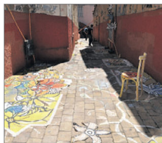
Baixada dels Corbs