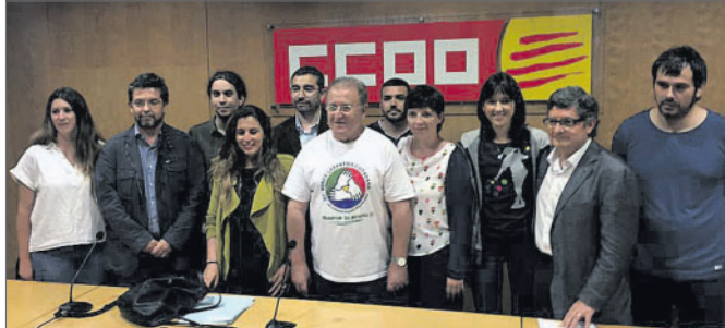
Foto de grup de representants de Sabadell Acció Social i la Comissió Promotora Renda Garantida de Ciutadania, a la Sala d'Actes de CC OO.

L'alcalde de Ripollet, José María Osuna va participar, juntament amb altres 50 batlles, a l'acte de suport a la Comissió Promotora de la Renda Garantida de Ciutadania, realitzat a CC OO de Barcelona. Aquesta no és la primera vegada que Ripollet es posiciona a favor d'aquesta ILP, que té per objectiu que ningú visqui per sota del llindar de la pobresa. En dues ocasions, el Ple Municipal ha debatut