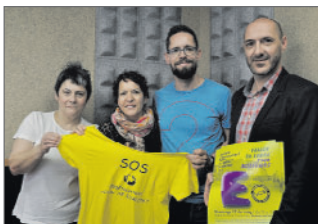
Representants de la Plataforma a la ràdio

La Plataforma d'AMPA de Ripollet ha reactivat els 'dimecres grocs', perquè un dia a la setmana la comunitat educativa es posi la samarreta groga amb l'eslògan 'SOS ensenyament públic i de qualitat' per visualitzar el suport