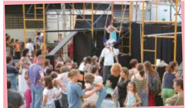
Grans i petits van omplir la plaça de Pere Quart per participar al taller de circ a càrrec de Waka'l Circ