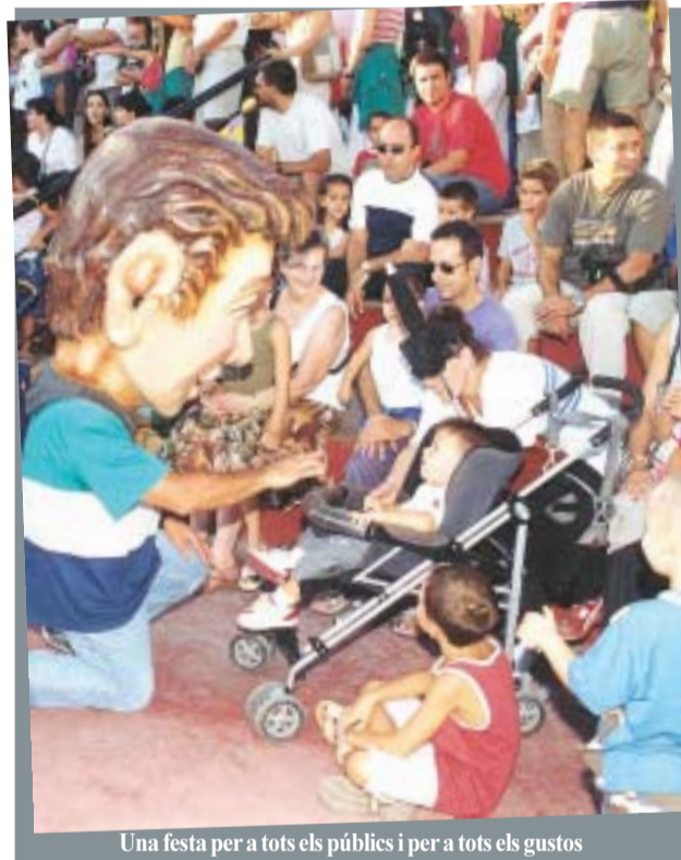
Una festa per a tots els públics i per a tots els gustos