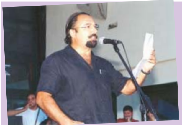
L'actor Toni Sevilla, pregoner de la Festa Major 2003