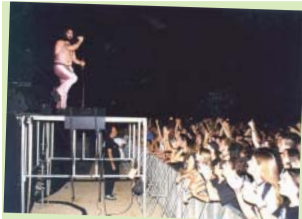
Hardreams i Mojinis Escocios van atreure 8.000 persones al Camp de Futbol Municipal