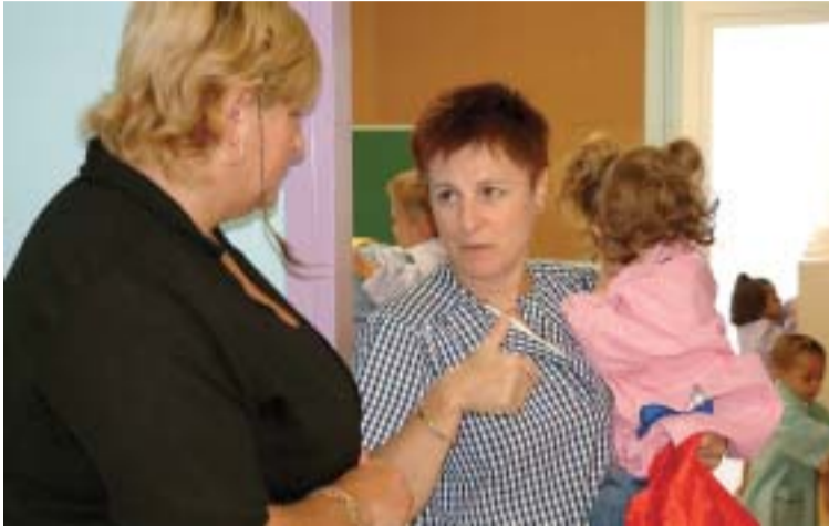
La regidora d'Educació va visitar totes les escoles el passat dia 15 de setembre

Prop de 2.900 alumnes de primària i més de 1.400 de secundària iniciaven les classes el passat 15 de setembre als diferents centres públics i concertats de Ripollet. També ho van fer uns 200 alumnes dels cicles formatius de grau mitjà i superior de l'Institut Palau Ausit. Com ha passat enguany a la