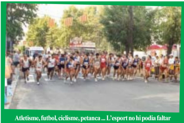
Atletisme, futbol, ciclisme, petanca ... L'esport no hi podia faltar