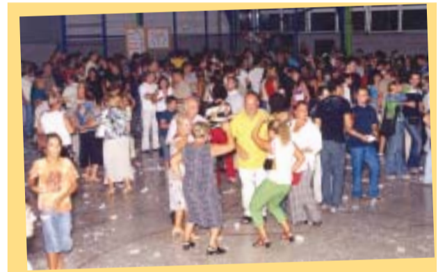
Molta música, ball i confetti per acomiadar la Festa Major 2003