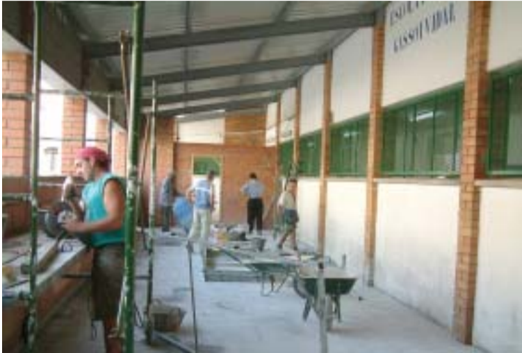
El menjador de l'escola Gassó podrà acollir 53 nens per torn

La construcció d'un menjador al CEIP Gassó i Vidal ha estat la millora més important de les que ha fet l'Ajuntament durant l'estiu a diferents centres educatius. Els treballs han consistit en l'ampliació de l'edifici, aprofitant una zona enjardinada, per tal de construir el menjador i una cuina. A més, s'han aprofitat les obres per ampliar el vestíbul de l'escola, reformar els lavabos i construir-ne un d'adaptat. Fins ara, l'escola no comptava amb cap menjador, cosa que feia que els alumnes s'haguessin de traslladar al CEIP Enric Tatché. Aquest menjador, que es preveu que estigui enllestit durant els primers dies d'octubre, està preparat per donar servei a 53 nens per torn.