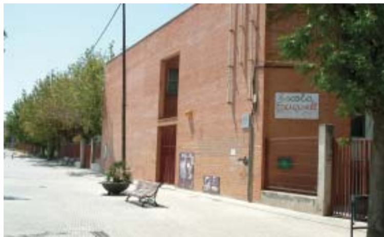
Els problemes de clavegueram de l'Escursell han quedat solucionats

Les obres de manteniment i millora que l'Ajuntament ha realitzat als centres educatius durant l'estiu es completen amb els treballs de pintura interior i exterior al CEIP Josep M a Ginesta, amb un cost de 42.671,46 euros.