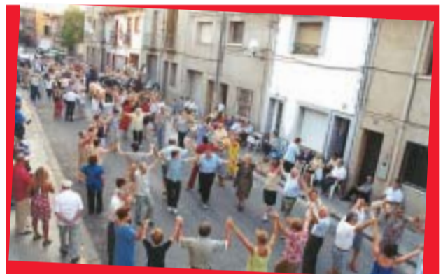
La festa més participa dels darrers anys a Ripollet