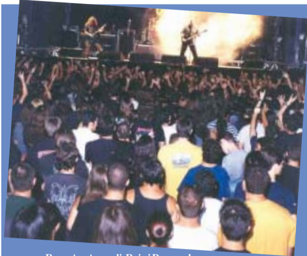
Rage, Ars Amandi, Rain i Dragonslayer van arrassar a la XI edició del Ripollet Rock