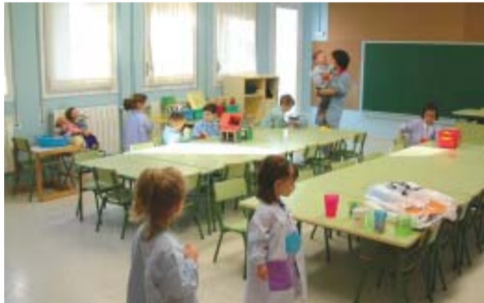
La primera promoció del nou CEIP Teresa Vila estarà constituïda per 50 alumnes que enguany cursen P-3 a les escoles Tatché i Ginesta

A més, totes les obres realitzades durant l'estiu a les diferents escoles van estar a punt per a l'inici de les classes, a excepció, com ja estava previst, del menjador del CEIP Gassó i Vidal. Enguany, s'ha renovat el clavegueram de l'escola Francesc Escursell i s'han realitzat treballs de pintura al CEIP Josep M a Ginesta.