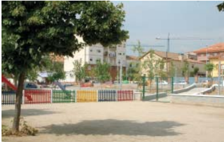
Una de les dues zones verdes servirà d'accés al col·legi Tiana

A una banda del centre hi trobem una nova edificació de planta baixa, destinada al futur centre cívic, a sobre del qual es podria edificar, en cas que fos necessària, l'ampliació de l'escola amb una nova línia. Just al costat d'aquest edifici s'ha construït una pista de bàquet, per a nens i nenes a partir dels 8 anys, connectada amb la pista coberta de l'escola a través d'una porta. Els més petits també disposen d'un nou espai de joc, a la zona verda de l'altra banda del centre. Aquest espai està pensat com un vestíbul per