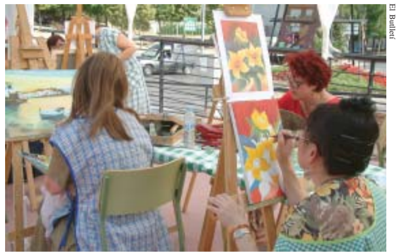
La plaça del Pavelló acollí diversos tallers d'artesanía i cuina

Una taula rodona sobre l'educació de persones adultes va ser l'acte que donà el tret de sortida a la celebració del quart de segle de vida amb què compta el centre. Sota el títol 'Passat, Present i Futur de l'Educació de Persones Adultes. El futur de l'escola', es va