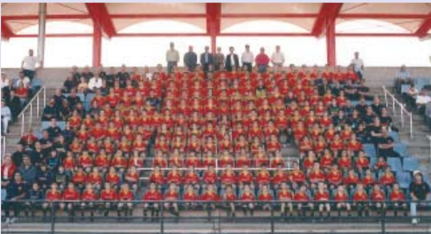
Jugadors del Club de Futbol Ripollet. Temporada 2002-2003

- Què fan: Tots els equips, durant la temporada, realitzen competicions oficials, excepte els barrufets (de 4 a 5 anys), que juguen en una lliga interna comarcal. El club organitza durant el mes de juny el torneig 'Setmana esportiva de futbol base', que enguany ha arribat a la 23a edició. A més, el CF Ripollet organitza el 'Torneo Jordi Balaguer', en record a l'anterior president, on hi participa el primer equip. A banda de l'aspecte esportiu, els socis del CF Ripollet organitzen durant l'any partits entre pares, sortides, excursions, dinars, etc. De cara a la propera temporada, el CF Ripollet ja ha obert les inscripcions, que es poden realitzar cada tarda, de 18 a 21 hores.