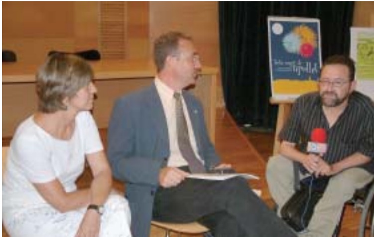
La directora del Centro Cultural, el alcalde de Ripollet y el concejal de Cultura, durante la presentación del programa de la Fiesta Mayor

El actor Toni Sevilla, muy conocido por su papel en las series televisivas 'Policías' y 'El cor de la ciutat', será el encargado de desear a los vecinos y vecinas de Ripollet, como pregonero, una buena Fiesta Mayor 2003.