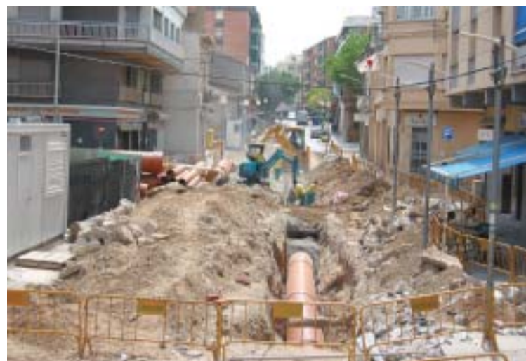
Se ha colocado una nueva cloaca principal de 80 cm de diámetro

La prioridad de los espacios para las personas es una de las características básicas de las obras del proyecto de arreglo de la avenida de la Cruz Roja y la carretera de la Estación, iniciadas el pasado 4 de junio. El tratamiento que se dará a esta vía será similar al aplicado en su prolongación a partir de los Quatre Cantons en Cerdanyola, con el objetivo de constituir un paseo peatonal desde la pasarela del parque del río Ripoll hasta pasada la estación de Renfe. Una vez finalizadas las obras, habrá un nuevo paso de peatones para cruzar la carretera N-150 y así no tener que cambiar de acera desde la estación de Renfe, ni tener que cruzar por el paso subterráneo. El proyecto también incluye el cambio del alcantarillado. Ya se ha colocado una nueva cloaca principal de 80 centímetros de