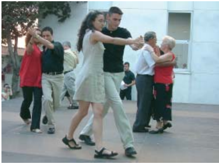
Actuació dels alumnes del taller de balls de saló

Els cursos i tallers organitzats pel Patronat Municipal de Cultura i Joventut (PMCIJ) han comptat, durant el curs 2002-2003, amb més de 500 alumnes. El passat 19 de juny tots ells celebraren la festa de fi de curs al pati del Centre Cultural. Alguns van poder mostrar, in situ , el que han après durant el curs, com els alumnes del taller de guitarra o els de balls de saló, que van actuar al pati del Centre Cultural. D'altres, com els dels tallers d'espai d'art, arts decoratives, tall i confecció, puntes de coixí, dibuix i fotografia ho han fet a través de diverses exposicions, que s'han pogut visitar al Centre Cultural durant el mes de juny.