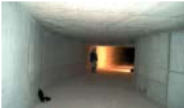
El colector es capaz de evacuar 23 m 3 de agua por segundo

Los problemas de inundaciones que han padecido cíclicamente las calles cercanas al río Ripoll pasarán a la historia en breve. Las obras de mejora del tramo final del colector "Eix Rambla", que transcurre desde el final de la calle Montcada hasta la calle del Río, pasando por la calle Industria, finalizarán durante este mes de abril.