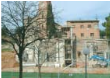
Estado actual de las obras del parque María Lluïsa Galobart

A este proyecto se le suman unas obras complementarias que se están llevando a cabo en la acera de la calle Maragall. Se trata de ampliarla casi un metro, mejorando su accesibilidad y reduciendo la anchura del paso de vehículos para evitar el aparcamiento en doble fila. Además, se renovará todo el pavimento, se plantarán nuevos árboles y se colocará nuevo mobiliario urbano e imbornales.