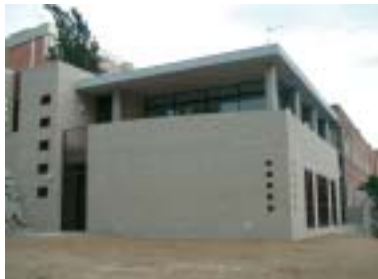
S'ha construït un edifici annex de nova planta al costat del Casal

Aquesta ampliació va ser inaugurada oficialment el 29 de març, en un acte on l'alcalde de Ripollet va descobrir una placa commemorativa. Durant la celebració, els usuaris del Casal i la resta d'assistents van gaudir d'un refrigeri i de ball amb música en directe.