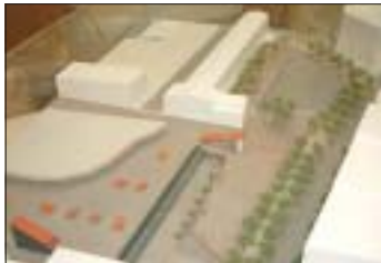
Maqueta del proyecto de remodelación de la plaza Pere Quart

Esta será la primera actuación del ambicioso proyecto de remodelación de la plaza Pere Quart y su entorno, que ya ha sido redactado y que se presentó a los paradistas del Mercado Municipal el pasado 20 de marzo, junto con un estudio de viabilidad que refuerza la necesidad del citado proyecto.