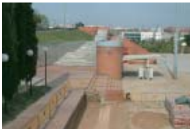
Los accesos al CAP II se mejorarán con la construcción de dos nuevos pasos adaptados

Decidido a eliminar las barreras arquitectónicas de los espacios públicos de Ripollet, el Ayuntamiento está llevando a cabo en la actualidad diversos proyectos con los que se mejorará notablemente la accesibilidad, principalmente, para aquellas personas con movilidad reducida.