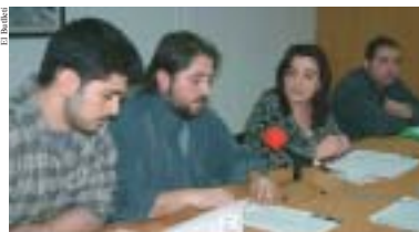
La regidora de Cultura amb els membres de En Vídeo Ripollet i Ripollet Expressió Juvenil

Una de les novetats principals d'aquesta edició és que el certamen passarà a contenir el Cicle de Cinema Infantil i d'Adults que anys anteriors s'havia celebrat de forma separada. Els organitzadors del