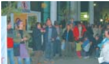
Molts ciutadans i ciutadanes es van concentrar el mateix dia que va començar la guerra, davant el Centre Cultural

Aquest va ser el darrer intent per evitar la imminent guerra a l'Iraq, que començà la matinada del dijous 20 de març.