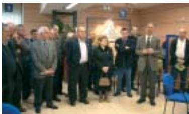
L'OAC fou inaugurada el passat 15 de març

El passat 15 de març moltes persones van apropar-se a les instal·lacions de l'OAC, ubicada a l'edifici Moli d'en Ginesar (Balmes, 2) per tal d'assistir a la seva inauguració oficial,