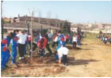
Els participants eren alumnes de 6è de primària de totes les escoles de Ripollet

Un total de 350 persones, entre alumnes, professors i personal de jardineria van participar el passat 21 de març a la celebració del Dia de l'Arbre. Els nens eren estudiants de 6è de primària de tots els centres educatius de Ripollet i van plantar prop de 40 espècies al costat del CEIP Tatché, on es va fer la festa posterior.