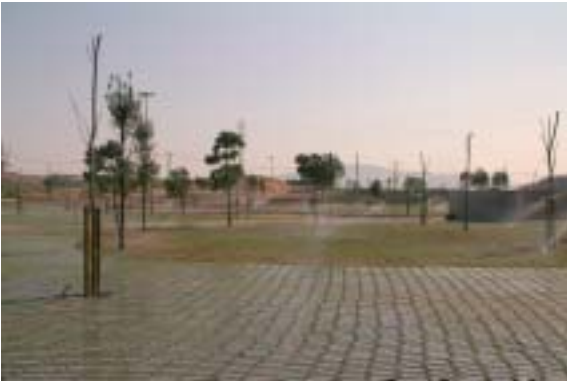
En aquesta segona fase s'ha donat un aspecte més natural al parc i s'ha dotat de serveis

El proper 6 d'abril s'inaugurarà la segona fase del parc dels Pinetons, realitzada a càrrec de la Mancomunitat de Municipis de l'Àrea Metropolitana de Barcelona, amb un pressupost de 557.834 euros. Per celebrar-ho, s'instal·laran inflables i un espectacle de circ animarà els assistents. Tots aquells que hi vulguin anar ho poden fer utilitzant el trenet que recorrerà la rambla de Sant Jordi i arribarà fins al final de la rambla de les Vinyes, on es troba l'entrada del parc.