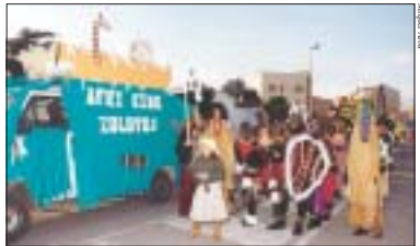
'Fuente de ilusión' i 'Afri King Zuluyus' van ser els guanyadors en les categories de millor disfressa individual i millor comparsa

El sentit de l'humor, la imaginació i la disbauxa van ser les característiques de totes les comparses i disfresses individuals que van participar al concurs organitzat pel Patronat Municipal de Cultura i Joventut. Uns trets que també van deixar palesa la gran feina que van tenir tots els participants per confeccionar les seves disfresses. Milers de persones sortiren un any més al carrer per