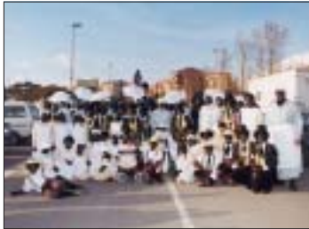
'Missipi's Blues' va guanyar el premi a la millor comparsa segons votació popular

La festa gran tingué lloc dissabte, on les 16 comparses i les 6 disfresses individuals que participaren al concurs de Carnaval, juntament amb milers de ripolletencs van omplir els carrers de la ciutat, portant la disbauxa arreu. Un cop acabada la rua, els Diables de Ripollet van donar pas a les Bruixes, que van realitzar un impressionant espectacle de música, ball i foc. Durant el ball posterior, amb discoteca mòbil, es va fer públic el veredictes i es realitzà l'acte de lliurament de premis. Dimecres de Cendra es posà punt i final al Carnaval amb un sardinada popular, a càrrec d'El Setrill.