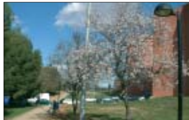
Se han instalado 58 faros del modelo Quebec en el parque y sus accesos

Este mes han entrado en funcionamiento los 58 nuevos faros instalados en los caminos y paseos del Parc Gassó