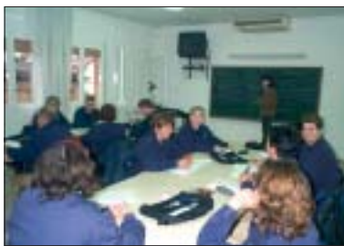
Els 24 usuaris del Taller d'Ocupació Viver Pinetons han rebut una formació bàsica en prevenció de riscos laborals

Els alumnes del Taller d'Ocupació Viver Pinetons han realitzat durant el mes de febrer un curs bàsic de prevenció de riscos laborals, en el marc del projecte Concerta. Es tracta d'una iniciativa innovadora, destinada al foment de la salut laboral, la qualitat i la protecció del medi ambient a les petites i mitjanes empreses del Vallès Occidental. Concerta està impulsat per organitzacions empresarials, sindicats i el Consell Comarcal, dins del segon pla d'acció del Pacte per l'Ocupació del Vallès Occidental. Aquesta iniciativa té el reconeixement i el suport econòmic de la Unió Europea, essent finançada a través del Fons Social Europeu. El projecte Concerta es va iniciar l'any 2001 i finalitzarà enguany. A Ripollet, aquest curs ha estat possible gràcies a la col·laboració entre el Patro-