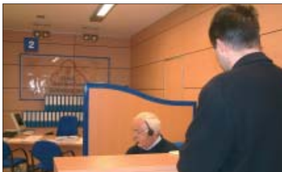
La OAC está actualmente preparada para realizar más de 90 servicios y funciones

El Ayuntamiento de Ripollet ha creado la Oficina de Atención Ciudadana (OAC), que funciona desde hace unos tres meses en período de pruebas. El próximo 15 de marzo la OAC realizará una jornada de puertas abiertas, para que todo aquél que todavía no la ha visitado pueda hacerlo y conozca todos aquellos trámites, gestiones e informaciones que le pueden facilitar en esta oficina.