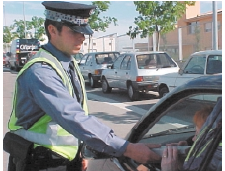
Control de alcoholemia

Conjuntamente con el Departamento de Servicios Sociales, se ha creado el proyecto «Absentismo escolar» y se ha designado un cabo como responsable de coordinar todas las actuaciones con menores, que normalmente requieren un seguimiento posterior por parte de los educadores sociales. Las actuaciones con menores sobresalen, no por la cuantía de su número (un total de 35, de las cuales 14 son por absentismo es-