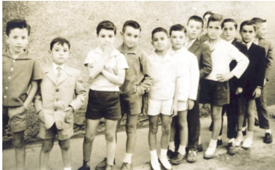
A l'esquerra, grup de nenes fent la comunió a la dècada dels cinquanta. A la dreta, grup de nens de l'escola Sant Gabriel

L'any 1951 varen arribar al Celler Cooperatiu de Ripollet al voltant de 1.200.000 quilos de raïm procedents de la collita d'aquell any. Però, si em permeteu, avui no us parlaré d'aquesta collita, tot i que reconec la seva importància per a l'activitat agrària del poble, sinó d'una altra molt diferent i que té relació amb els naixements que es varen produir a la vila al llarg d'aquest mateix any. Segons es va recollir a la Hoja Parroquial, va arribar a un total de setanta infants, 33 nois i 37 noies. De fet, a l'època tothom passava per la vicaria i, per tant, podem donar la dada com a bona, per no dir del tot exacta.