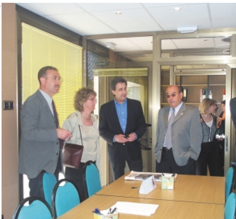
La presidenta del Consell Comarcal visita el Club de la Feina

El Club de la Feina, una eina per millorar la situació laboral