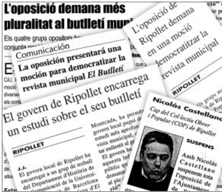
Informaciones sobre el tema, publicadas en los medios locales y comarcales

«En las revistas o emisoras municipales se refleja (más bien o más mal, con más o menos profesionalidad) toda la actividad municipal. Y, quiera o no quie-