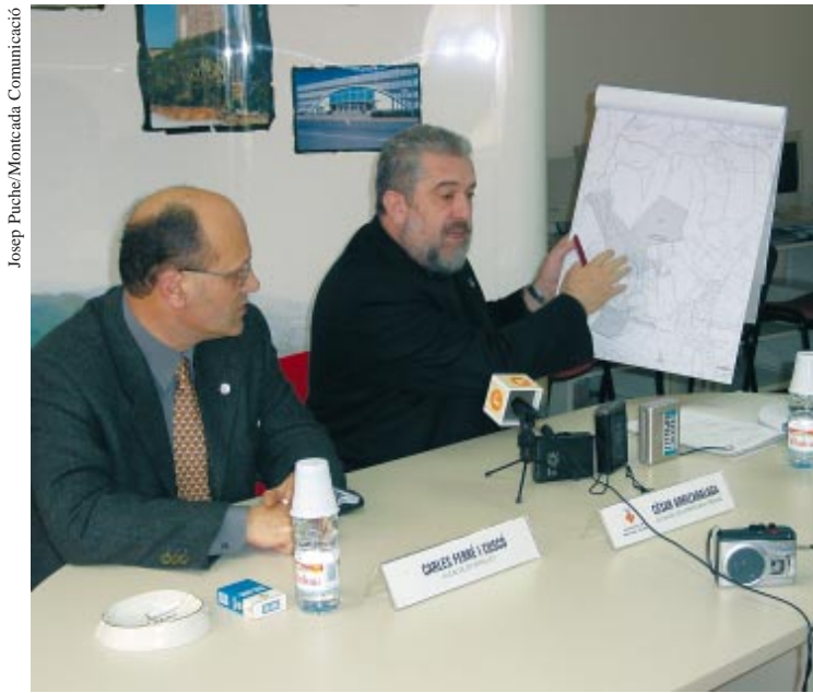
Roda de premsa dels alcaldes de Ripollet i Montcada per explicar l'estat de les negociacions.