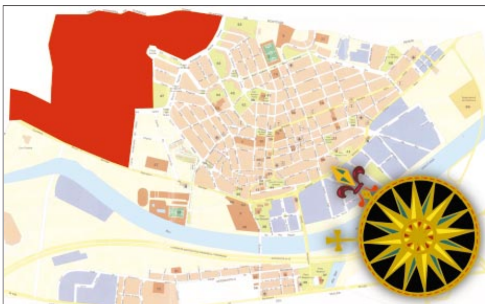
Arriba, propuesta de calificación de los terrenos. Sobre estas líneas, situación del Plan del Noreste en el término municipal.

■ la totalidad de los espacios libres, que ya son públicos (inscritos en el Registro de la Propiedad), como es el Parc dels Pinetons o las zonas verdes que tienen que urbanizar los promotores.