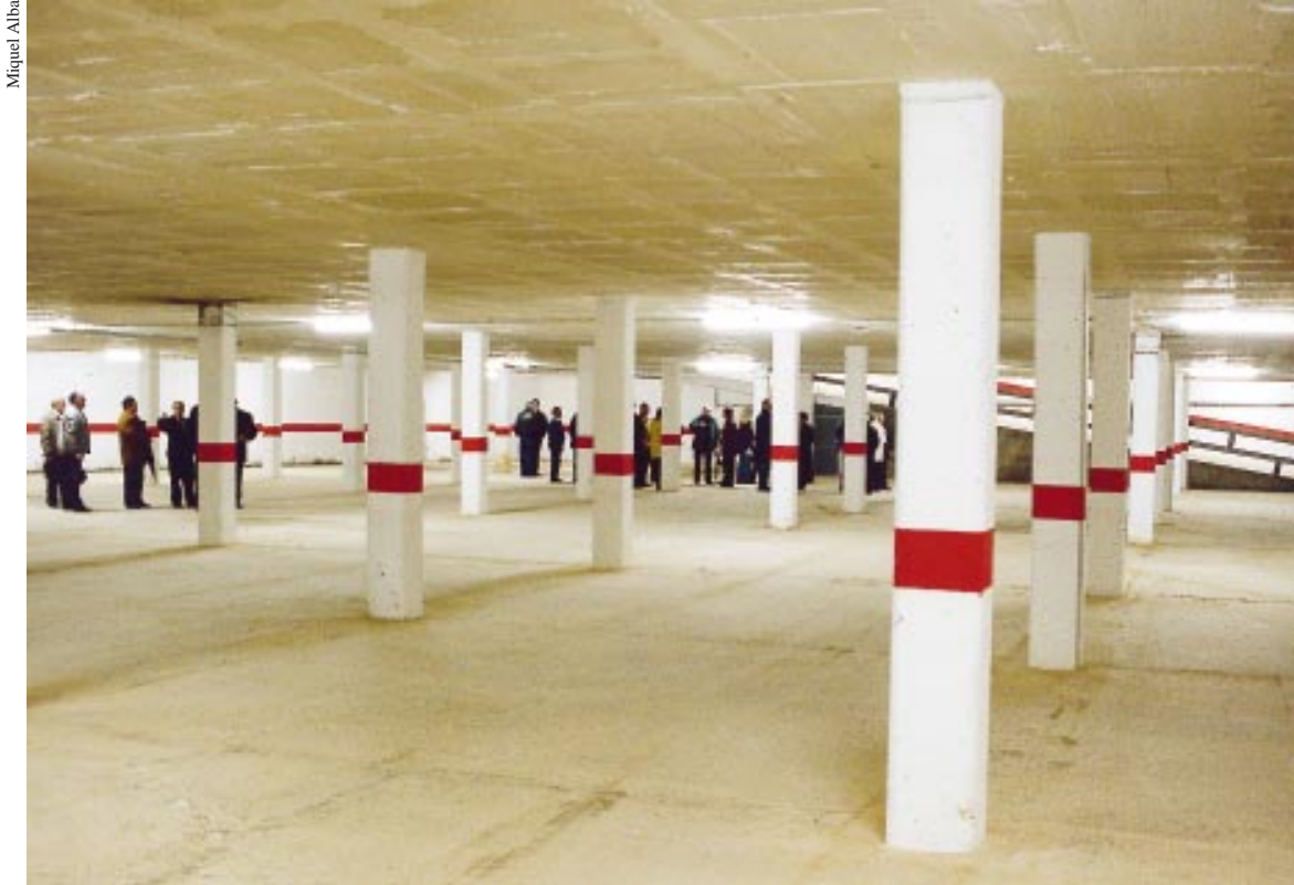
Interior de l'aparcament d'El Molí. Al fons, els visitants.

L'aparcament del Molí entrarà en funcionament en els propers mesos, una vegada enllestits els darrers treballs de condicionament. L'aparcament comptarà amb dues-centes places, 50 de les quals seran de propietat municipal i s'oferiran als comerços de Ripollet. La inversió municipal ha estat de 40 milions de pessetes.