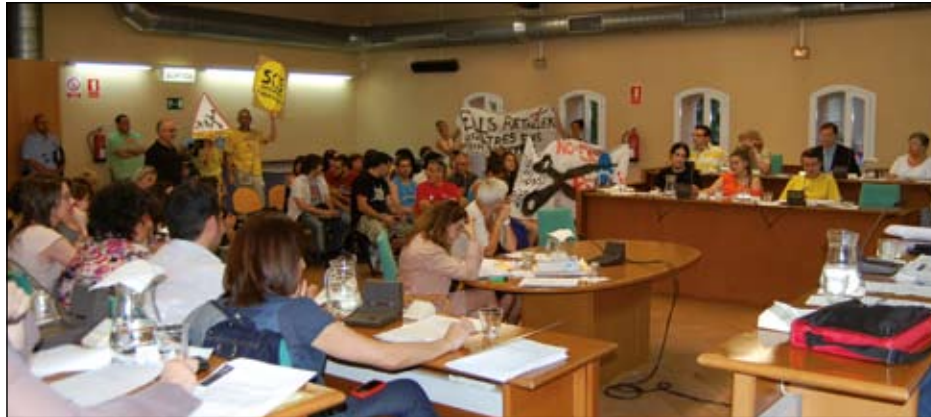
DURANT LA SESSIÓ, MEMBRES DE LA COMUNITAT EDUCATIVA VAN PUJAR A LA SALA DE PLENS

El dia 31 de maig es va celebrar la sessió ordinària del Ple Municipal del mes de maig, que va comptar amb vuit punts en l'ordre del dia. Entre ells va destacar, principalment, la dissolució dels consells municipals de Joventut i Solidaritat i l'apartat de mocions, on es va donar suport a l'ensenyament públic.