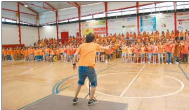
UNOS 600 ALUMNES CANTANT CONJUNTAMENT TEMES DE MUSICALS

La música estarà present en bona part de les activitats de fi de curs dels centres educatius. La Cantada realitzada per 7 escoles i els concerts de l'INS Can Mas en són un bon exemple. Destacar també la commemoració del Dia Internacional de la Música, el 21 de juny al pati del Centre Cultural. Vegeu l'Agenda.