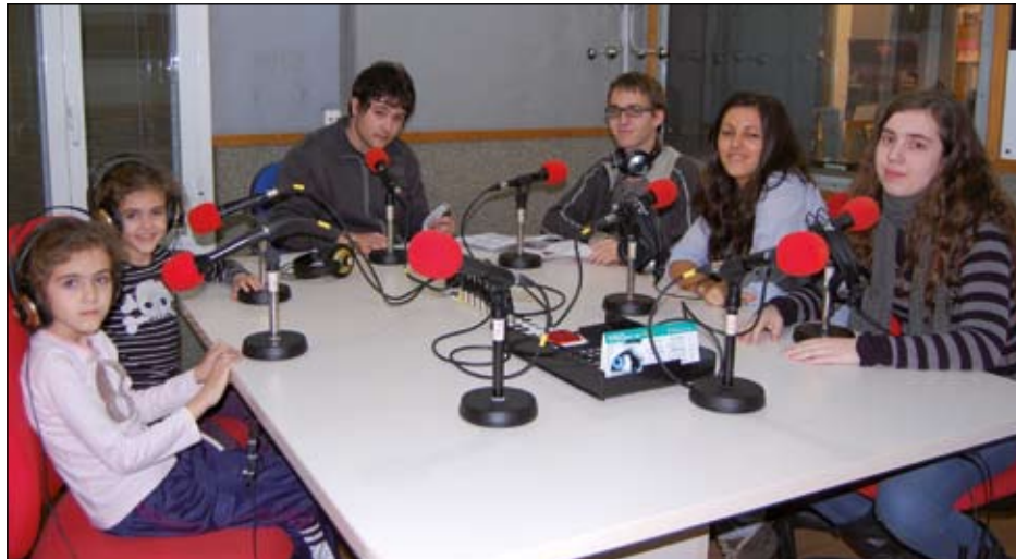
EL CLUB D'ESCACS RIPOLLET HA ESTAT UNA DE LES DARRERS INCORPORACIONS A LA PROGRAMACIÓ

La convocatòria va adreçada a associacions que mai hagin realitzat un programa propi i que estiguin interessades en disposar d'un espai radiofònic per donar difusió a les seves activitats. En l'actualitat, l'emissora compta amb una programació consolidada, amb una trentena d'espais,