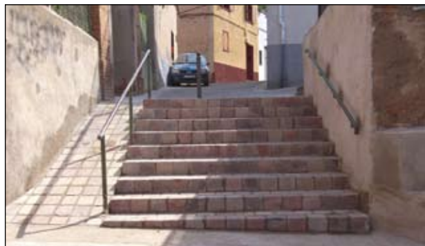
ESCALES D'ACCÉS A GENERAL PRIM

En el marc dels plans d'ocupació 2012, que està portant a terme el PMO i que donen feina a 41 aturats de Ripollet, el Patronat Municipal d'Ocupació ha realitzat petites feines de manteniment o reparació a carrers i equipaments. Aquest ha estat el cas de l'escola Anselm Clavé, amb la construcció i col·locació d'un armari a mida per col·locar-hi material esportiu o la construcció d'una mini-graderia al Centre Cívic Maragall. El personal del Patronat Municipal d'Ocupació també s'ha ocupat de repintar i homogeneïtzar la senyalització viària de les parades d'autobús del nostre municipi, seguint les instruccions de la Policia Local de Ripollet. Durant les darreres setmanes, la Brigada Municipal ha realitzat dues accions noves. Es tracta de la remodela-