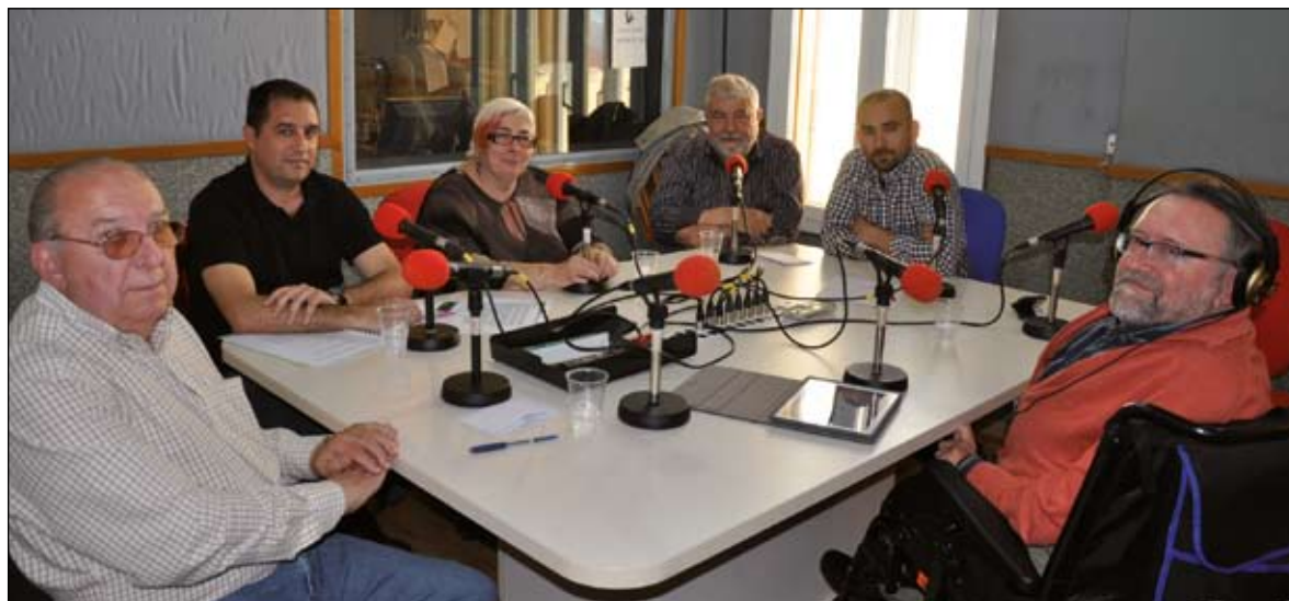
EDICIÓ ESPECIAL DEL PROGRAMA L'HORA DE TE , AMB ELS RESPONSABLES DELS 4 SERVEIS

Ripollet disposa de diferents canals que ajuden a fer més fàcil la vida dels veïns: l'Oficina Municipal d'Informació al Consumidor (OMIC), l'Oficina de Mediació, el Defensor del ciutadà i el Jutjat de Pau. Cadascun toca diferents entorns relacionals, des del veïnal, al comercial o el tracte amb l'Administració. Tots ells es van trobar en un debat, dins els programa L'Hora de te , de Ripollet Ràdio i van posar de manifest que la informació i el diàleg són les millors eines per evitar que els conflictes es facin massa grans. Des del servei més antic, el Jutjat de Pau, creat al 1870, al més nou, Mediació, obert fa 2 anys i mig, els seus responsables posen cada dia cara amable davant una gran diversitat de casos que se'ls presenten i que angoixen els qui els estan patint.