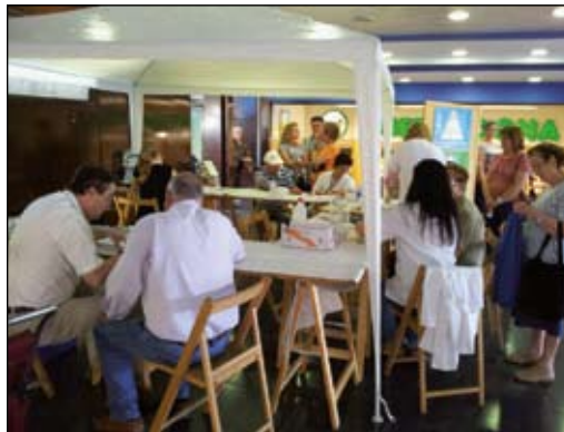
EL PROGRAMA VA INCLoure, ENTRE D'ALTRES, UNA ACTIVITAT DE PREVENCIÓ CARDIOVASCULAR I UNA XERRADA DINÀMICA A LA BIBLIOTECA SOBRE ALIMENTACIÓ