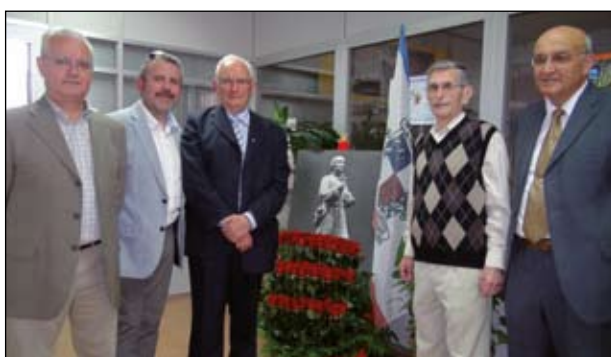
ELS DIRECTORS DEL COL·LEGI AL LLARG DELS SEUS 50 ANYS

L'acte central va tenir lloc el 12 de maig, amb un acte religiós, seguit de la inauguració d'una exposició retrospectiva i un vídeo, activitats lúdiques i xocolatada. L'acte institucional va tenir lloc a la tarda, amb parlaments i una taula rodona amb exalumnes de l'escola, que actualment destaquen en diversos àmbits professionals. La setmana següent va haver una representació a càrrec d'Amics del Teatre i finalment el 16 de juny va tenir lloc la tradicional Festa de la família.