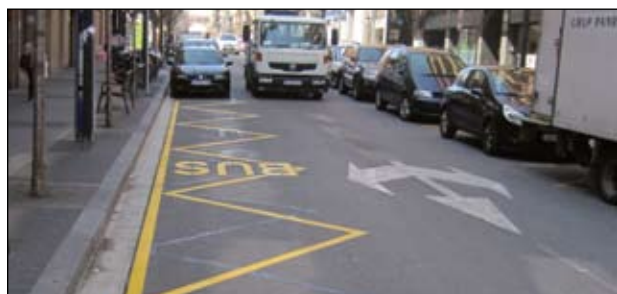
PARADA DE BUS RAMBLA DE SANT JORDI