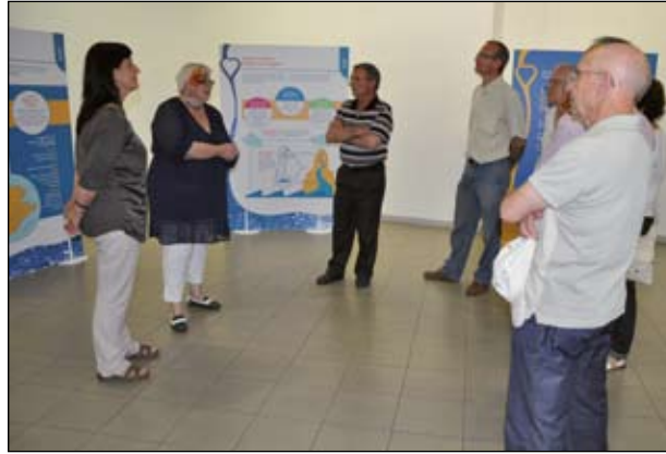
EL DIA 30 DE MAIG, LA REGIDORIA VA OFERIR DUES XERRADES I VA INAUGURAR L'EXPOSICIÓ NOVA CULTURA DE L'AIGUA