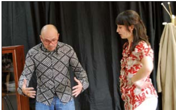
ASSAIG DE L'OBRA PAGUI QUI PUGUI

L'entitat ha programat diverses estrenes teatrals per als mesos de juny i juliol, així com tallers i cursos