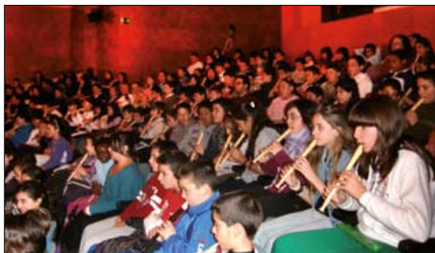
ALUMNES DE L'AULA DE MÚSICA DE L'INS CAN MAS

Uns 600 alumnes de 5è i 6è de Primària van participar a la 7a Cantada, celebrada al Pavelló Joan Creus, l'11 de juny. Els cantaires van interpretar 'El càsting dels musicals', amb 9 cançons en català, castellà i anglès, de musicals teatrals i pel·lícules. Van participar les escoles Clavé, Escursell, Gassó, Ginesta, Tatché, Tiana i, com a convidada, El Viver de Montcada. L'acte va comptar amb la col·laboració de les regidories d'Educació, Manteniment i el PAME.