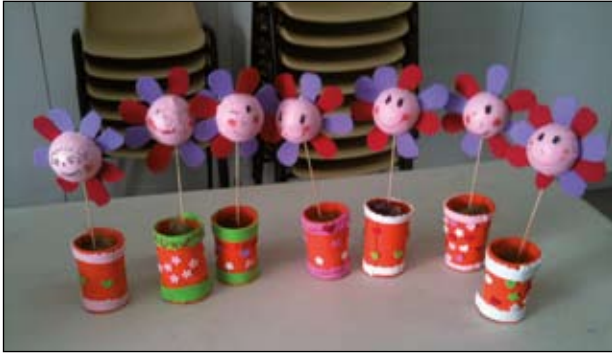
TREBALLS DE L'ESPLAI D'APADIR

Ripollet compta amb un elevat nombre d'entitats, entre elles, aquelles de caràcter solidari i assistencial, que el seu objectiu és fer la vida més fàcil a persones que pateixen alguna malaltia o tenen alguna dificultat, quant a mobilitat o a nivell sensorial.