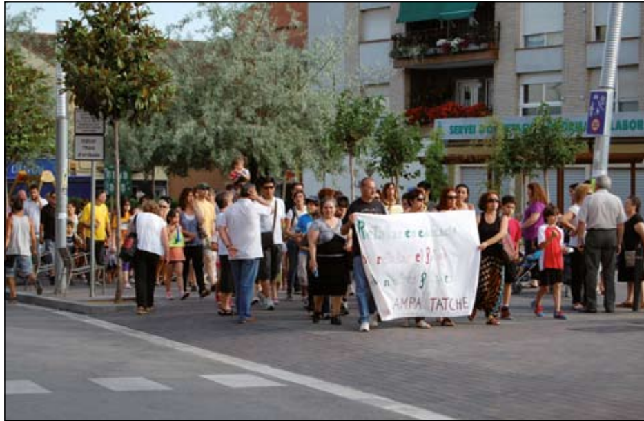
LA MANIFESTACIÓ DE LA COMUNITAT EDUCATIVA EN FAVOR DE L'ENSENYAMENT VA ACABAR A L'AJUNTAMENT, ON S'ESTAVA DISCUTINT UNA MOCIÓ CONTRA LES RETALLADES

Quant a les de Batxillerat, la data és del 2 al 10 de juliol i les dels Cicles Formatius també del 2 al 10 de juliol. Finalment, l'Escola d'Adults Jaume Tuset farà les preinscripcions d'alumnes nous del 14 al 22 de juny i les matrícules del nou curs del 3 al 7 de setembre.