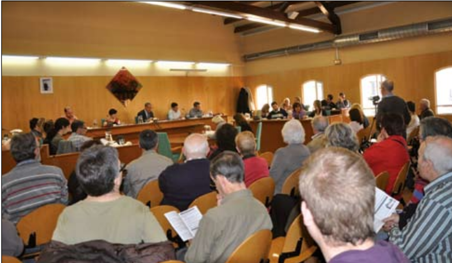
DURANT LA SESSIÓ DEL PLE DEL 26 D'ABRIL DE 2012

L'Ajuntament de Ripollet va celebrar el dijous, 26 d'abril, el Ple ordinari mensual, amb 8 punts a l'ordre del dia. Entre els punts aprovats, destaca el de mocions, amb l'acord unànim de tots els grups a la proposta del PSC en defensa dels afectats per la contractació de participacions preferents, emeses per diferents entitats financeres. Un gran nombre d'afectats de Ripollet va assistir a la sessió per fer visible la important repercussió d'aquesta situació a la localitat.