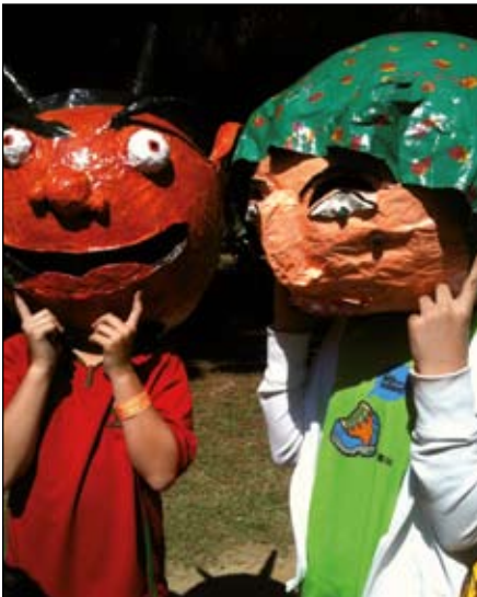
ELS NENS I NENES D'APADIR JA TENEN ELS SEUS PROPIS CAPGROSSOS

L'AECC busquen gent "amb necessitat d'ajudar als altres, amb un gran cor que els permeti treballar sense rebre res material a canvi, sinó únicament, el somriure d'un malalt".