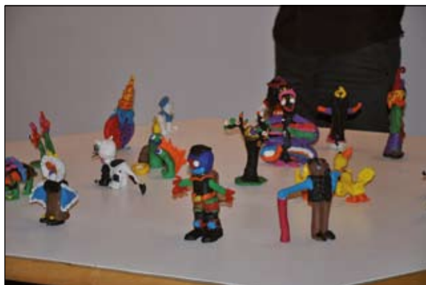
UNA PART DE L'EXPOSICIÓ ANIMACIONS. CONFERINT EL MOVIMENT

Quan el Qertàmen de Teatre Infantil, el seu objectiu d'aquesta activitat és veure el treball que han