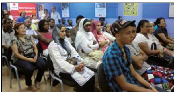
PARTICIPANTS ALS TALLER DE CREU ROJA DE L'ANY PASSAT

En aquest curs es tractaran diversos continguts, com ara les relacions humanes, les tècniques de neteja a la llar, la preparació i elaboració de menús i la manipulació d'aliments. Els participants