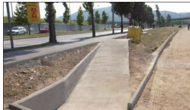
RAMPA D'ACCÉS AL VIAL DEL RIU RIPOLL

que, fins ara, no reunia les condicions òptimes per ser utilitzat. També s'han fet millores al parc dels Mesures, a l'absis de l'església de