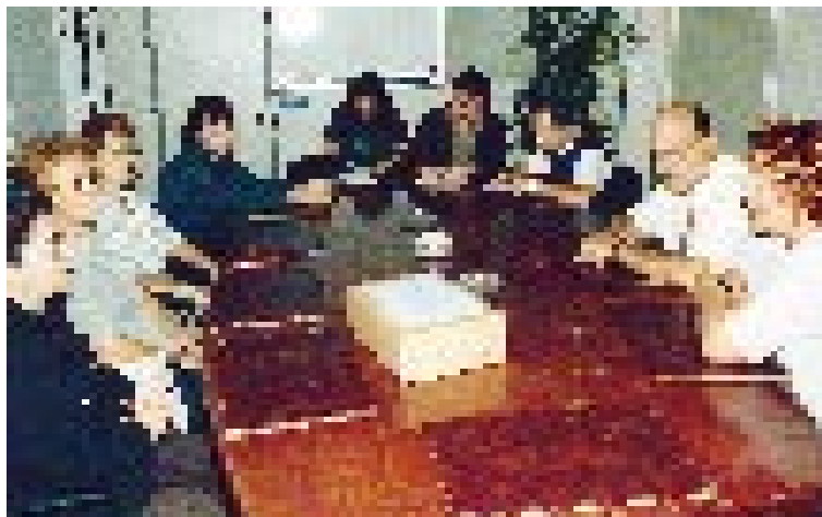
Lliurament de signatures a l'alcalde i la regidoria de Serveis Socials

La iniciativa de la recollida de signatures va sorgir de persones que tenen al seu càrrec familiars d'edat avançada i que han participat en grups d'ajuda mútua. Aquesta iniciativa va comptar amb el suport municipal des del primer moment. L'Ajuntament s'ha compromès a lliurar les signatures a la