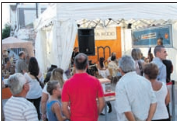
PROGRAMACIÓ CARA AL PÚBLIC DURANT LA FESTA MAJOR 2011