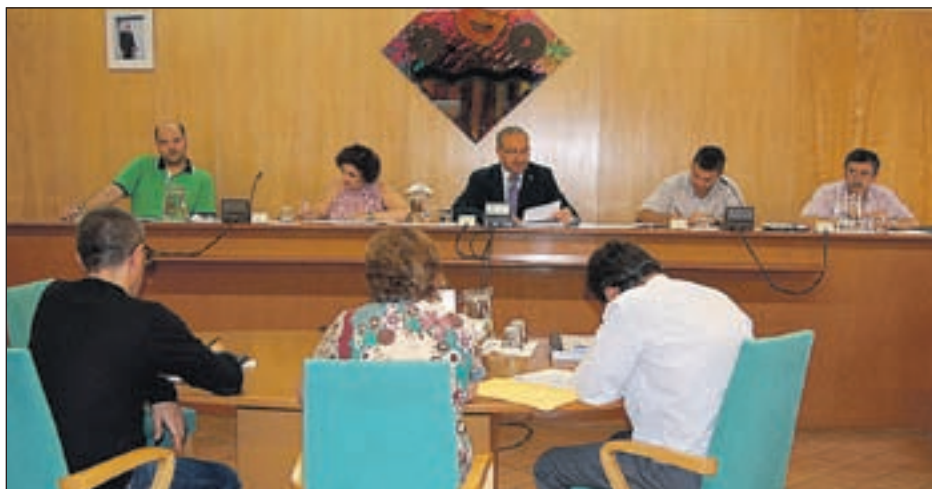
DURANT LA SESSIÓ DEL PASSAT 21 DE JULIOL

Seguidament, es va abordar un expedient de