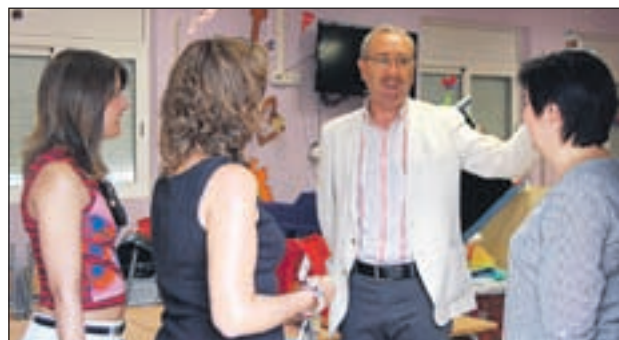
VISITA DE LA REGIDORA I L'ALCALDE A L'ESCOLA ANSELM CLAVÉ