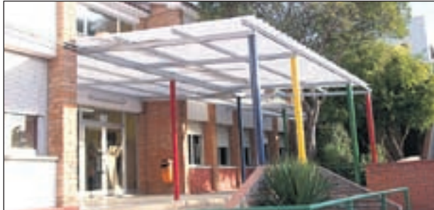
PORXO DE L'ESCOLA GASSÓ I VIDAL

La Brigada Municipal ha estat la responsable de realitzar les reformes d'alguns centres educatius per tal de començar el curs 2011-2012 en les millors condicions possibles.