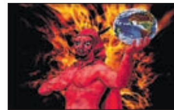
RIPOLLET ACCIÓ FOTOGRAFICA

Per a aquesta ocasió, han presentat la mostra Seven , inspirada en els set pecats capitals. El