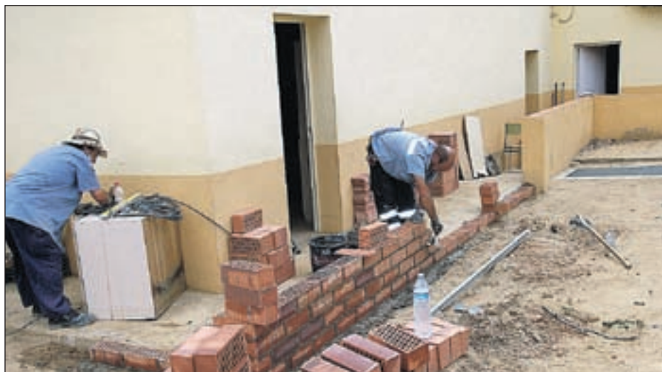
UNA DE LES REFORMES REALITZADES PER LA BRIGADA ALS COL·LEGIS LOCALS