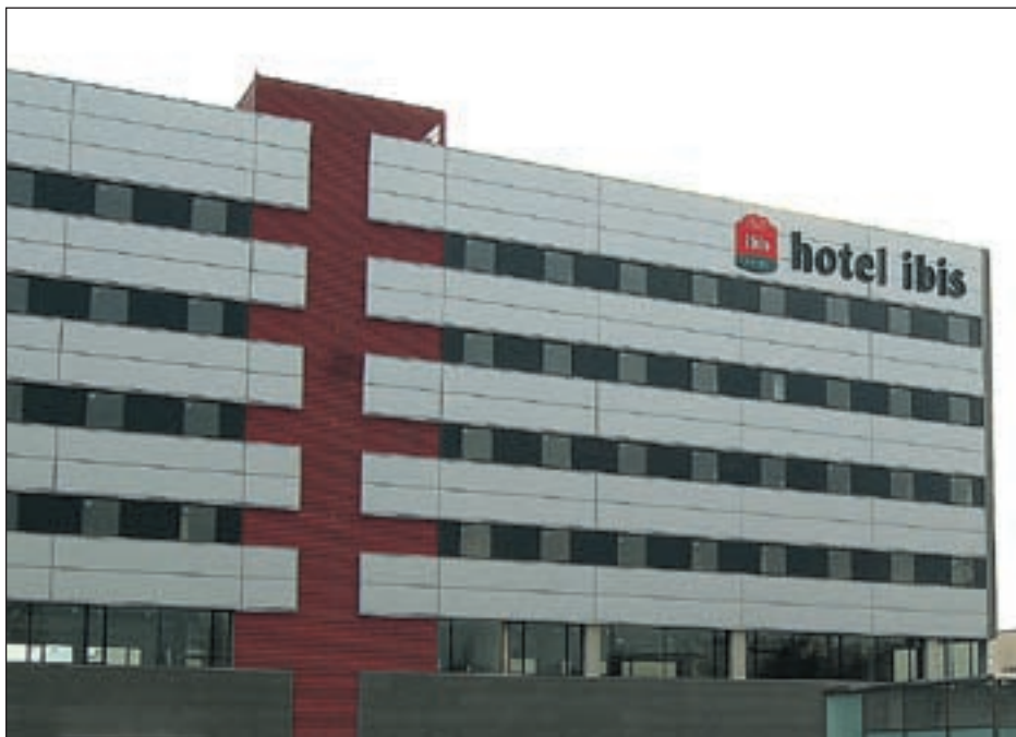
L'HOTEL IBIS RIPOLLET ESTÀ SITUAT AL PARC DEL RIU RIPOLL, DAVANT L'AJUNTAMENT

L'establiment del grup hotelier Accor ha rebut el títol d'Accessibilitat i adaptabilitat d'Equalitas Vitae. L'Hotel Ibis ha seguit un pla d'accessibilitat per a implantar les millores necessàries que aportin òptimes condicions per a l'ús autònom de les seves instal·lacions a persones amb discapacitat. L'establiment ofereix 4 habitacions totalment adaptades. A més, les seves instal·lacions, accessos, zones nobles, banys a zones comuns i cafe-