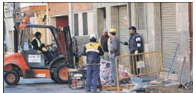
ELIMINACIÓ DE BARRERES ARQUITECTÒNIQUES