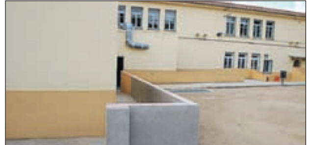
MUR DE CONTENCIÓ DE PLUJA DE L'ANSELM CALVÉ