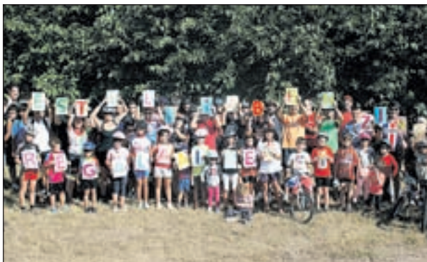
MÉS DE 100 PERSONES VAN PARTICIPAR A LA BICICLETADA CONTRA EL CANVI CLIMÀTIC EL PASSAT 25 DE SETEMBRE

Com és habitual amb l'inici del curs, també comencen les activitats organitzades per la Regidoria de Medi Ambient i la Casa Natura. La primera va tenir lloc el 25 de setembre, amb les activitats de la Setmana de la Mobilitat Sostenible i Segura.