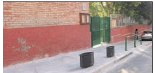
MILLORA DE LA VORERA D'ENTRADA DEL GASSÓ I VIDAL

Així, s'han fet actuacions sobretot als parcs municipals, com ara al Norbert Fusté, la zona verda Gassó-Vargas i al parc del Primer de Maig, dins les obres de remodelació que s'hi duen a terme en el marc del Projecte d'Intervenció Integral al Barri de Can Mas. En total, en aquest pla d'ocupació hi treballen 7 persones amb un contracte de sis mesos de durada.