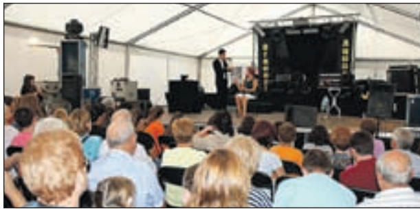
INICI DE LES FESTES L'ANY PASSAT

El barri de Can Tiana - Pont Vell ha celebrat el cap de setmana del 23 al 25 de setembre les seves 31enes Festes de la Tardor. Tot i la pluja, que va provocar alguns canvis en la ubicació dels actes, la participació ha estat un any més el tret més destacat. A banda de veïns i veïnes del barri, moltes entitats, tant de Cerdanyola com de Ripollet, han col·laborat una edició més a les Festes de la Tardor. Com ja és habitual en aquestes festes, conflueixen dos projectes locals com són les Jorandes de Patrimoni i el Projecte Pont