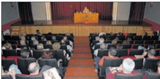
SESSIÓ FINAL EL CURS PASSAT

El proper 4 d'octubre tindrà lloc la conferència inaugural de l'Aula d'Extensió Universitària. Serà a les set de la tarda, al Teatre Auditori amb el periodista Antonio Franco i serà oberta a tothom.