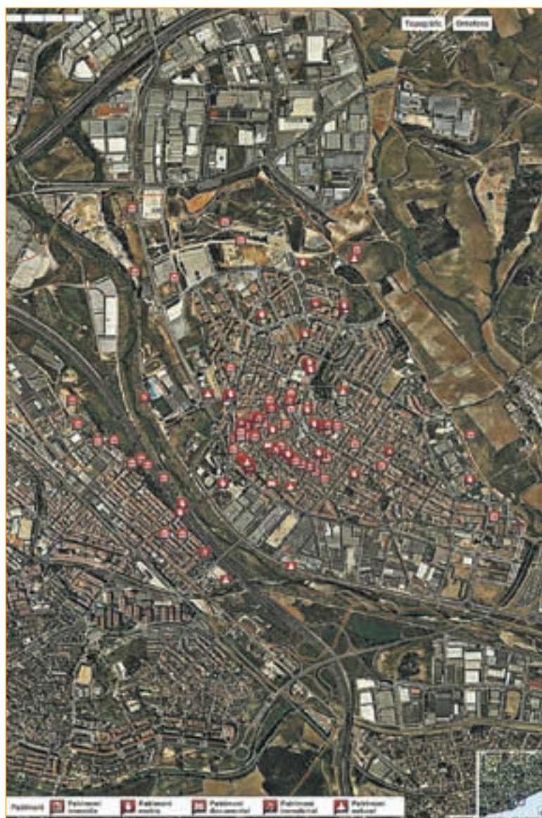
IMATGE DEL PLÀNOL INTERACTIU DE L'APLICACIÓ WEB DEL PATRIMONI DE RIPOLET.CAT

Més informació i visites: CIP Molí d'en Rata c/ del Molí d'en Rata, 1. Tlf. 93 594 60 57. molidenrata@ripollet.cat