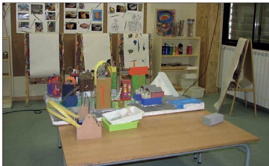
EL CENTRE OBERT SE UBICA EN LAS INSTALACIONES DEL CEIP EL MARTINET

El día 2 de noviembre, entró en funcionamiento el servicio de Centre Obert en el barrio de Can Mas, con el nombre de Els Molins. Esta iniciativa forma parte de los 22 programas que el Ajuntament de Ripollet está ejecutando dentro del Proyecto de Intervención Integral en el Barrio de Can Mas. El Centre Obert, situado en las instalaciones del CEIP El Martinet, es un espacio socioeducativo para niños y niñas de 3 a 12 años, donde se trabaja la sociabilidad, la integración y el soporte escolar. El día 18 de diciembre se celebró la inauguración oficial. También quiere ser un lugar de encuentro para las familias, donde podrán intercambiar experiencias relacionadas con la educación de sus hijos. Se trata de un servicio realizado por la Regidoria de Serveis Socials, que también gestiona la concesión de plazas para los niños que lo soliciten directamente