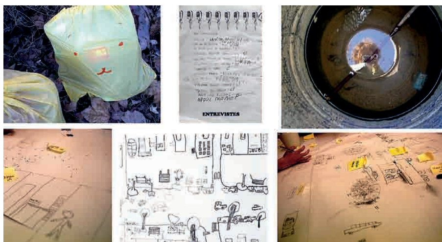
LOS NIÑOS REALIZARON UNA OBSERVACIÓN EXHAUSTIVA DE SU ENTORNO