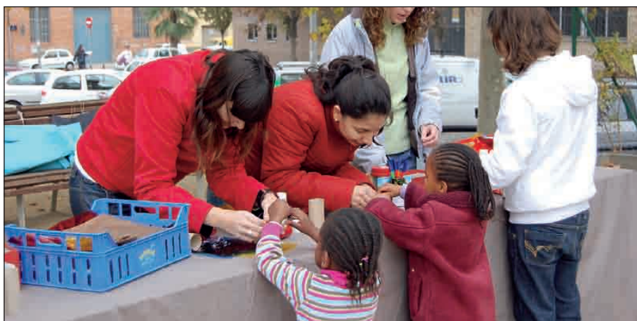
LA CASA DE NATURA Y EL CIP ORGANIZARON TALLERES PARA NIÑOS Y NIÑAS

Las actividades empezaron a las 10 de la mañana, con unas dinámicas de conocimiento. A través de la expresión corporal y el teatro, los asistentes expresaron qué sienten por el barrio y sobre qué temas les gustaría trabajar. Un barrio más limpio, el intercambio de conocimientos entre los vecinos y el trabajo en grupo fueron algunos de los conceptos que se plantearon en el debate para generar actividades en Can Mas.