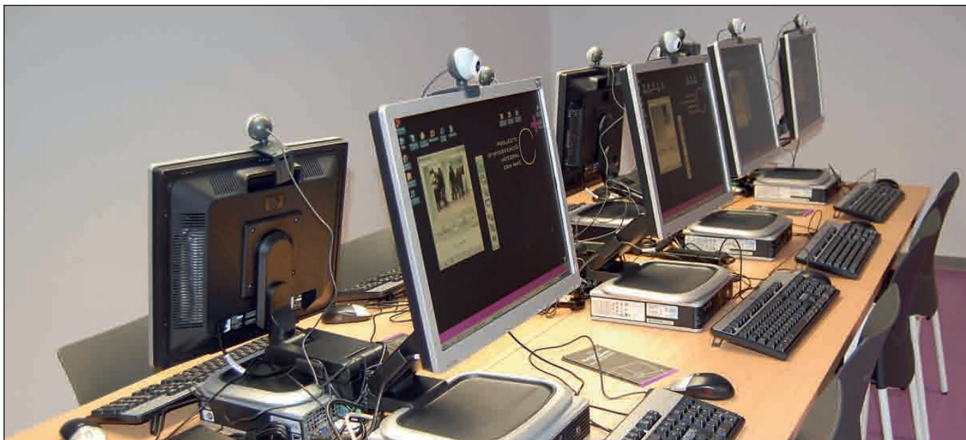
EL SERVICIO DE TELECENTRE YA LO HAN UTILIZADO MÁS DE 200 PERSONAS

Es un espacio polivalente donde también realizan actividades el Patronat d'Ocupació y la UBR