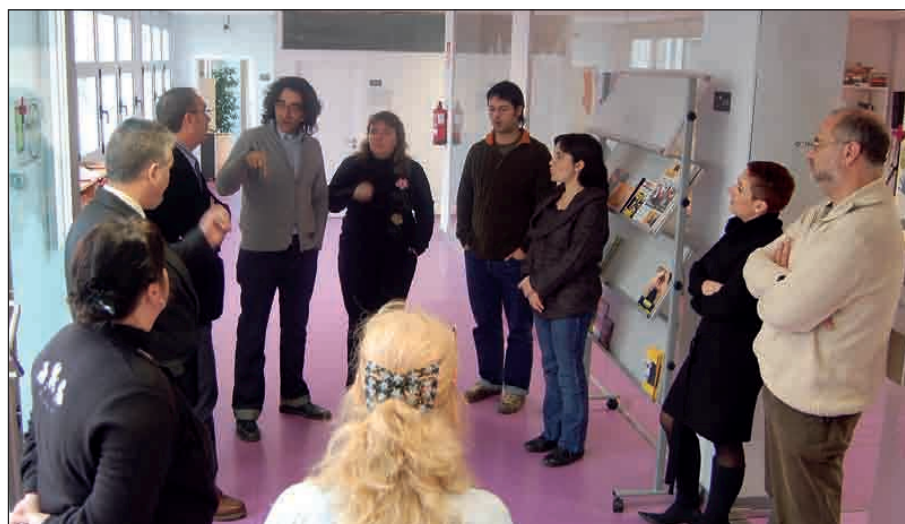
PARTE DEL PERSONAL DE LA OFICINA DEL PARQUE RIZAL

Nos felicitaron por el trabajo hecho y por el nivel de ejecución, que es muy satisfactorio. Hay que tener en cuenta que hasta que no está completado todo el proceso administrativo, de tramitaciones y adjudicaciones de todos los proyectos, no se han empezado a notar las mejoras en la calle. Nuestro plan tiene la particularidad que, además de los temas urbanísticos, que son muy importantes, tiene una gran carga de proyectos sociales y gustó mucho cómo se están llevando a cabo. Así que ellos se llevaron una grata sorpresa y nosotros salimos muy contentos por la buena nota que nos dió la Generalitat.