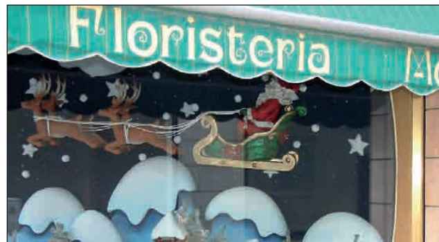
FLORS MONTRCADA, GANADOR DEL CONCURSO DE ESCAPARATES NAVIDAD 08