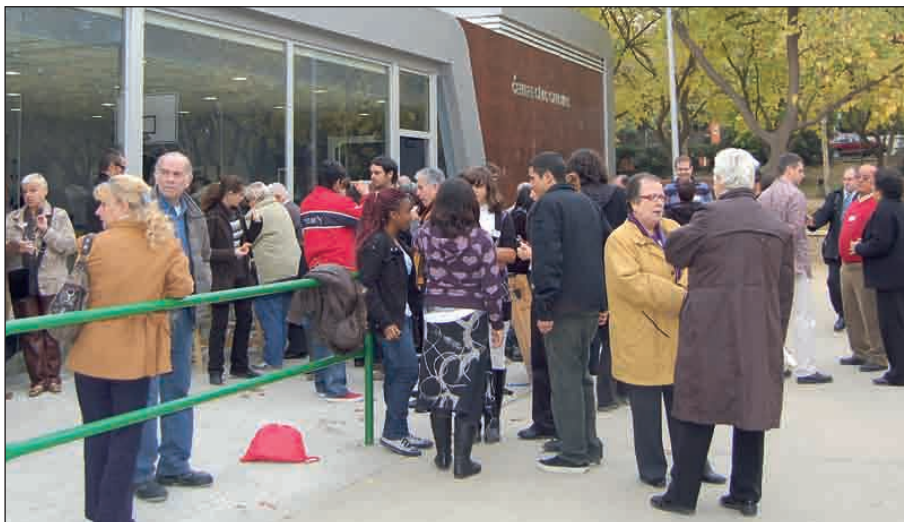
EL CENTRE CÍVIC ACOGIÓ A VECINOS Y VECINAS, MIEMBROS DE ASOCIACIONES Y DE LOS CENTROS EDUCATIVOS

Domingo, 29 de noviembre, unos sesenta vecinos y vecinas de Can Mas acudieron a la 1ª Jornada de Participación que se realizó en el Centre Cívic de Can Mas. El encuentro, que fue un éxito para organizadores y asistentes, sirvió para generar dos comisiones de trabajo, una de temas sociales y la otra de urbanismo, que trabajarán de forma conjunta con el Grupo Promotor de la Llei de Barris y organizarán una segunda jornada de debate para el mes de febrero.