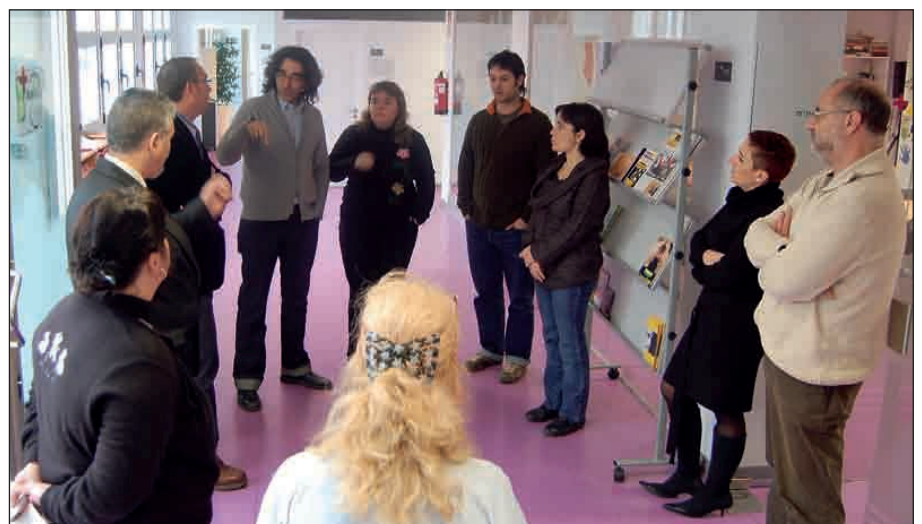
PART DEL PERSONAL DE L'OFICINA DEL PARC DE RIZAL.

Hem de tenir en compte que fins que no està completat tot el procés administratiu, de tramitacions i adjudicacions de tots els projectes, no s'han començat a notar les millores al carrer. El nostre pla té la particularitat que, a més dels temes urbanístics, que són importantíssims, té una gran càrrega de projectes socials i va agradar molt com s'estan duent a terme. Així que ells es van dur una grata sorpresa i nosaltres van sortir molt contents per la bona nota que ens va donar la Generalitat.