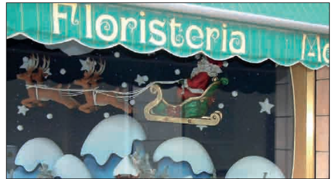
FLORS MONTRCADA, GUANYADORA DEL CONCURS D'APARADORS NADAL 08