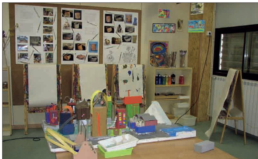
EL CENTRE OBERT S'UBICA A LES INSTAL·LACIONS DEL CEIP EL MARTINET

El dia 18 de desembre es va celebrar la inauguració oficial. També vol ser un punt de trobada per a les famílies, on podran intercanviar experiències relacionades amb l'educació dels seus fills. Es tracta d'un servei depenent de la Regidoria de Serveis Socials, que també gestiona la concessió de places als nens i nenes que ho sol·liciten