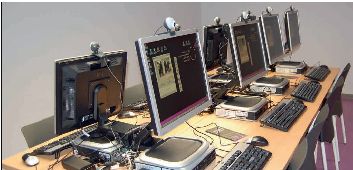
EL SERVEI DE TELECENTRE JA L'UTILITZEN MÉS DE 200 PERSONES

Es tracta d'un espai polivalent on també hi realitzen activitats el Patronat d'Ocupació i la UBR