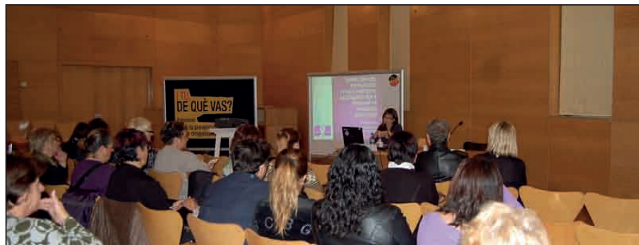
CLOENDA ACTIVITATS DIA INTERNACIONAL CONTRA LA VIOLÈNCIA VERS LES DONES

L'Espai Dona compta amb diferents serveis. Així, per parlar amb el departament tècnic, l'horari d'atenció és de 8 a 15 h, de dilluns a divendres. D'altra banda, el Punt d'Informació i Assessorament a Dones de Ripollet (PIAD) compta amb el servei d'atenció psicològica, en horari de 8.30 a 15 h, els dimecres i els divendres.