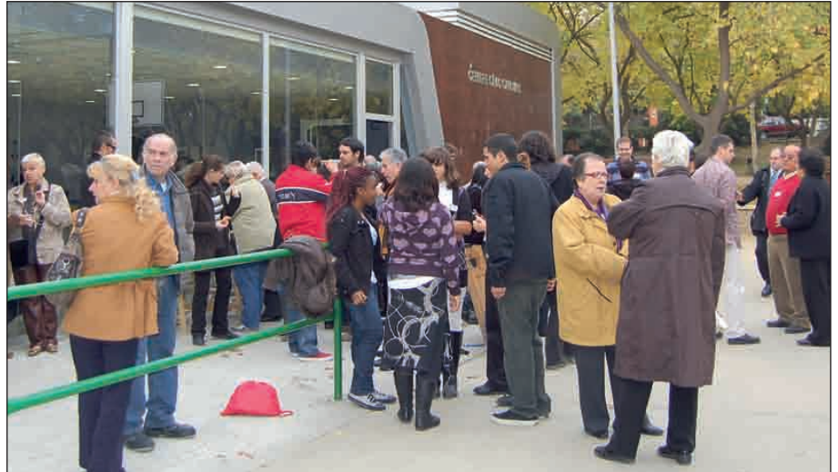
EL CENTRE CÍVIC VA ACOLLIR VEÏNS I VEÏNES, MEMBRES D'ASSOCIACIONS I DELS CENTRES EDUCATIUS DEL BARRI

Diumenge, 29 de novembre, una seixantena de veïns i veïnes de Can Mas van acudir a la 1a Jornada de Participació, que es va realitzar al Centre Cívic Can Mas. La trobada, que va ser tot un èxit, tant per als organitzadors, com per a les persones assistents, va servir per generar dues comissions de treball, una de temes socials i l'altra d'urbanisme, que treballaran de forma conjunta amb el Grup Promotor de la Llei de Barris i organitzaran una segona jornada de debat pel mes de febrer.