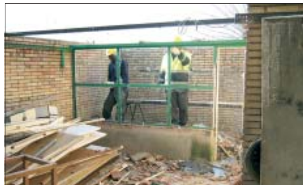
REFORMA DEL CEIP GINESTA

El passat 9 de febrer, els alumnes que ja han realitzat 334 hores de teoria van iniciar el període de pràctiques, amb 120 hores de treball en diferents restaurants de Ripollet, Cerdanyola i Montcada i Reixac.