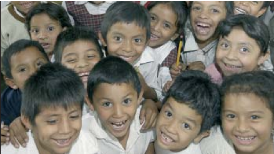
EL CENTRE CULTURAL HA ACOLLIT L'EXPOSICIÓ DURANT TOT EL MES DE FEBRER

Durant tot el mes de febrer, la Sala 1 d'exposicions del Centre Cultural ha acollit la mostra Compartir un somriure , organitzada pel Departament de Polítiques d'Igualtat.