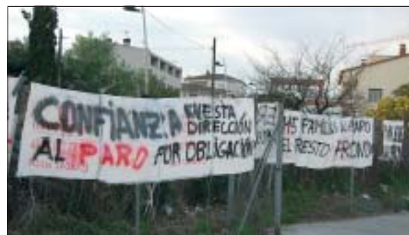
CARTELLS DE PROTESTA DAVANT DE LA SINTERMETAL

El departament de Treball de la Generalitat de Catalunya ha aprovat l'expedient de regulació d'ocupació presentat per l'empresa Sintermetal i que comportarà la suspensió del contracte de treball de 279 treballadors durant 44 dies. El comitè d'empresa ha declarat el seu malestar perquè aquesta resolució no recull cap dels arguments presentats pels representants dels treballadors.