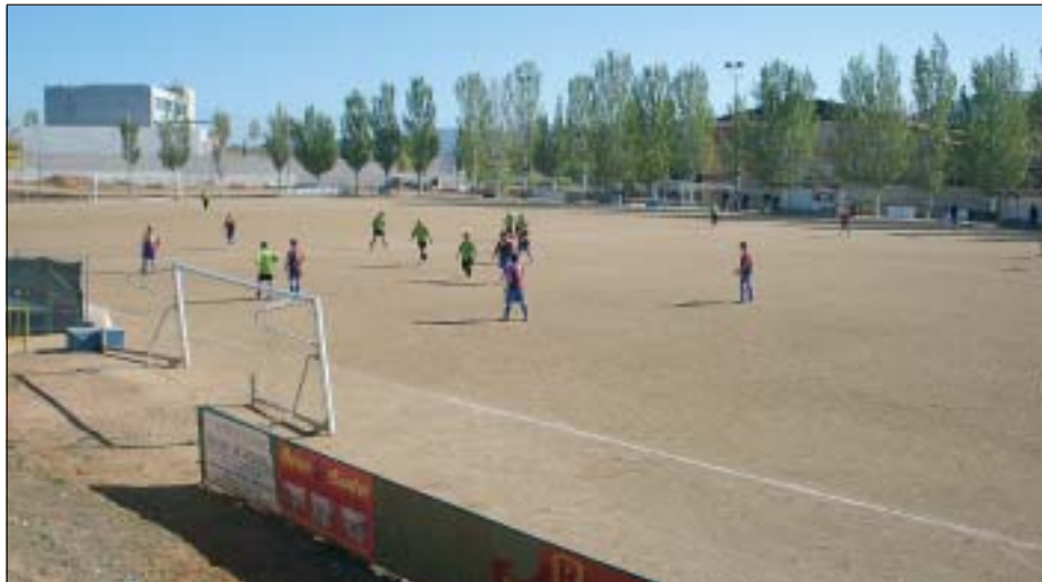
UN DELS PROJECTES INCLOU POSAR GESPA ARTIFICIAL AL CAMP DE L'INDUSTRIAL

S'aprova la licitació d'obres del Fons Estatal d'Inversió Local