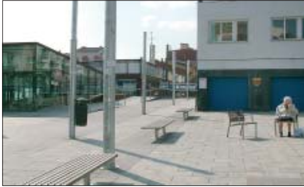
CRUILLA DE LA RAMBLA DE SANT ESTEVE AMB CARRER NOU.

Ara fa un any va començar la 2a fase de la remodelació de la plaça de Pere Quart i entorn, que va eliminar els desnivells entre calçada i zona de vianants en tot l'àmbit d'actuació: carrer Sol, Nou i el frontal de la rambla amb el Mercat.