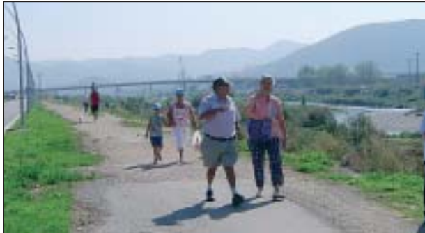
UNA CAMINADA PEL VIAL DEL RIU RIPOLL

Tots els éssers humans, disposem de tres recursos fonamentals per auto-regular la nostra salut: mantenir una dieta equilibrada, com és el cas de la mediterrània, no fumar i fer exercici físic. Definim exercici físic com a tota activitat física planificada, estructurada, repetitiva i que es fa amb la intenció de millorar el cos i la ment, que va des de caminar a fer algun esport. L'exercici ha pres molta importància a les darreres dècades, sobretot en l'àmbit de la salut. És per aquest motiu que s'estan