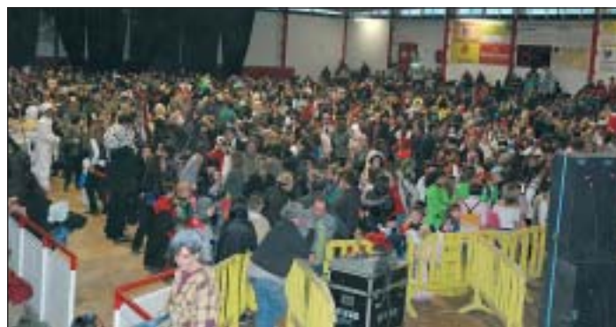
EL CARNAVAL INFANTIL VA INICIAR EL PROGRAMA D'ACTES