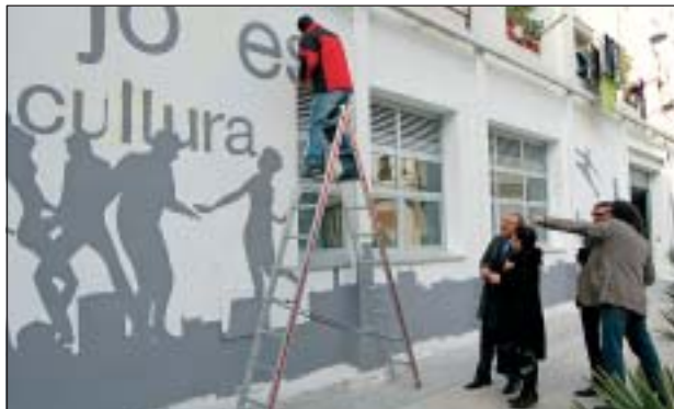
VISITA D'OBRES A LES DEPENDÈNCIES DE L'OFICINA DE LA LLEI DE BARRIS, 10 DIES ABANS DE LA SEVA OBERTURA AL PÚBLIC

La compra, reforma i equipament d'aquestes noves dependències ha costat uns 760.000 euros. Tenen uns 650 metres, repartits en tres grans sales: el Kftí de Can Mas, el Telecentre i la sala tècnica, que acull l'Oficina de la Llei de Barris i l'Espai Dona, entre d'altres. A més, hi ha diversos despatxos per a l'atenció personalitzada i està lliure de barreres.