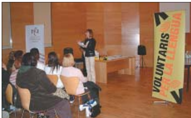
SESSIÓ DE CONSTITUCIÓ DE PARELLES L'OCTUBRE DE 2008

Aquest consisteix a posar en contacte persones que parlen català amb altres que el volen aprendre o millorar-ne la fluïdesa. Es tracta de quedar una hora a la setmana, durant un mínim de deu setmanes, per parlar de temes quotidians en un entorn real i distès. L'Oficina de Català distribueix els participants en pare-