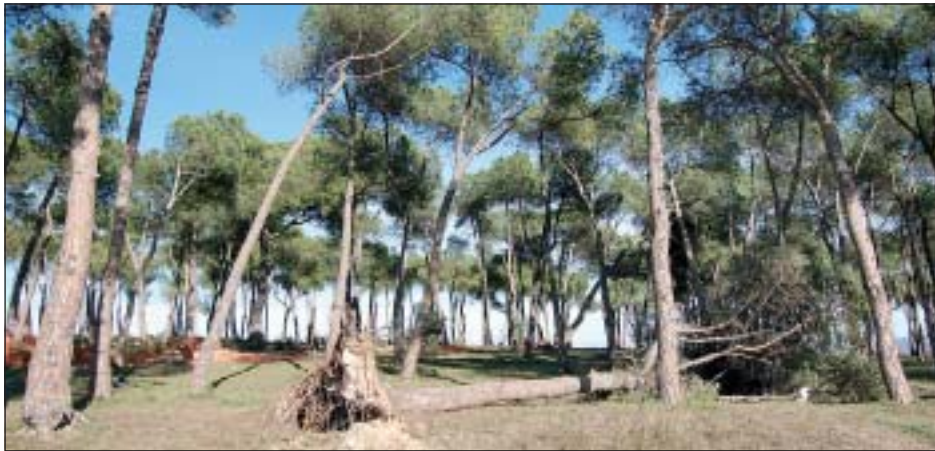
ALGUNS ARBRES CAIGUTS AL PARC DELS PINETONS

Els Bombers de la Generalitat de Catalunya van fer 10 sortides a la nostra població, el passat 25 de gener, degut a les fortes ventades. Fins aquest moment, només es coneix el cas d'una voluntària de Protecció Civil que es va trencar diverses costelles, en ser colpejada per un contenidor. Destaca però, un important volum de danys materials, especial-