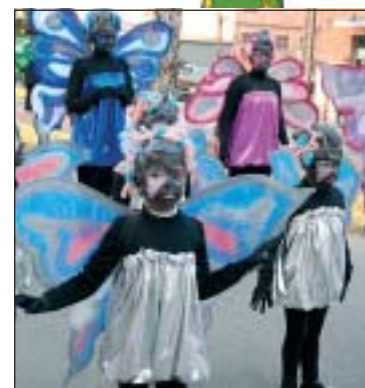
EL CONCURS VA COMPTAR AMB UN TOTAL DE 13 COMPARSES