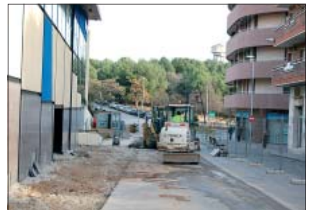
PROCÉS DE REASFALTAT DEL CARRER DE PIZARRO

A finals de gener es van iniciar les obres de remodelació del carrer de Pizarro, en el tram comprès de la rambla de Sant Esteve fins el carrer de Sant Josep. Aquestes obres consisteixen en l'asfaltat del carrer, l'ampliació de les voreres fins arribar als 2,5 metres, eliminació de barreres arquitectòniques i col·locació d'arbrat i mobiliari urbà nou. El temps previst per a dur a terme aquestes obres és de cinc mesos. Per tal de minimitzar les molèsties, tant als veïns i veïnes com als comerços i al trànsit rodat de la zona, durant tot el procés sempre hi haurà un carril obert a la circulació, en direcció al Poliesportiu Municipal Joan Creus. Recordar igualment que, en acabar les obres de remodelació, el carrer de Pizarro passarà a ser d'un sentit únic de la circulació. La remodelació del carrer de Pizarro és una de les obres més rellevants que s'executaran durant aquest any, tant pel seu import, d'uns 560.000 euros, com per la singularitat d'aquest carrer en la trama del municipi.