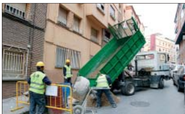
TREBALLS REALITZATS AL CARRER DE ZAMENHOF

Inclòs en el projecte de remodelació del barri de Can Mas, una de les actuacions organitzades des del Patronat Municipal d'Ocupació és el disseny i execució de les obres necessàries per tal d'eliminar les barreres arquitectòniques del barri de Can Mas. Actualment s'estan eliminant totes les del carrer de Girona amb Sant Pol, Mercè amb Girona, València amb Girona i la vorera de Dr. Zamenhof, des de Sant Jaume fins Monturiol, a part d'al-