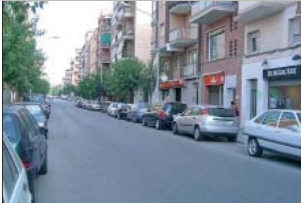
INICIALMENT LA RAMBLA DE SANT JORDI HAVIA D'ESTAR LLIURE D'APARCAMENT, PERÒ FINALMENT ES FARÀ DE ZONA BLAVA