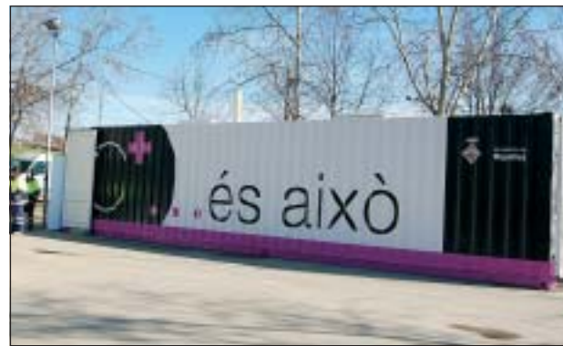
VISITA D'AUTORITATS A L'EXPOSICIÓ 'C+... ÉS AIXÒ', SITUADA DAVANT EL CENTRE CÍVIC CAN MAS