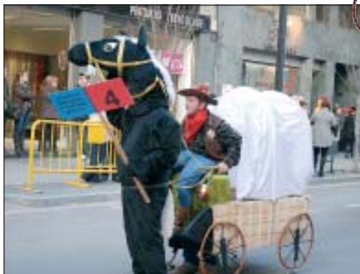
RECORRIENDO EL FAR WEST VA SER PREMIAT COM A MILLOR DISFRESSA INDIVIDUAL O COMPARSA REDUÏDA