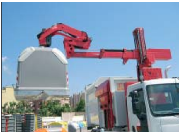
EL NOU SISTEMA ÉS MENYS SOROLLÓS, MÉS HIGIÈNIC I MÉS RÀPID

El nou contracte de recollida d'escombraries i neteja viària s'ha adjudicat provisionalment per un import anual de 2,4 milions d'euros i per un període de 8 anys a l'empresa URBASER, qui ja venia encarregant-se de la recollida a la població i que ha estat novament escollida entre les set propostes presentades.