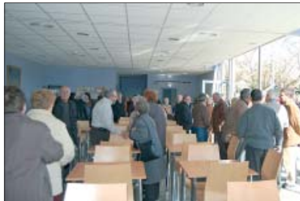
LA INAUGURACIÓ DEL CENTRE CÍVIC CAN MAS VA COMPTAR AMB GRAN ASSISTÈNCIA DE VEÏNAT DE CAN MAS