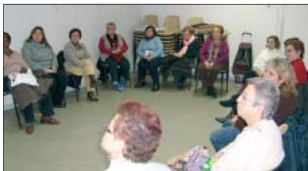
UN DELS TALLERS QUE ORGANITZA POLÍTIQUES D'IGUALTAT

Aprofitant la celebració de l'Any Europeu de la Creativitat i la Innovació, la Regidoria de Polítiques d'Igualtat ha organitzat, durant el mes de febrer, un taller amb el nom Vídeo en un minut , adreçat a dones del municipi i dinamitzat per l'entitat Drac Màgic. En el taller s'ha enregistrat un vídeo d'un minut de cadascuna de les participants sobre allò que els suggereixi un tema concret. D'altra banda, des de l'any 2005 s'inclou a la Guia d'Activitats Educatives la possibilitat que els ins-