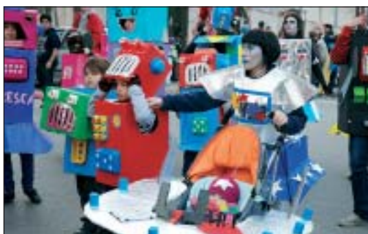
ELS ESPLAIS LA GRESCA I L'ESTEL TAMBÉ VAN PARTICIPAR AL CARNAVAL 2009