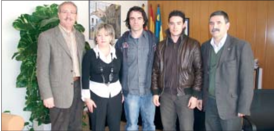
L'ALCALDE I EL REGIDOR DE COMERÇ AMB ELS GUANYADORS

La Pastisseria Bomboneria Mató, situada a la rambla de Sant Jordi de Ripollet ha estat la guanyadora del premi local, amb 500 euros, de la 39ª edició del Concurs d'Aparadors de Nadal, que organitza cada any