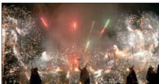
LES BRUIXES VAN TORNAR A TANCAR LA RUA DE CARNAVAL AMB EL SEU ESPECTACLE DE MÚSICA I FOC