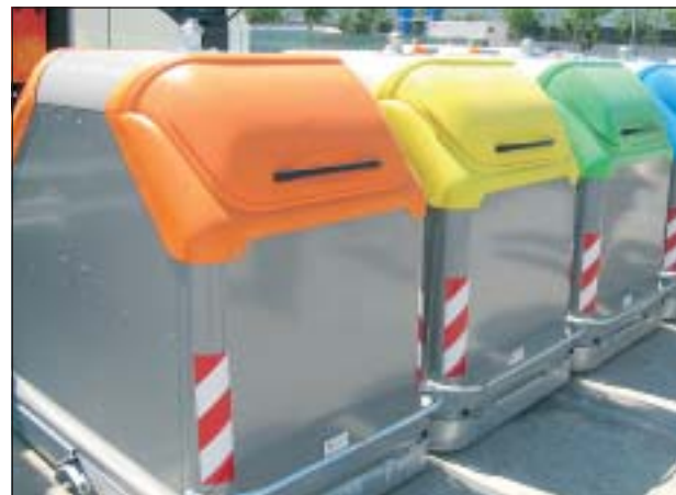
AMB EL NOU CONTRACTE ES CANVIARAN MÉS DE 600 CONTENIDORS