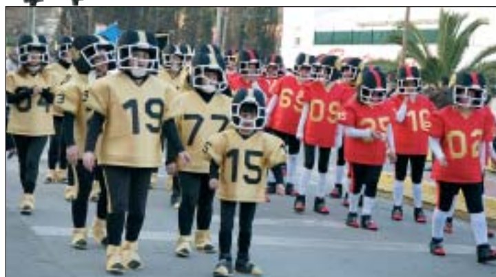
LA GRAN FINAL VA REBRE EL PREMI AL MILLOR VESTUARI