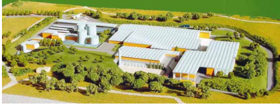
Maqueta del proyecto definitivo del Ecoparc-2

El proyecto definitivo reduce en un 25% la capacidad de tratamiento proyectada inicialmente, pasando de 325.000 a 240.000 toneladas al año. Además, durante los dos primeros años, su capacidad máxima será de 190.000 toneladas. Tal