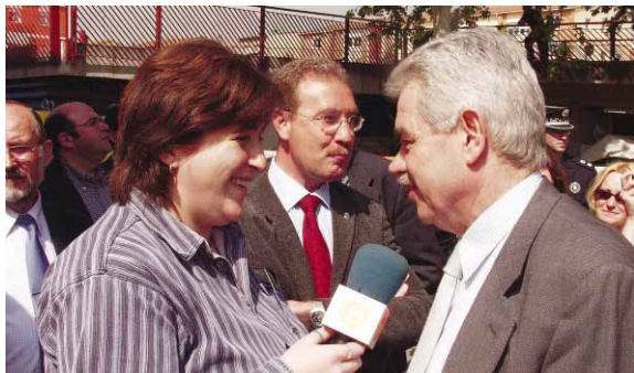
Parquial Maragall intervenin en es "3 minutos de gloria"

L'emissora municipal realitza una programació especial estiu de l'1 de juliol fins al 15 de setembre. En lloc de la programació habitual, emet el programa musical La cançó de l'estiu i informatius. Com a novetat d'enguany, durant el mes d'agost també hi haurà butlletins infor-