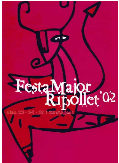
Cartell de la Festa Major 2002 de Ripollet

El pasado 17 de junio el alcalde, acompañado de la presidente del Patronat Municipal de Cultura i Joventut, presentó el programa de Fiesta Mayor a los medios de comunicación. Con ello se cerraba un periodo de trabajo que es el de la elaboración y cierre del programa, en el que participan los miembros del consejo de administración del patronato y diversas entidades. Finalmente, por ejemplo, no podremos contar con la participación Manu Tenorio, a pesar de las gestiones realizadas, por un problema en su calendario de actuaciones. Sin embargo, tal como resaltaron en la presentación, el programa, que dentro de unas semanas se distribuirá a todos los domicilios, incluye una variada oferta para todos los públicos. El presupuesto de la fiesta es de 162.000 €, casi 27 millones de pesetas.