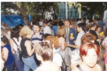
Festa de fi de curs dels talleristes del Centre Cultural

La Festa de l'Esport Local tornà a ser èxit en l'edició d'enguany, amb la participació de 4.000 persones, a banda d'escoles i monitors. Durant aquesta temporada, el PAME ha promocionat la pràctica de l'esport entre uns 1.500 escolars.