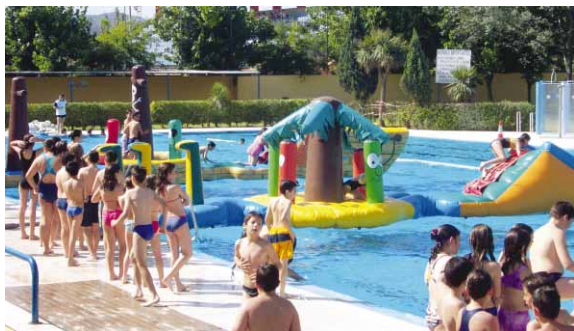
Durant el matí es van realitzar activitats per als nens participants a l'esport

A banda d'aquestes activitats, el PAME també ha organitzat cursos de natació per a nadons