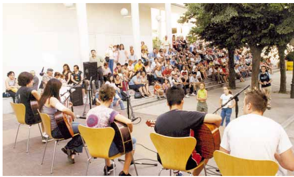
Els alumnes van participar a un berenar, que va comptar amb l'actuació dels grups de guitarra i balls de saló

Un total de 500 alumnes dels cursos i tallers del Centre Cultural celebraren el passat dia 19 de juny el final de curs amb un berenar i actuacions dels grups de guitarra i balls de saló. A més, durant el mes de juny, les obres dels alumnes dels tallers de pintura, art, ceràmica russa i arts decoratives han estat exposades al Centre Cultural.