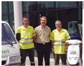
Presentación de los nuevos operarios y de los recursos materiales