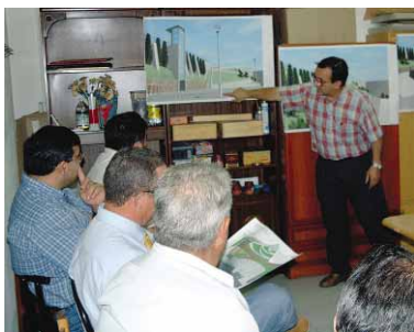
Un ascensor salvará la distancia entre la calle Maragall y la calle Padró

El proyecto de supresión de las barreras arquitectónicas del parque Maria Lluïsa Galobart fue presentado el pasado 26 de junio a los vecinos de la calle Maragall, una vez aprobada la adjudicación de su redacción a Alexandre Egea por 10.800