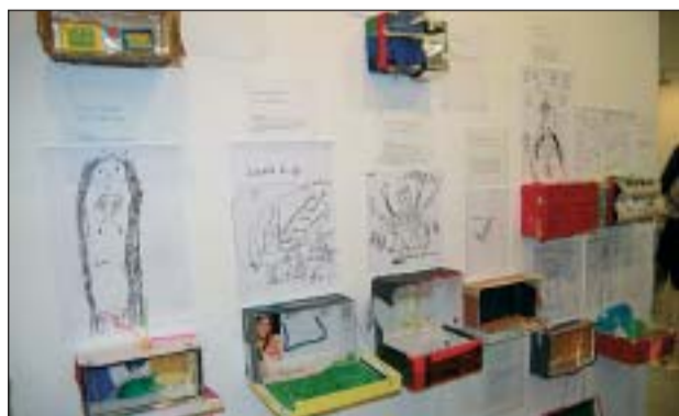
UNA MOSTRA DE LA FEINA FETA PELS ALUMNES DE LES ESCOLES DE RIPOLLET

El Patronat de Cultura, amb la col·laboració de la Regidoria d'Educació, a través del Pla Educatiu d'Entorn, va organitzar entre el 19 i el 23 de maig el final de curs dels programes d'arts escèniques i d'arts visuals del projecte EduArt. S'ha vingut desenvolupat a les escoles de Ripollet des del passat mes d'octubre i ha comptat amb la participació de sis col·legis,