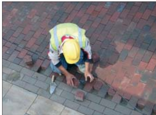
PAVIMENTACIÓ DEL CARRER NOU

El projecte de remodelació de l'entorn del mercat destaca aplicació la cota zero, de manera que vorera i carretera estan al mateix nivell. Per a protegir els qui van a peu s'estan posant pilones i jardineres i, fins i tot, es limitarà la circulació de cotxes en alguns trams.