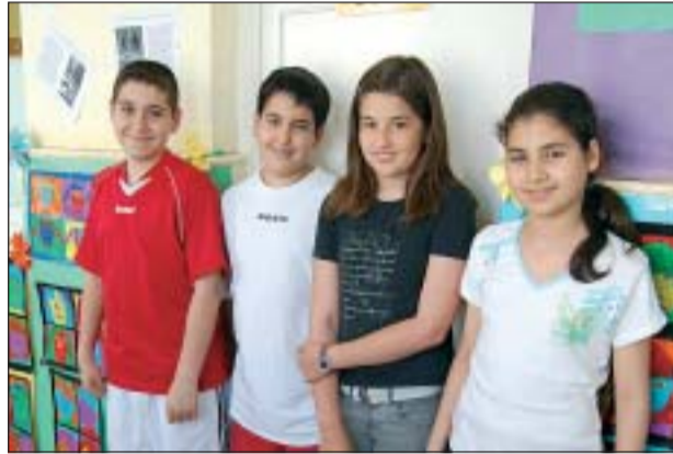
ELS JOVES LOCUTORS DEL CEIP ANSELM CLAVÉ

Un grup de 6è del CEIP Anselm Clavé ha estat un dels 8 finalistes del concurs de nous talents periodístics DiguesCom! que ha organitzat ComRàdio, en col·laboració amb les ràdios municipals i el Dept. d'Educació de la Generalitat.