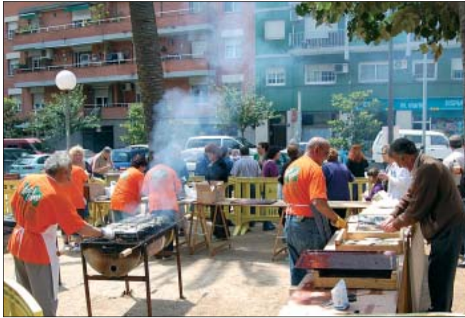
SARDINADA POPULAR AL PARC DE MARIA LLUÏSA GALOBART

Degut a les abundants plujes de tot el cap de setmana, la gran majoria de les activitats previstes es van suspendre, amb excepció de la Sardinada Popular, que es va celebrar a partir de la una del migdia. A més, també es van instal·lar uns jocs inflables pels nens i nenes al parc de Maria Lluïsa Galobart.