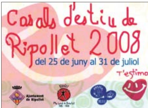
ELS CASALS ES FARAN ALS CEIP ESCURSELL, TATCHÉ, GINESTA I CLAVÉ

juny es faran públiques les llistes de sol·licituds i en cas que superi l'oferta de places, el dia 12 es farà un sorteig públic al Centre Cultural. Els casals aniran