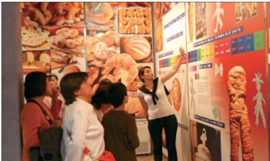
UN MOMENT DE LES VISITES GUIADES AL MOLÍ D'EN RATA