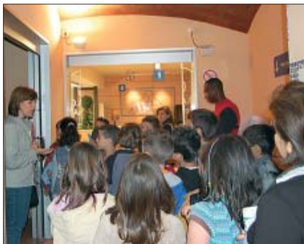
DESPRÉS VAN CONÈIXER L'OFICINA D'ATENCIÓ AL CIUTADÀ

Després, la visita va continuar a la sala de reunions on té lloc la Junta de Govern Local. Un altre lloc per on van passar els nens va ser l'Oficina d'Atenció Ciutadana de l'Ajuntament.