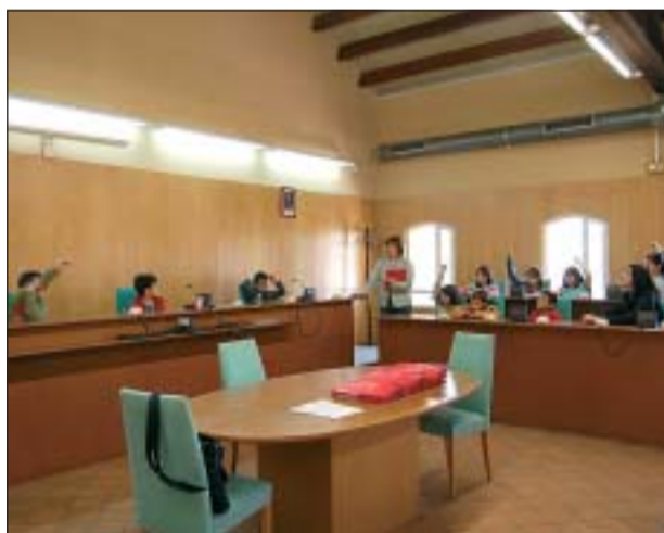
FINALMENT ELS ALUMNES VAN FER DE REGIDORS I REGIDORES

Fer de regidors i regidores és l'activitat que més agrada als alumnes