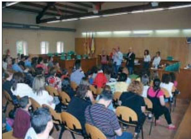
UN MOMENT DE LA RECEPCIÓ A LA SALA DE PLENS

El passat 23 de maig l'Ajuntament de Ripollet va oferir una recepció a les sis de la tarda per a totes les persones i entitats que han participat en la creació i enregistrament del ja oficial 'Himne de Ripollet'. Tots els presents van rebre un obsequi com a agraïment per la feina feta.