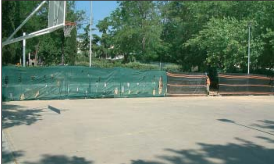
LES OBRES DEL CENTRE CÍVIC DE CAN MAS VAN COMENÇAR A FINALS DE MAIG

Per últim també es va autoritzar la subvenció, per part de l'Ajuntament, del 100% del cost dels anomenats 'Tedis' o tests d'edificació que les comunitats de veïns han de realitzar a l'hora de rehabilitar un immoble.