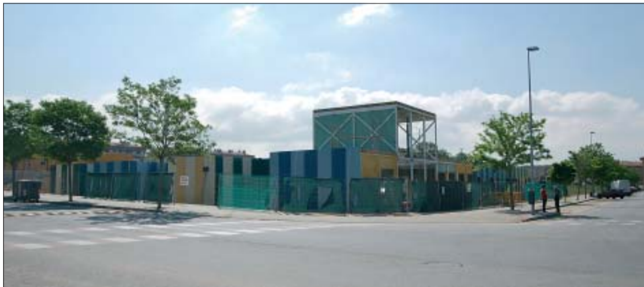
S'ESTÀ CONSTRUÏNT A LA PARCEL·LA, SITUADA A LA CANTONADA DE L'AVINGUDA DE CATALUNYA AMB EL CARRER BARBERÀ DEL VALLÈS

Les obres de la segona llar d'infants avancen a bon ritme i complint el calendari, de cara a la seva obertura el proper mes de setembre. La primera fase de l'equipament, que acollirà 61 infants de 0 a 2 anys, costarà aproximadament un milió d'euros i tindrà una superfície d'uns 700 metres construïts.