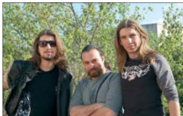
UNA PART DELS COMPONENTS DEL GRUP

El grup local de rock melòdic acaba d'estrenar nou disc i nova discogràfica.