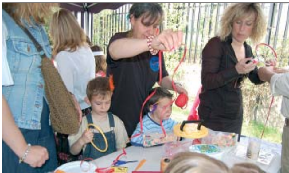
ELS NENS I NENES VAN APROFITAR EL MATÍ PER FABRICAR EL SEU PROPI ATRAPASOMNIS