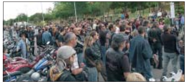
L'ACTE DE RIPOLLET MOTARDS VA COMPTAR AMB EL SUPORT DEL PMC

Vols formar part de la propera exposició temporal del Centre d'Interpretació del Patrimoni Molí d'en Rata?