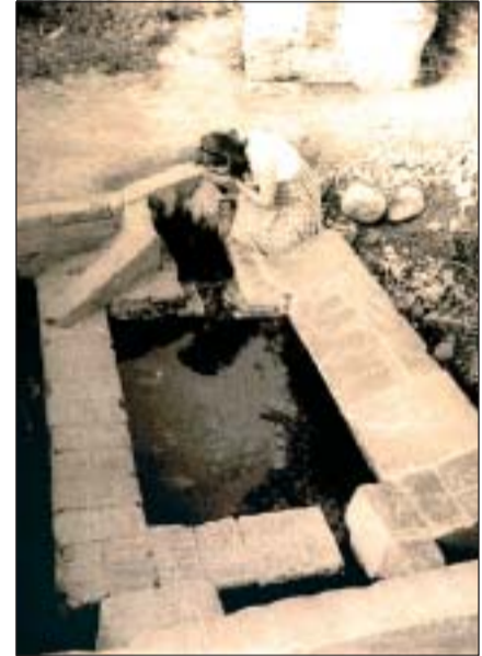
IMATGE ANTIGA DE LA FONT