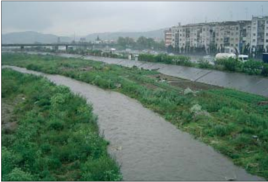
EL RIU RIPOLL ÉS EL CENTRE DE MOLTES DE LES ACTIVITATS DE LA CASA DE NATURA

El dia 5 de juny se celebra el Dia Mundial del Medi Ambient, instituint per les Nacions Unides, amb l'objectiu de donar a conèixer la necessitat de protegir i millorar el medi ambient entre la ciutadania. Ripollet s'adhereix a aquesta commemoració amb la presentació de la publicació 'Un conte de veritat', que serà escenificat a la Biblioteca de Ripollet. L'acte, que tindrà lloc a les 17:30 hores, està or-