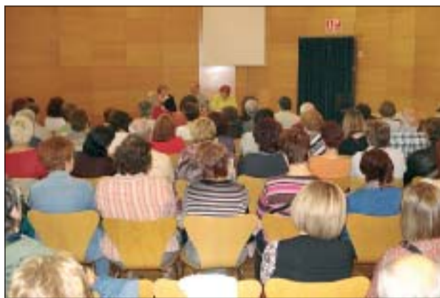
LA PRESENTACIÓ DE L'ASSOCIACIÓ VA TENIR LLOC AL CENTRE CULTURAL