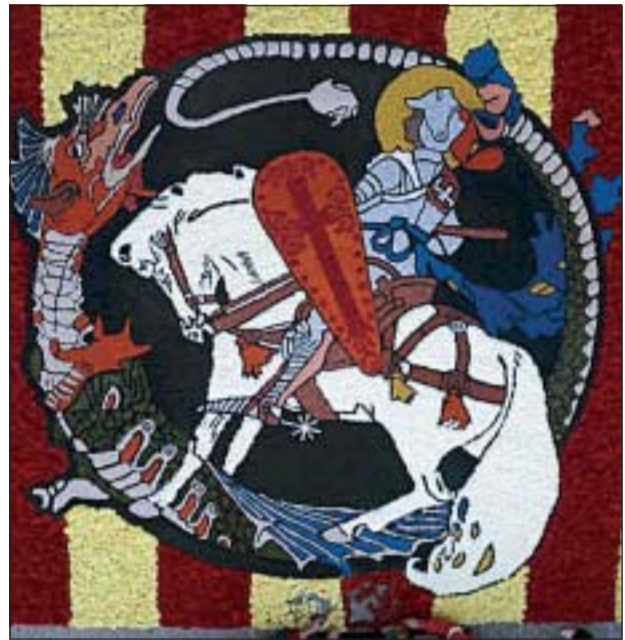
IMATGE DE LA CATIFA QUE ES VA OFERIR A LA MORENETA

Ripollet acollirà, el proper 15 de juny, la 4a Trobada de Catifaires de Catalunya, organitzada per l'Associació Cultura i Tradició. Les catifes de flors, que s'instal·laran a la plaça Onze de Setembre, comptaran amb la participació d'entitats catifaires d'arreu de Catalunya. A la festa també hi participaran els grallers i gegants de Ripollet.