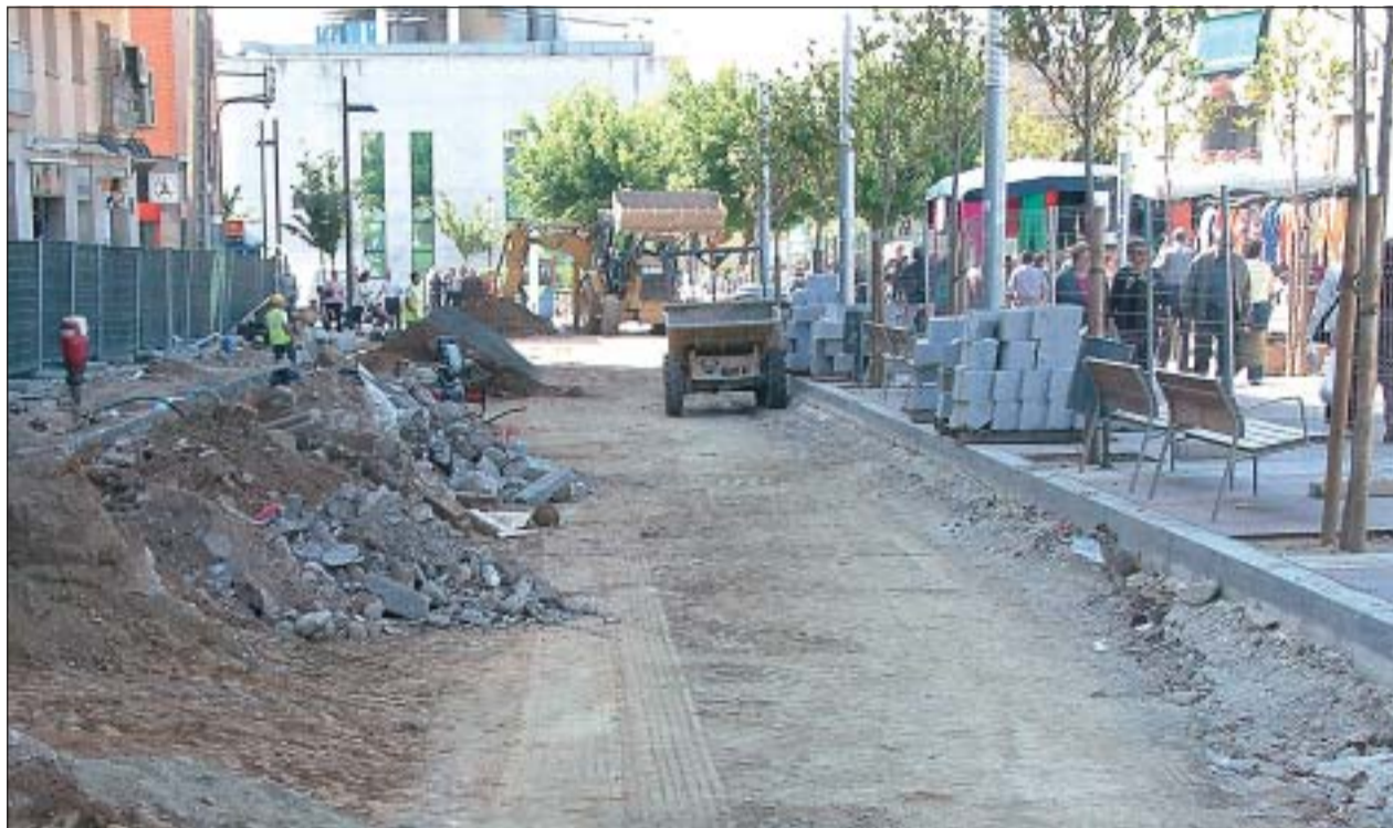
LA SEGONA FASE DE REMODELACIÓ DE LA RAMBLA DE SANT ESTEVE ESTARÀ ACABADA A MITJANS D'AGOST

Durant el mes de maig s'han iniciat a Ripollet les obres de remodelació de la rambla de Sant Esteve, en el tram inclòs entre els carrers Nou i Canigó. Aquests treballs, inclosos en la segona fase de la remodelació de la plaça de Pere Quart i entorn, tenen un cost total de 727.061,29 euros i són executades per l'empresa SEPISA. Està previst que la remodelació estigui acabada a mitjan d'agost.