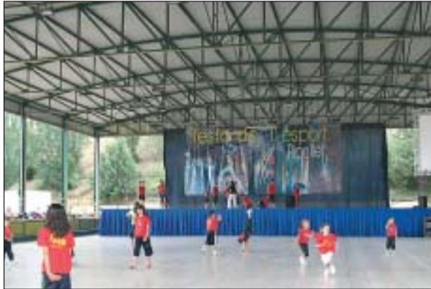
L'EDICIÓ DE L'ANY PASSAT DE FESTA DE L'ESPORT

Així, el dia 14 el matí hi haurà inflables i activitats esportives adreçades als nens al Poliesportiu Municipal.