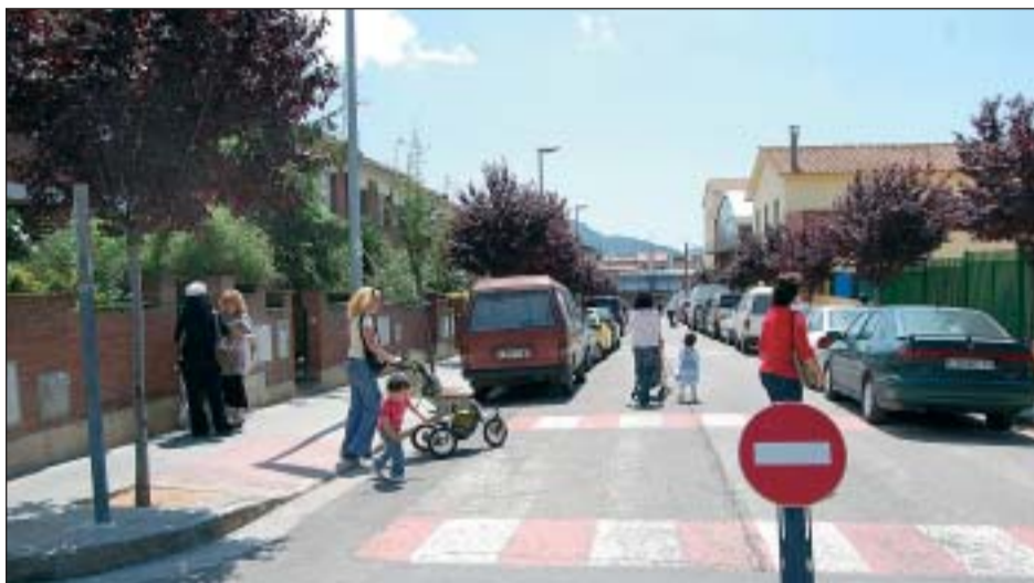
EL CARRER DE LES ESCOLES ÉS UN DELS TRAMS QUE QUEDA TALLAT AL TRÀNSIT

Des del passat 19 de maig i fins el darrer dia de curs, els alumnes del CEIP Anselm Clavé estan participant a la prova pilot de la campanya 'A peu a l'escola'. El projecte està organitzat per les regidories d'Educació i Medi Ambient, amb la col·laboració de la Policia Local.